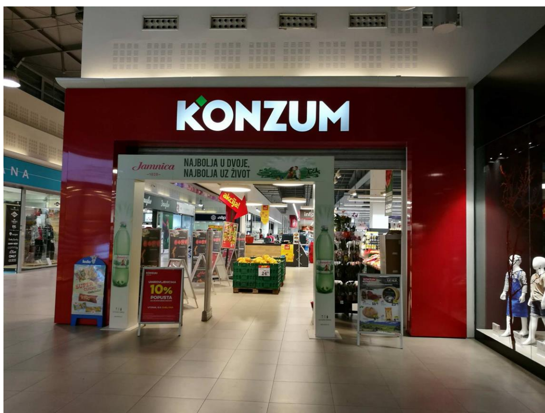
Slika 1. Ulaz u trgovinu Konzum

Trgovine unutar trgovačkog centra imaju staklene izloge što čini prostor otvorenijim i pristupačnijim.