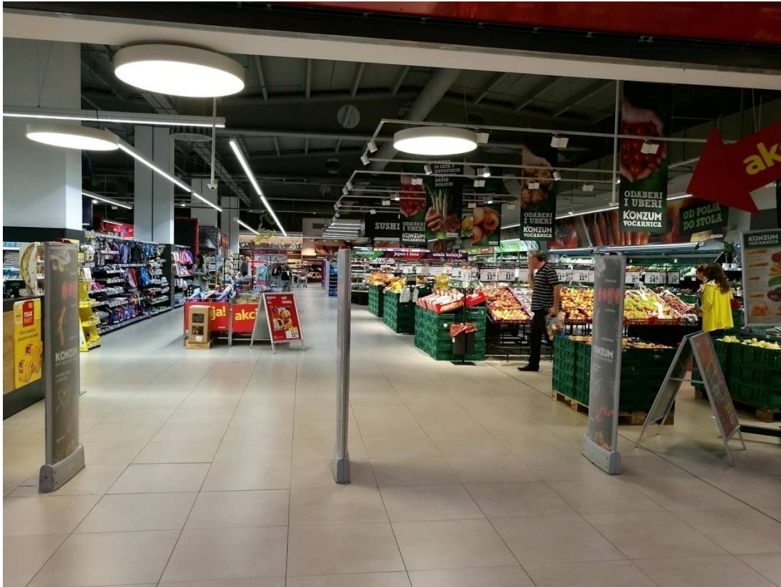
Slika 2. Odjel voća i povrća

Samim ulaskom u prodavaonicu uočava se šarenilo iz odjela voće i povrće te dobro osvijetljen prostor.