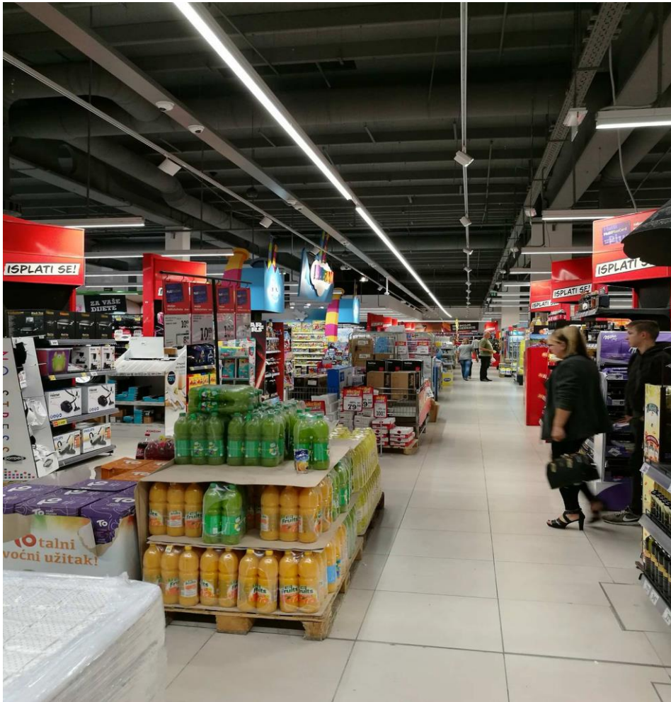
Slika 3. Proizvodi na akciji u središtu Konzuma

Akcijski proizvodi su postavljeni usporedno s policama odmah blizu ulaza u trgovinu.