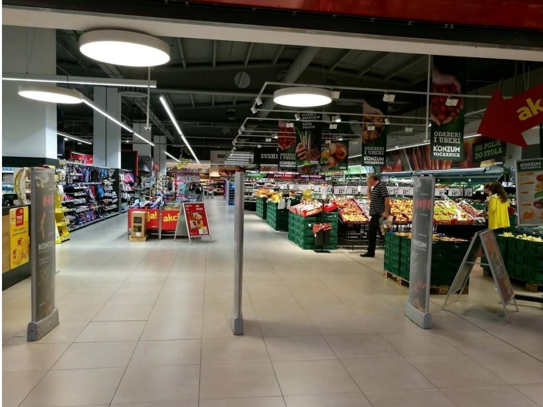
Slika 2. Odjel voća i povrća

Samim ulaskom u prodavaonicu uočava se šarenilo iz odjela voće i povrće te dobro osvijetljen prostor.