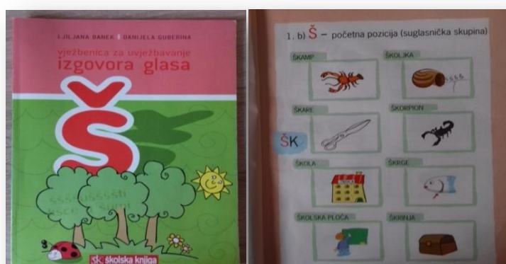
Slika 5. Vježbenica za uvježbavanje izgovora glasa /š/ (vanjski izgled i unutarnji sadržaj)

Počele smo raditi vježbe iz tablice 4., a nakon tih vježbi koristile smo vježbe iz knjige Izgovor: kako ga poboljšati (Posokhova, 2005.) za formiranje artikulacije glasa /š/. Djevojčica je otvorila malo usta i podigla jezik iza gornjih zuba, ali nije smjela dodirivati jezikom zube niti nepce, jezik je trebao visiti. U tom položaju trebala je puhati na jezik. Ispitivala sam je čuje li kako puše vjetar. Tijekom ove metode čuo se zvuk koji nalikuje na glas /h/ više nego na glas /š/. Dala sam joj uputu da puše na vršak jezika i istovremeno izgovara glas /s/. Ponavljale smo vježbu nekoliko puta. Nakon vježbanja, krenule smo s radom u vježbenici. Započele smo s riječima koje počinju slogom ša-. Riječi koje sam djevojčici izrekla, mogu se vidjeti u tablici 5. Ana je ponavljala riječi za mnom i tako poboljšala svoj izgovor. Na kraju je djevojčica bojala bojanku.