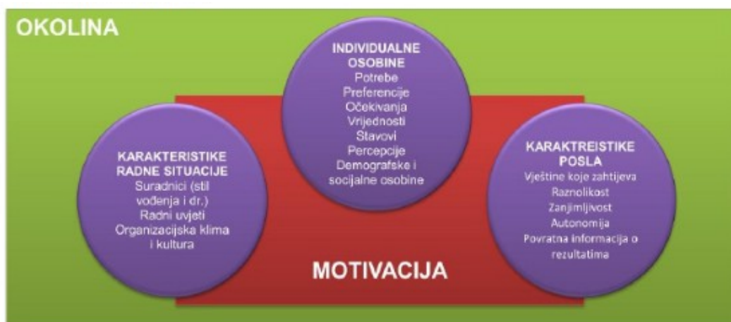
Slika 1. Čimbenici koji utječu na individualnu motivaciju u organizacijskim uvjetima