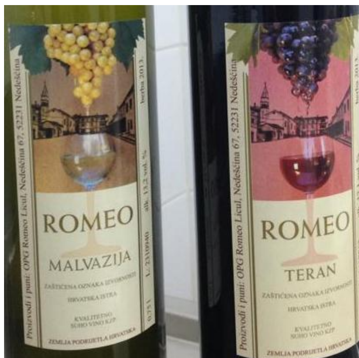
Slika 7: Etikete Malvazije i Terana

Razgovarajući sa marketinškim stručnjacima Licul donio je vrlo brzo odluku kako će naljepnica navedenih vina izgledati. Bilo je jasno da mora biti prepoznatljiva i da je niti jedno vino bilo kojeg konkurenta ne smije nositi.