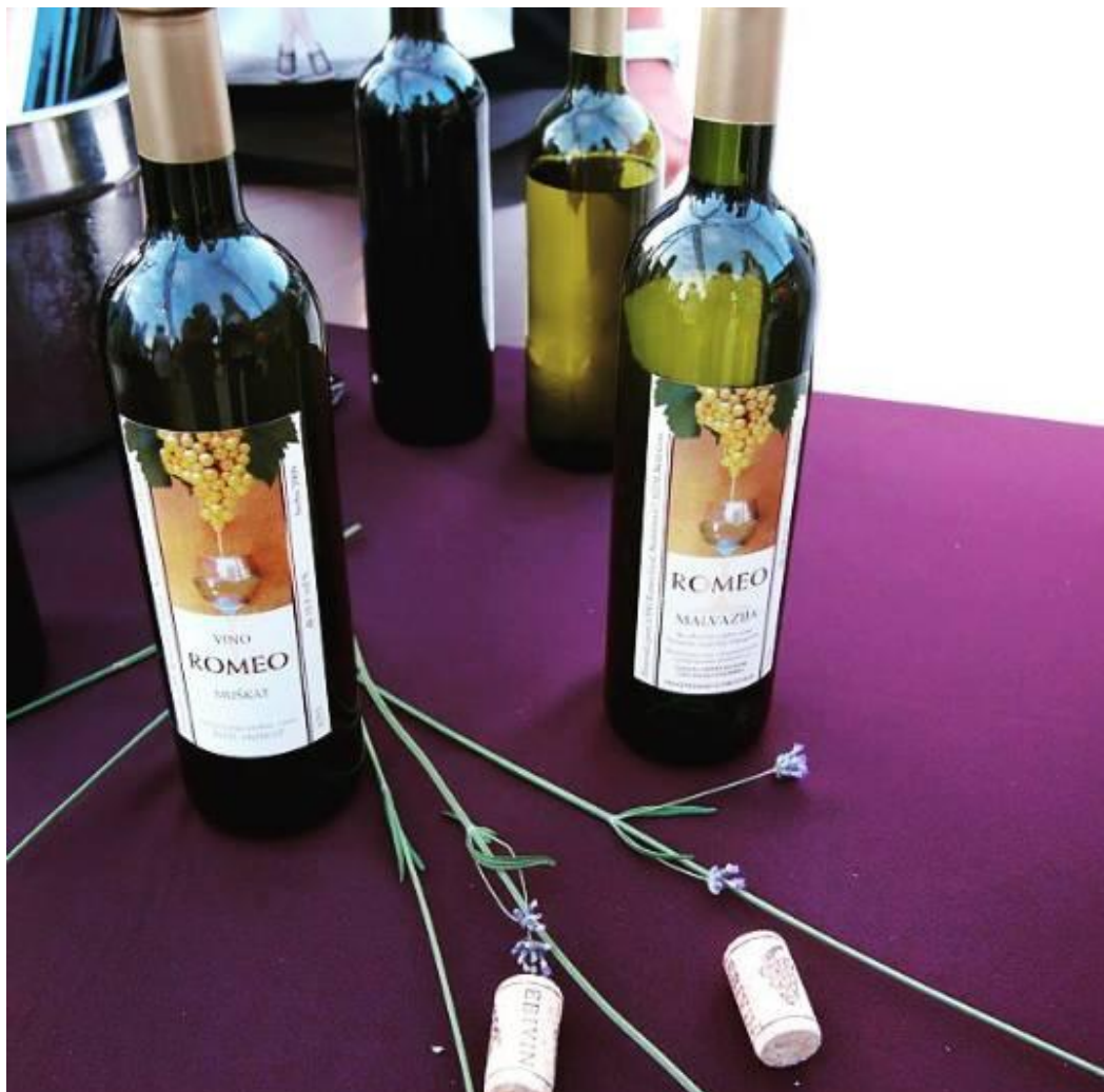
Slika 3: Vina Licul