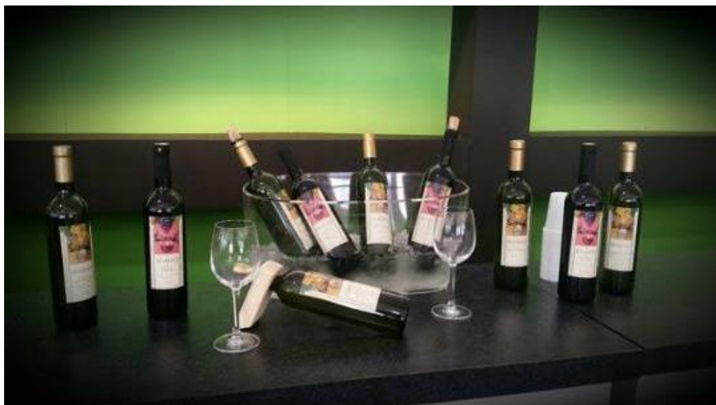
Slika 5: Malvazija i Teran