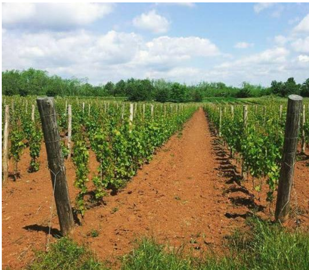
Slika 3: Vinograd Licul