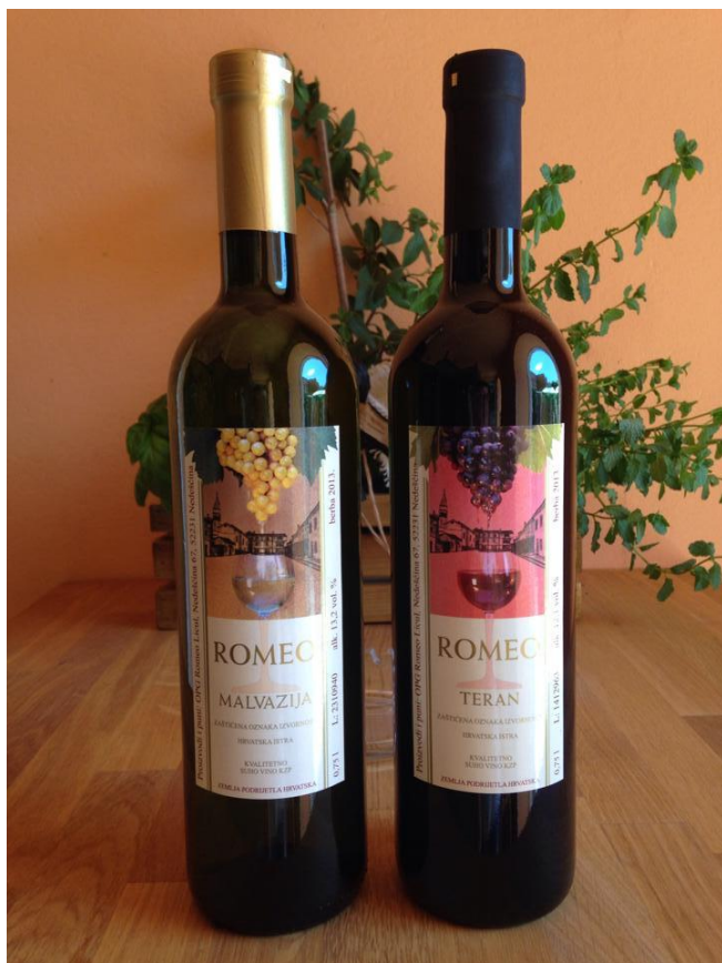
Slika 8: Vina Malvazija i Teran Romeo Licul