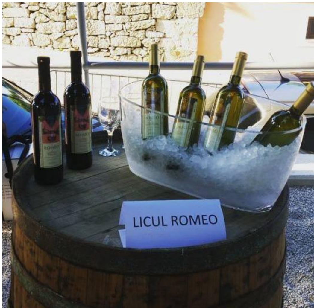
Slika 6: Vina u podrumu Licul