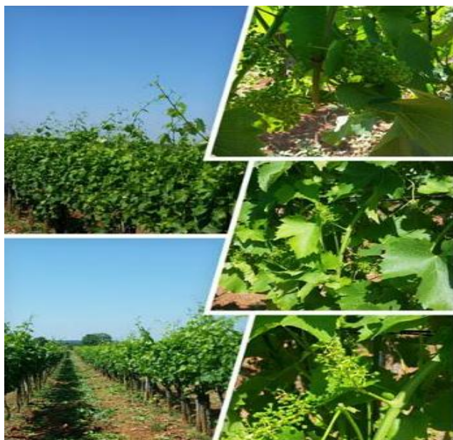
Slika 4: Vinova loza - bijelo grožđe za proizvodnju Malvazije

Kakvi će mi biti troškovi i slično. Za početak odluka je bila da se proizvodi samo Malvazija, na temelju vinograda u kojemu je imao samo zelene grožđice. Raspolagao je i crvenim, no ipak je prevagnula proizvodnja bijelog vina Malvazije. Ovo je vino koje uistinu definira lakoću postojanja u Istri. Ovdje gdje se skladno prožimaju alpska i mediteranska klima je dom sorte grožđa Malvasia Istriana, premda se nalazi i duž talijanske granice. Uzgajaju se mnoge vrste (ili klonovi) ove sorte, posebice na Mediteranu, no ovdje, na najsjevernijem jadranskom poluotoku, Malvazija je na svom vrhuncu: čista, bistra, svježa i mirisna. Naravno, za početak. U nastavku rada vidjeti će se da je veliku uspjeh proizvođač postigao i sa crnim (crvenim) vinom Teranom.