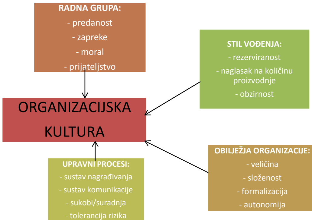
Slika 1. Čimbenici koji utječu na organizacijsku kulturu