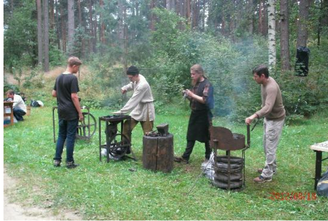
Slika 13. Prikaz kovača na sajmu tradicijskih obrta