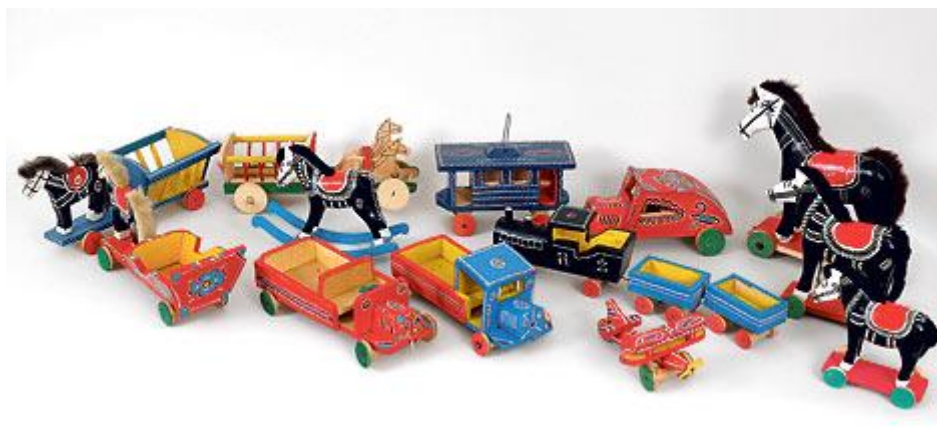
Slika 8. Prikaz modernih drvenih igračaka

prodaje prilagodili su se i gradskoj djeci, pa su u proizvodnju uveli motive poput automobila, kamiona, aviona, vlaka ili tramvaja (slika 8.). Sve do današnjih dana, ali s ponekim vrlo zanimljivim izmjenama, zadržala se izrada dječjeg namještaja: stolova, stolaca, ormara, kreveta i zipki u raznim veličinama, prilagođenima današnjim većim lutkama. Zagorske su igračke uvijek obojene živim bojama poput crvene, plave, žute, zelene ili crne (Biškupić Bašić, I., 2013., str. 25.).