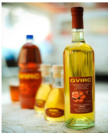
Slika 11. Prikaz gotovog proizvoda – gvirc

napitaka jesu med iz saća i voda. Piju se u ljetnim mjesecima, točena iz bačvi s ledom i tako rashlađena u vrućim ljetnim danima okrepljuju. Budući da se u gvirc dodaje i hmelj koji služi kao konzervans, on stvara pomalo gorak okus, dok je medica slađa (stoga je radije piju djeca). Kod medice se ne dopušta fermentacija, nije postojana, stoga je podložna kvarenju. Medičari su u blizini kuće iskopali jamu, “ledvenicu”, u kojoj su zimi stavljali led prekriven slamom. Jamu su prekrivali voštanim platnom, “ceradom” ili krovčićem od istesanih dasaka s otvorom na sredini, kroz koji je medičar silazio tijekom cijele godine po led.