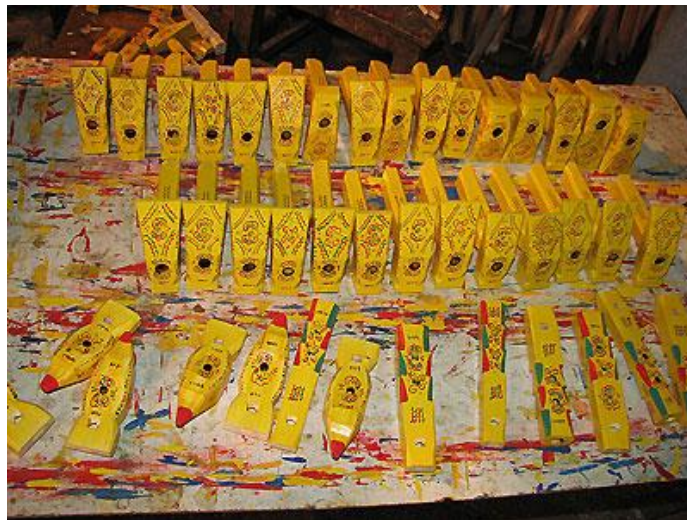
Slika 6. Svirala žveglice

Igračke izrađuju majstori drvorezbari, koji su u ovom umijeću samouki stanovnici zagorskih sela. Budući da je u 19. stoljeću na tom području bilo teško živjeti, sela su pronalazila način kako održavati svoju egzistenciju, te su se pronašli u ovoj djelatnosti koja im je i danas prilično bitan faktor u egzistenciji. Spretni samouki muškarci rezbarili su drvo te su izrađivali svirale pod nazivom žveglice (slika 6.). U početku su izrađivali jednostavnije jedinke ili dvojnice, te su ukrašavali paljenjem površine drva i time dobivali različite šare na instrumentima. Ova metoda paljenja površine drva se upotrebljava i danas te se pomoću željezne šipke zvane štruk, koja ima savijen kraj i pomoću drvenog držača stavlja šipka u vatru i usijanim dijelom se pali površina svirale.