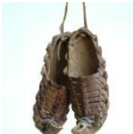
Slika 3. Opanci prepletaši