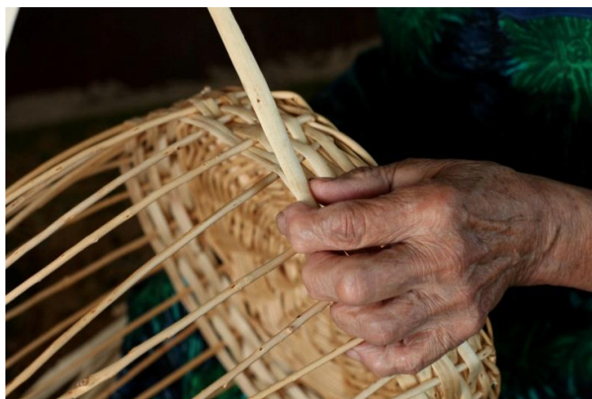
Slika 4. Prikaz tehnike izrade košara od šiblja

U Hrvatskoj se pletarstvo smatra i obrtom, ali i kućnim rukotvorstvom, te se ističu tri načina izrade pletenih predmeta. Prva tehnika se naziva spiralnom tehnikom slamnih strukova, što znači da se strukovi ražene slame ili šumske trave spiralno slažu i šiju kalanom ljeskovinom. Ovim postupkom dobivamo košarice za dizanje tijesta, ćupove ili cilindre za brašno, grah, žito ukoliko su veće veličine, dok one manje služe kao košarice za jaja. Druga tehnika (slika 4.) je pletenje košara od šiblja, te se u ovom postupku, kako navodi Mrgić u svojoj publikaciji „Pletarstvo i košaraštvo u Sisku i okolici“, na bazi od debelih šiba ili piljenih daščica isprepliću tanje vrbove šibe; rjeđe se upotrebljava kalana ljeskovina ili vinova loza, te su se na ovaj način izrađivale košare za nošenje tereta. Treća tehnika je služila za izrađivanje torbi, točnije rogožara, koje su nastajale prepletanjem rogoza kroz osnovu od konopljinih niti, koje su stajale napeto u drvenom okviru.