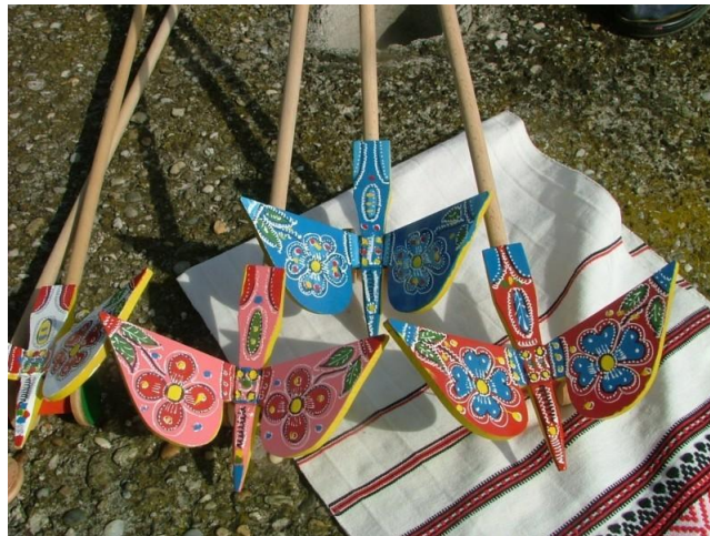
Slika 7. Klepetaljke

Kada se osjetila potreba za povećanjem ponude, počele su se izrađivati i igračke u obliku pijetla koje su se nazivale kokotički, ptica – ftički, ribe, čekića – kladivca, pištolja – repetirke, violončela – bajseka i trubice – trubentice, te su one također bi oslikavane veselim bojama, najčešće crvenom, te su nju nanosili razne šare. Zanimljiva je bila svirala duga i do pola metra, a imala je dvije funkcije – služila je kao pomagalo pri hodanju do svetišta, pa je nazivaju hodočasnički štap, ali je bila i batina sa sjekiricom, jer je na vrhu štapa bila svirala u koju se puše i koja postaje glazbeni instrument – igračka. Na povratku kući hodočasnici su je darovali djeci kao uspomenu na hodočašće (Maljković, Z., 2013., str. 240.).