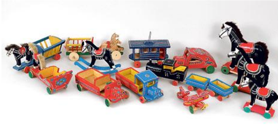
Slika 8. Prikaz modernih drvenih igračaka

prodaje prilagodili su se i gradskoj djeci, pa su u proizvodnju uveli motive poput automobila, kamiona, aviona, vlaka ili tramvaja (slika 8.). Sve do današnjih dana, ali s ponekim vrlo zanimljivim izmjenama, zadržala se izrada dječjeg namještaja: stolova, stolaca, ormara, kreveta i zipki u raznim veličinama, prilagođenima današnjim većim lutkama. Zagorske su igračke uvijek obojene živim bojama poput crvene, plave, žute, zelene ili crne (Biškupić Bašić, I., 2013., str. 25.).