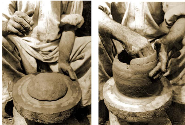
Slika1. Prikaz izrade lončanice na ručnom kolu

Ručni način izrade (slika 1.) je na kolu visokom od 20-30 cm, te se sastoji od okrugle ploče koja se vrti na drvenoj osovinu koja je učvršćena u podnožje. Ploča može biti kamena, može biti daska ili trupac. Lončar sjedi na niskom stoliću uz kolo i vrti ga rukom, te polagano gradi stjenku posude od glinenih valjušaka koji su postavljeni na dno koje je izrađeno od spljoštenog komada gline. Kako prilikom pečenja posude ne bi popucale u glinu se dodaje i dio mljevenog kamena, točnije kristalnog vapnenca. Nakon pečenja posude se kale posebnim postupkom, te na taj način postaju čvršće i nepropusne.