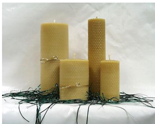
Slika 9. Medičarske voštane svijeće

Izvor: http://www.cef.hr/item/svjecarsko-medicarska-radionica