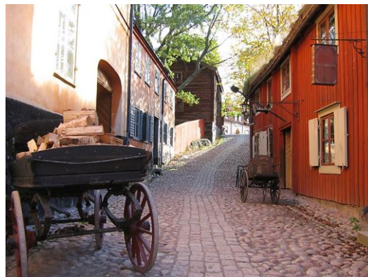
Slika 12. Prikaz uređenja i građevina na području muzeja

Otvoreni muzej Skansen nalazi se u Stockholmu, te djeluje od 1891. i prvi je muzej takvog tipa. Smješten je na otoku Djurgårdenu, koji se nalazi u centralnom dijelu Stockholma, gdje se nalazi veliki broj povijesnih zgrada i spomenika. Svrha samog muzeja je prezentirati industrijaliziranom društvu način življenja prije više stotina godina. Muzej čini oko 150 kuća i seoskih građevina (slika 12.). Svi muzejski predmeti pripadaju Nordskom muzeju, čiji je Skansen dio.