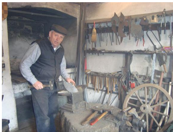
Slika 2. Prikaz kovačke radionice