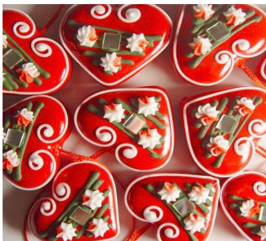
Slika 10. Tradicionalna licitarska srca

Pri samom spomenu riječi licitar / medičar bude se asocijacije na živopisna prodajna mjesta s naslaganim jestivim licitarskim srcima (slika 10.), bebama, konjanicima, kronicama, medenjacima i svijećama raznih oblika i veličina te staroslavenskim pićima. Posao je težak i zahtijeva znanje, spretnost i brzinu, iako danas većina medičara i svjećara slijedi tehnološki napredak i uvodi u svoje radionice nove strojeve kojima pokušavaju olakšati posao. Izradu su sinovi nasljeđivali od očeva, kasnije i kćeri ili udovice medičara. Svoje proizvode još uvijek izrađuju ručnom obradom te ukrašavaju sebi svojstvenim načinom, tako da je svaki licitar unikatni primjerak (Šarić, D., 2012., str. 119.). Danas u Hrvatskoj djeluje tridesetak medičara na području koje obuhvaća trinaest županija, te ih je u Hrvatskom zagorju. Naravno, područje Hrvatskog zagorja je najaktivnije zbog hodočasničkog mjesta Marije Bistrice, pa se upravo zbog tog posebnog događaja najviše obrtnika zadržalo na tom području, kako bi izrađivali licitare i druge proizvode od tijesta, ali i svoje napitke od meda i svijeće.