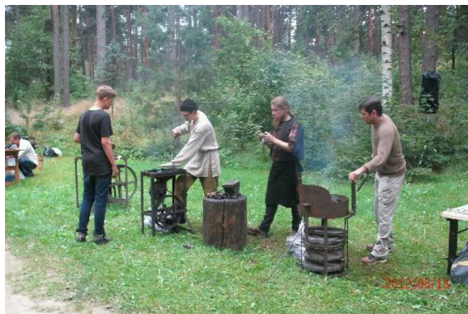
Slika 13. Prikaz kovača na sajmu tradicijskih obrta