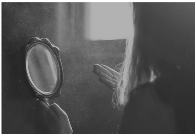
Slika 3: Refleksija unutarnjeg 21

Snaga misli je ključ za stvaranje vaše stvarnosti. Sve što vidimo u svijetu ima svoje porijeklo u nevidljivom, unutarnjem svijetu misli i uvjerenja. Svaki efekt koji možete vidjeti izvana ili u svijetu ima specifičan uzrok koji ima svoje porijeklo u unutarnjem ili mentalnom svijetu. To je suština misli moći. Okolnosti ne čine čovjeka, one ga otkrivaju. Svaki aspekt vašeg života točno i precizno otkriva vaše misli i uvjerenja. 20 Mnogi ljudi pogrešno misle da se osjećaju ili misle na određeni način zbog vanjskih okolnosti, ne znajući zapravo da je snaga njihovih misli ta koja stvara te okolnosti, kada napokon shvatite da misli kreiraju vašu stvarnost, sami ćete moći stvoriti promjene koju želite vidjeti u svom životu. Snaga vaših misli je neograničena, ona dolazi iznutra, a to su i potvrdili najveći mistici i učitelji koji su hodali Zemljom. Misli su prepune energije, one su žive. Svaki put kada se stvara misao, ona emitira vrlo specifičnu energiju koja odgovara određenoj frekvenciji ili vibraciji.