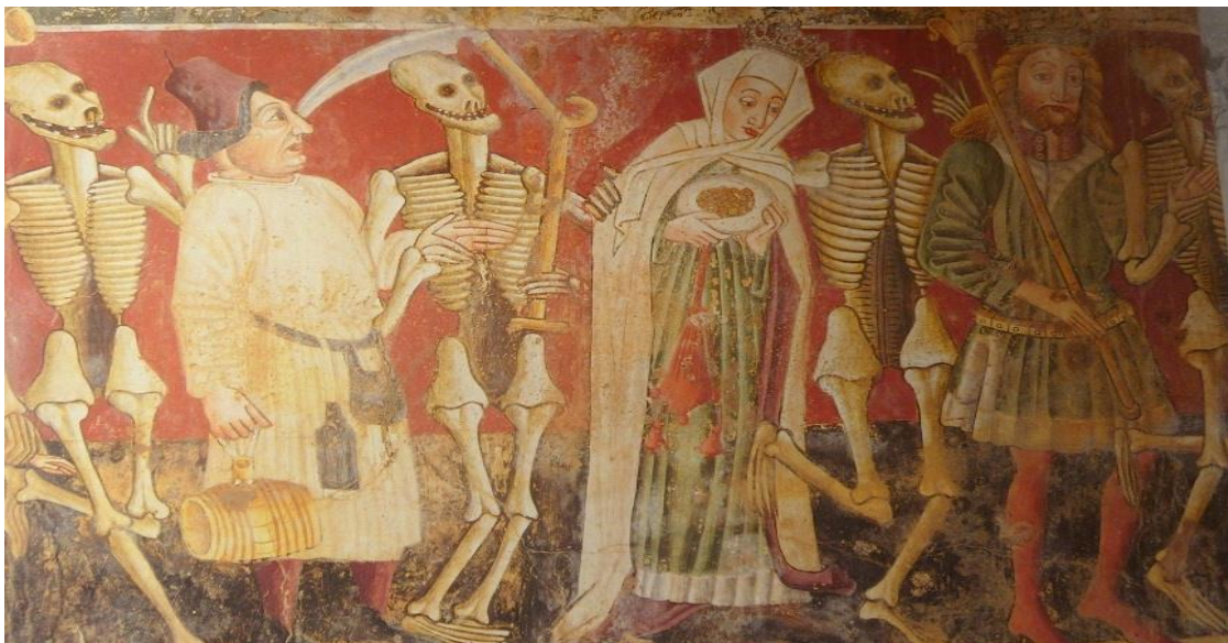
Slika 3. Freske na zapadnom zidu crkve sv. Marije na Škrilinah u Bermu