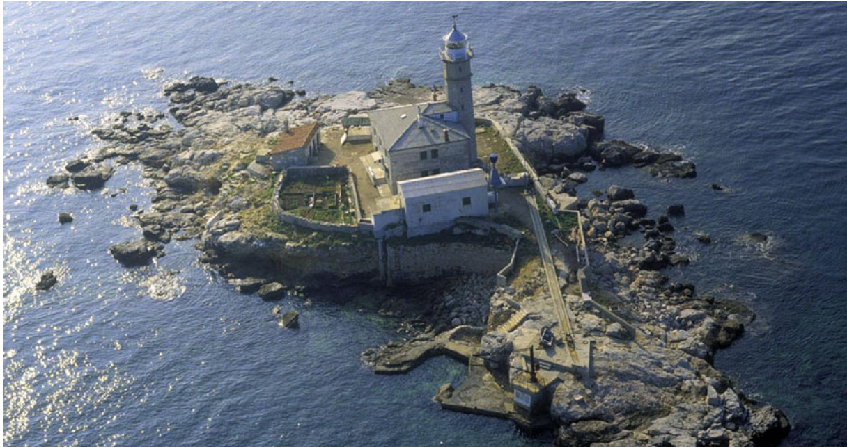
Slika 7: Sveti Ivan na Pučini