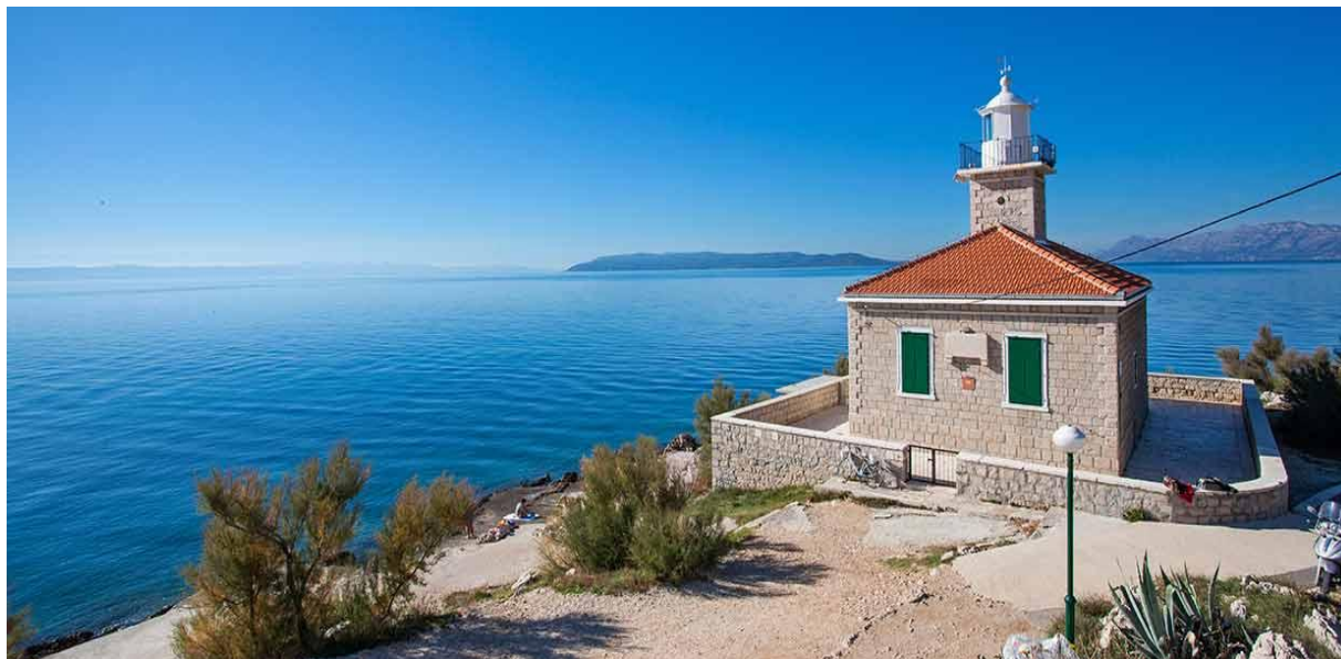
Slika 11: Svjetionik Sveti Petar