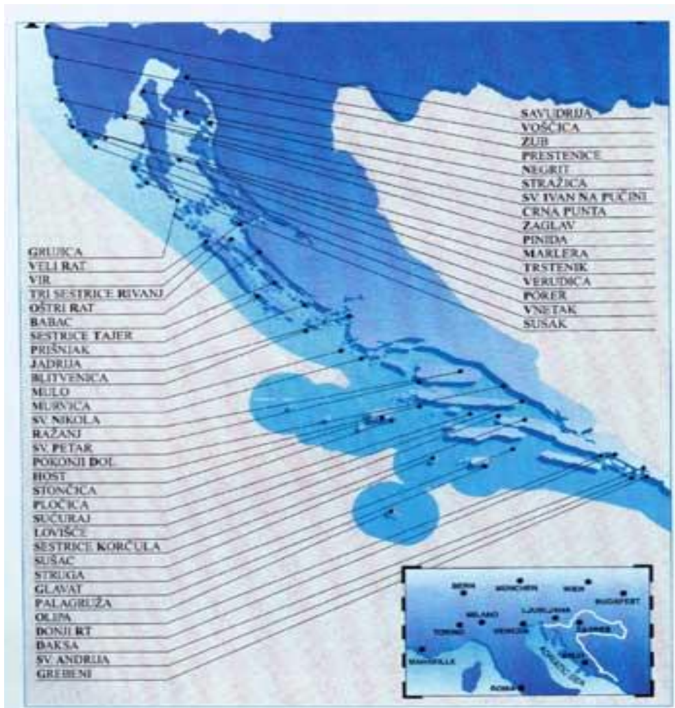
Slika 3: Karta hrvatskih svjetionika