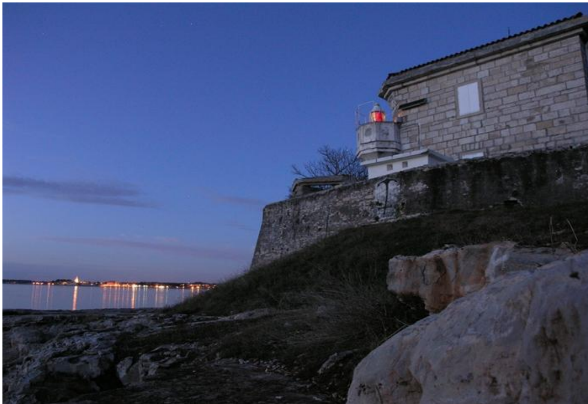
Slika 6: Svjetionik Rt Zub