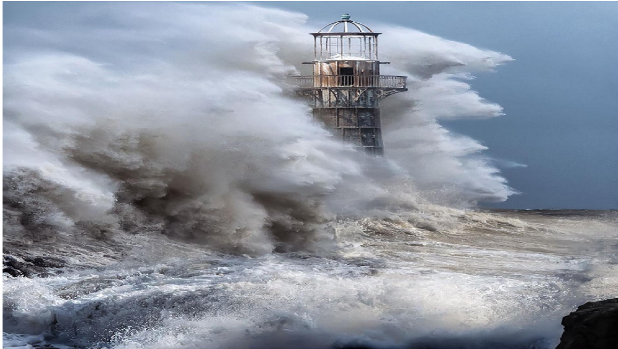
Slika 2: Svjetionik protiv vremena