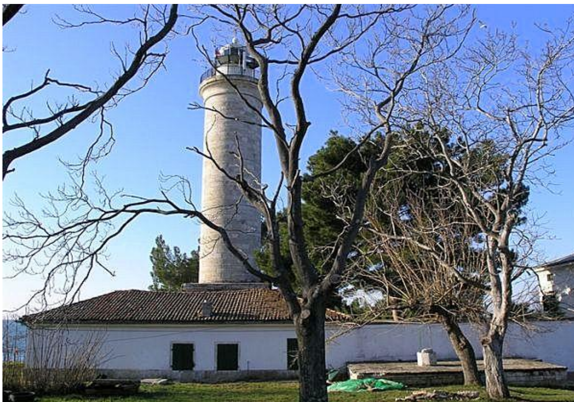
Slika 5: Svjetionik Savudrija