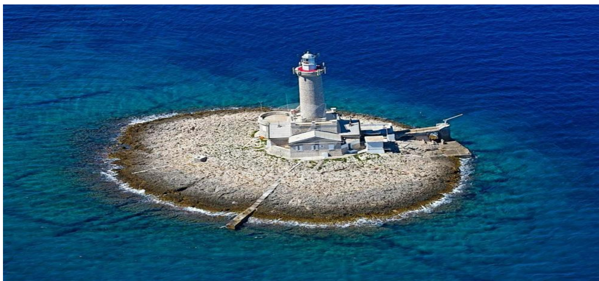
Slika 8: Porer