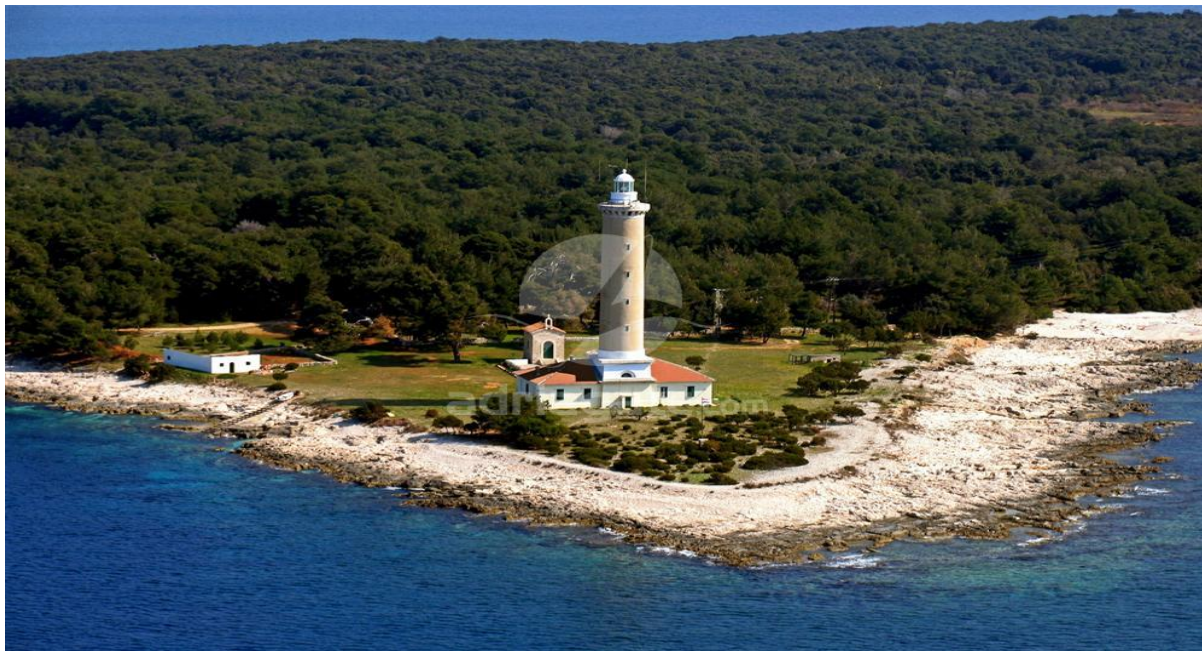
Slika 9: Svjetionik Veli Rat