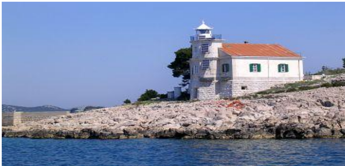
Slika 10: Svjetionik Prišnjak