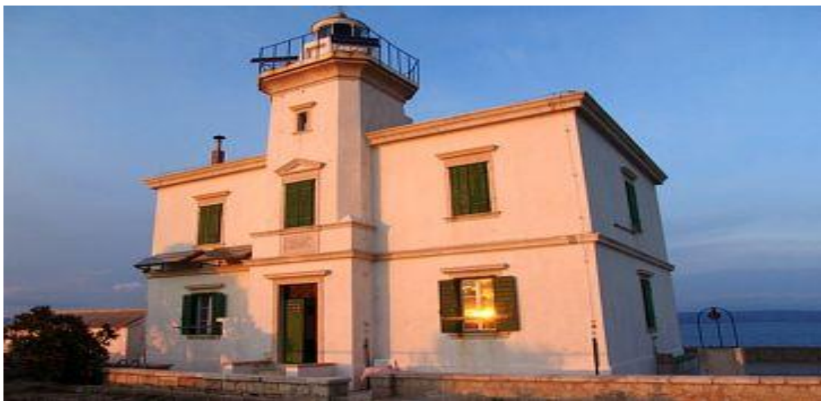
Slika 12: Svjetionik Pločica