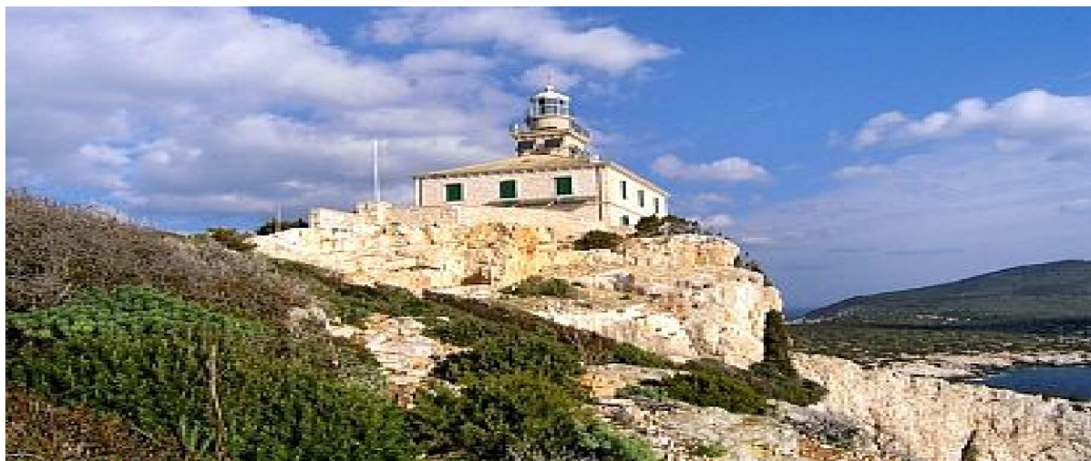
Slika 14: Svjetionik Sušac