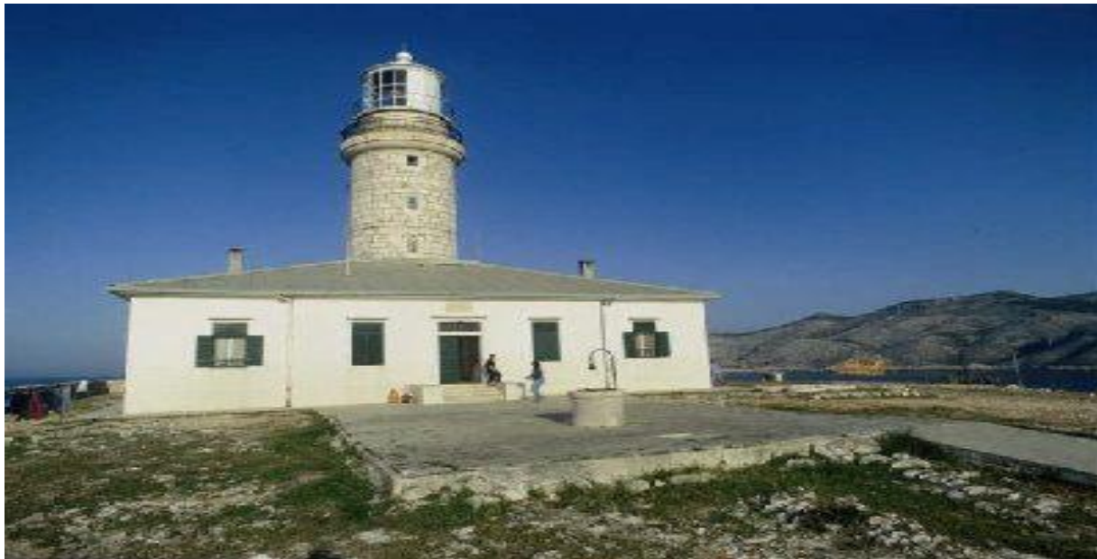
Slika 15: Svjetionik Struga