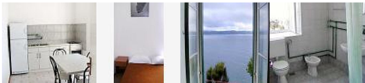
Slika 13: Unutrašnost svjetionika Pločica