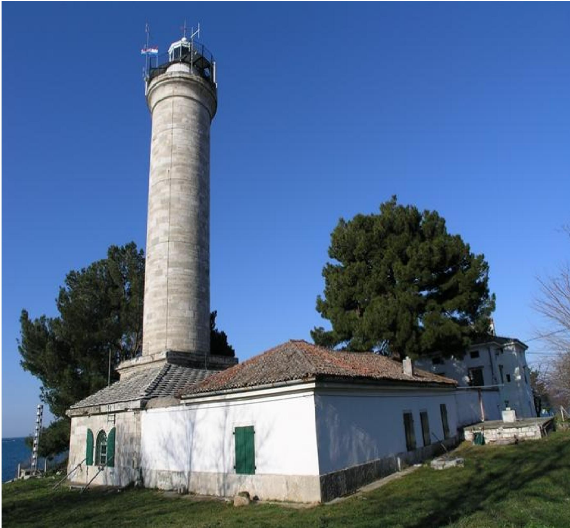
Slika 1: Svjetionik na rtu Savudriji