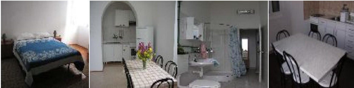
Slika 16: Unutrašnjost svjetionika Struga