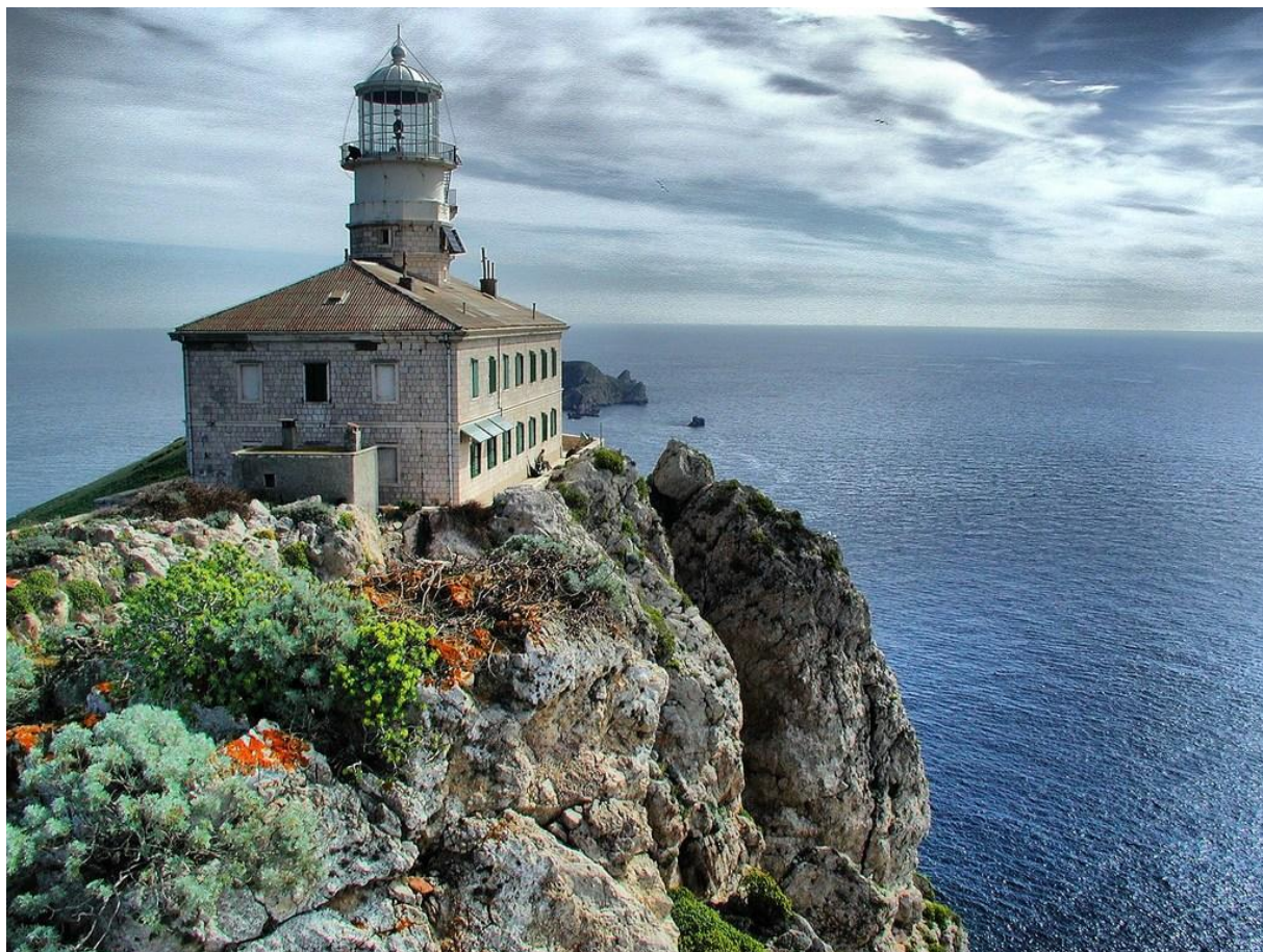
Slika 17: Svjetionik Palagruža