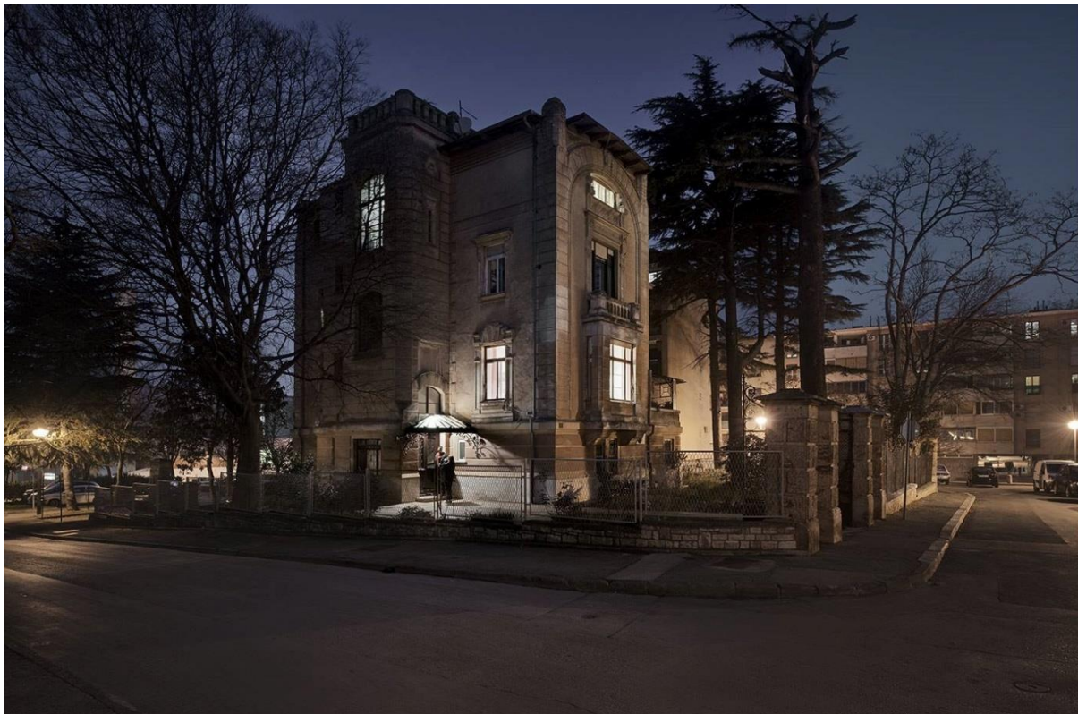
Slika 9: Vila Mendelein

Projektant ove vile, koja se također smatra jednom od atraktivnijih prema građevinskim pojedinostima, bio je već ranije spomenuti bečki arhitekt zaslužan i za arhitekturni nacrt Vile Münz, Johan Pokorny. Vila Mendelein izgrađena je 1903., a naziv dobiva prema investitorici Mariji Mendelein, čije je djevojačko ime bilo Wimmer (Perović, 2011).