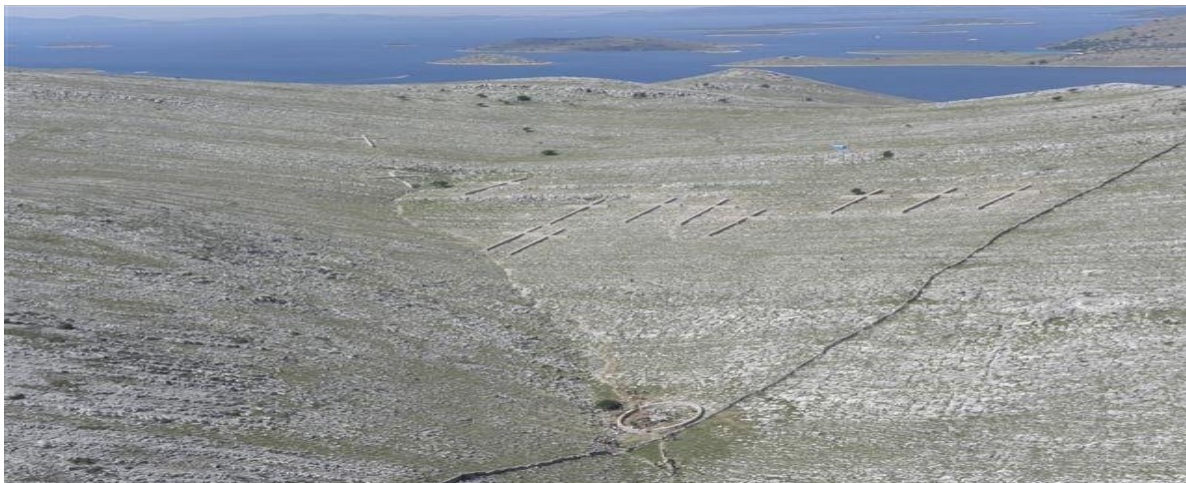
Slika 3. Kameni križevi na Kornatima