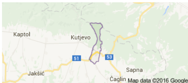
Slika 13: Mjesto Bektež