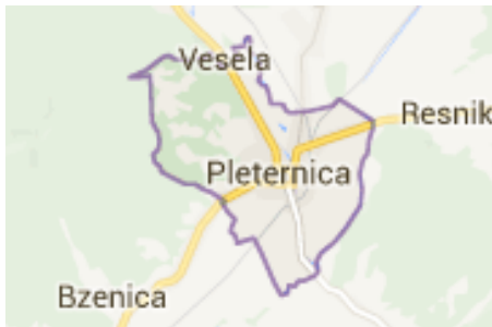
Slika 8: Grad Pleternica