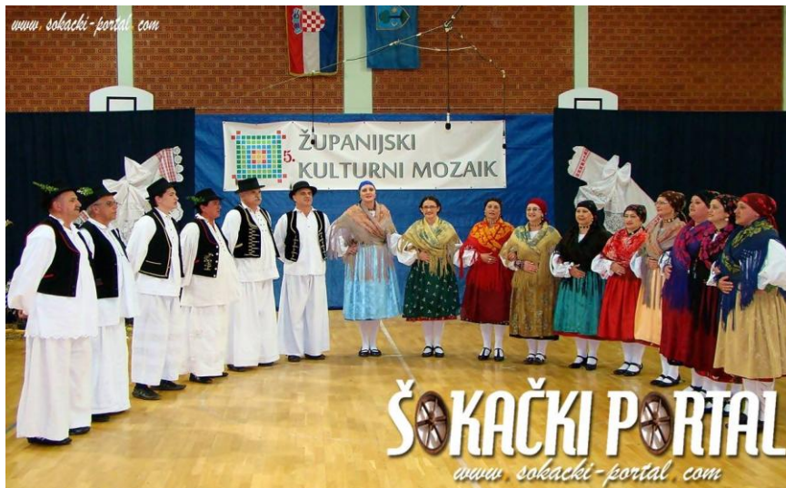
Slika 19: KUD „Požeška dolina“.