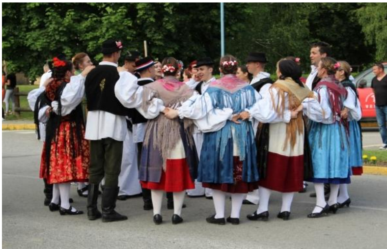
Slika 12: KUD „Ivan Goran Kovačić“ – Velika.

Rad i način rada ne bi nas uspoređivala s nijednim drugim KUD-om, svi mi imamo svoje prednosti i mane, i svi mi na svoj način prezentiramo našu baštinu i kulturu. Poznato je da su se neki plesovi plesali drugačije u susjednim selima, tako da je teško uspoređivati društva...ono što mogu reći je da smo mi složno društvo u kojemu ne postoje dobna neslaganja, gdje smo svi kao jedno, uvijek raspoloženi za dobru zabavu. Naše probe započinju i završavaju druženjem i opuštanjima, a svugdje smo prepoznati po našim zabavnim plesovima i dobrim tamburašima.