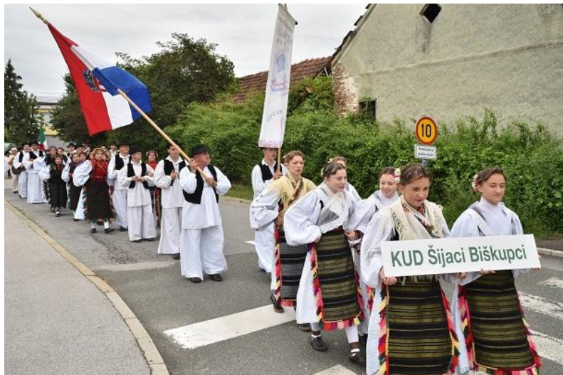
Slika 7: KUD „Šijaci“ – Biškupci