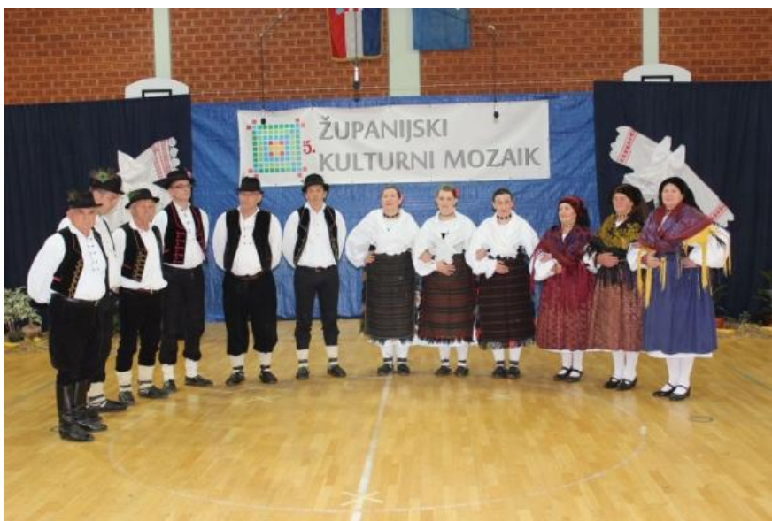
Slika 15: KUD „Bektež“ – Bektež.

KUD također izvodi i stilizacije (prikaze) običaja koje su spoj pjesme, glume i plesa. Tako u svom repertoaru ima iscrpan prikaz Badnjaka, uvjerljiv prikaz žetve i melankoličnu pjevačko-glumačku priču o raseljavanju pod nazivom Šokačka čežnja.