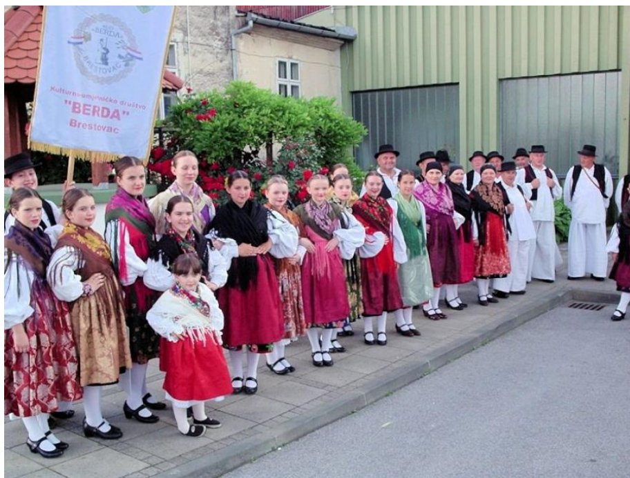
Slika 17: Kulturno umjetničko društvo „Berda“ – Brestovac