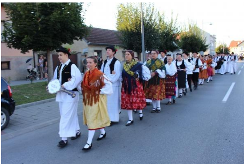
Slika 20: GKUD „Požega“ iz Požege

Gradsko kulturno umjetničko društvo „Požega“ iz Požege nastalo je 2005. godine te od njegovog nastanka redovno se sastoji od oko 80 aktivnih članova. Sastoji se od četiri sekcije: tamburaška, dječje plesna, odrasla plesna i pjevača sekcija.