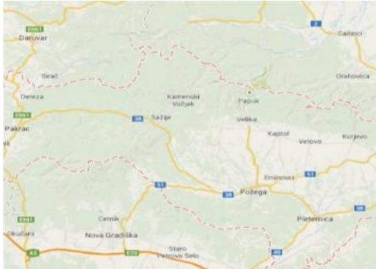
Slika 10: Općina Velika