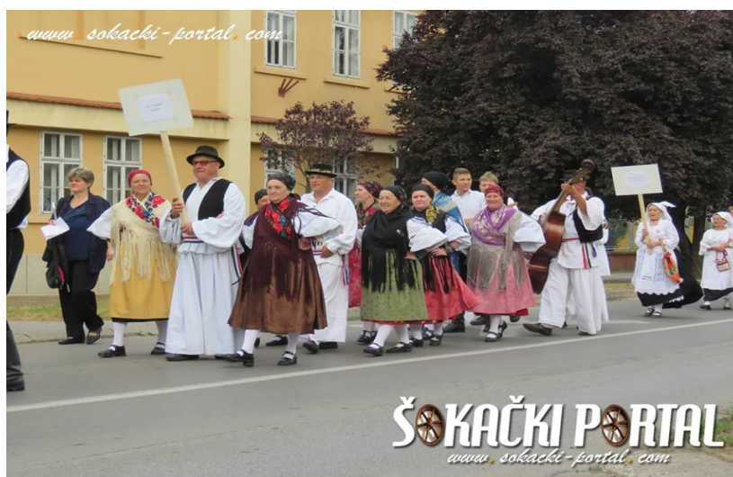
Slika: 5. KUD „Poljadija“ Grabarje