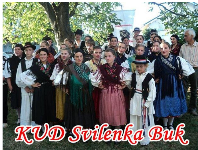
Slika 3: KUD „Svilenka“ - Buk