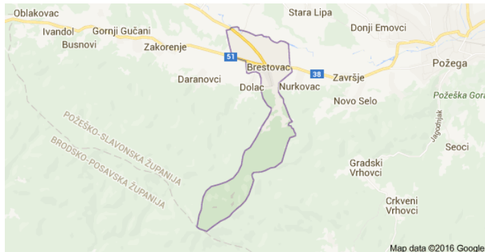
Slika 16: Općina Brestovac