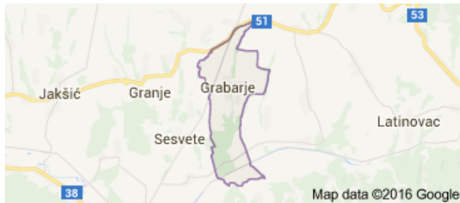
Slika: 4. Mjesto Grabarje