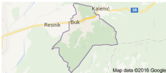
Slika 2: Mjesto Buk.

Buk (Buk, Svilna, Resnik), je naseljeno mjesto smješteno na cesti Pleternica-Đakovo, uz potok Skočinovac. Ime Buk prvi je put zapisano 1545. u turskom poreznom popisu. Nalazi se u sastavu grada Pleternice. U Buku žive 192 stanovnika (2011.). U selima se dugo održala ikavica, ali sa današnjim danima izumire. Prosjek starosjedilaca najpovoljniji je u Požeštini. U Buku svi stanovnici su rimokatolici. U Buku postoji četverogodišnja područna škola Osnovne škole fra Kaje Adžića iz Pleternice, a nedavno je dobila i podnaziv podružna škola Tomo Perić. Škola je osnovana 1858. godine.