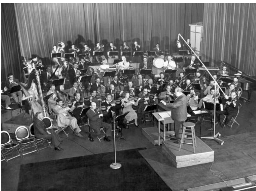
Fotografija br. 4. Sigmund Romberg u ulozi dirigenta 16

nd+romberg&oq=sigmund+romberg&gs_l=psy-ab.3..0i19k1.1913.5276.0.5389.17.16.1.0.0.0.245.1760.0j11j1.12.0...0...1.1.64.psy-ab..4.13.1766...0j0i67k1j0i30k1j0i30i19k1j0i8i30i19k1.V2DeClw3peU#imgrc=Jv0vzXaGBHt6zM : (15.9.2017)