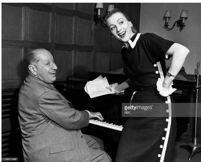
Fotografija br. 2. suradnja sa pjevačicom Anne Jeffreys 14