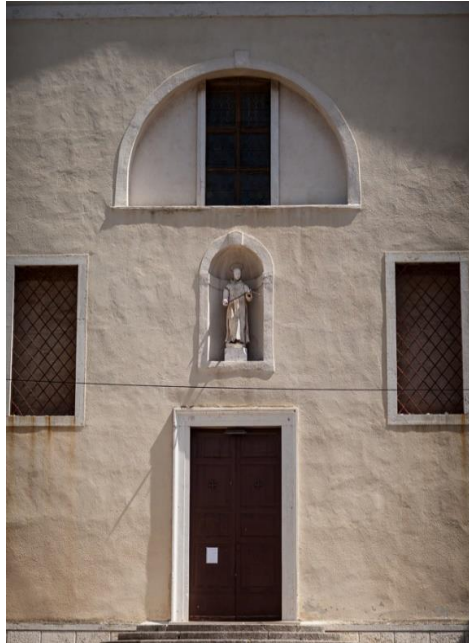
Slika 12. Franjevački samostan i crkva sv. Franje Asiškog