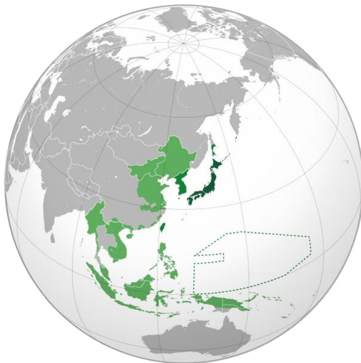
Slika 3. Japansko carstvo u 19. stoljeću

Japan je imitirao Europu, a upravo je europeizacija Japana bila uzrok njegovog miješanja u sukobe velikih sila. 85 Svoju ekspanziju započeo je osvajanjem susjednih otočnih skupina, Kurilea i Ryu Kyua. Strahovanje da je Kina preslaba da drži Rusiju izvan Koreje dovelo je 1894. do rata u kojem je Japan uništio kineske snage i prisvojio Tajvan i Mandžuriju, područje bogato drvom, željezom, naftom, zlatom i uranom. 86