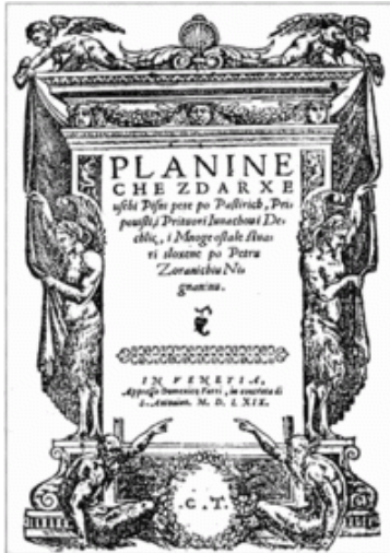
Slika 3: Planine , P. Zoranić, Venecija, 1569.

Prema autorovu svjedočanstvu Planine su napisane 20. rujna 1536. godine u gradu Ninu, a tiskane su u Veneciji 1569. godine. U djelu se isprepleće poezija i proza. Sadržava 24 kapitula ili glave i posvetu ninskom kanoniku Mateju Matijeviću. Roman je napisan čakavskim narječjem i ima ikavski refleks jata.