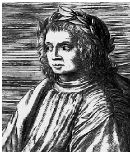
Slika 1: Jacopo Sannazaro