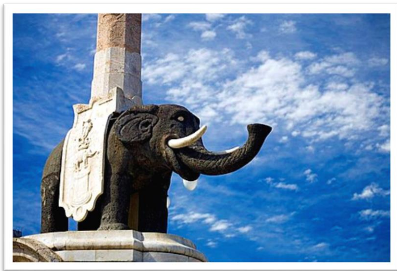
Slika 6. Slonova fontana