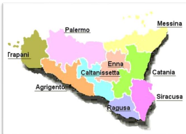
Slika 1. Pokrajine Sicilije