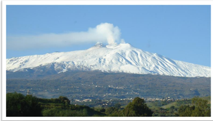
Slika 2. Vulkan Etna