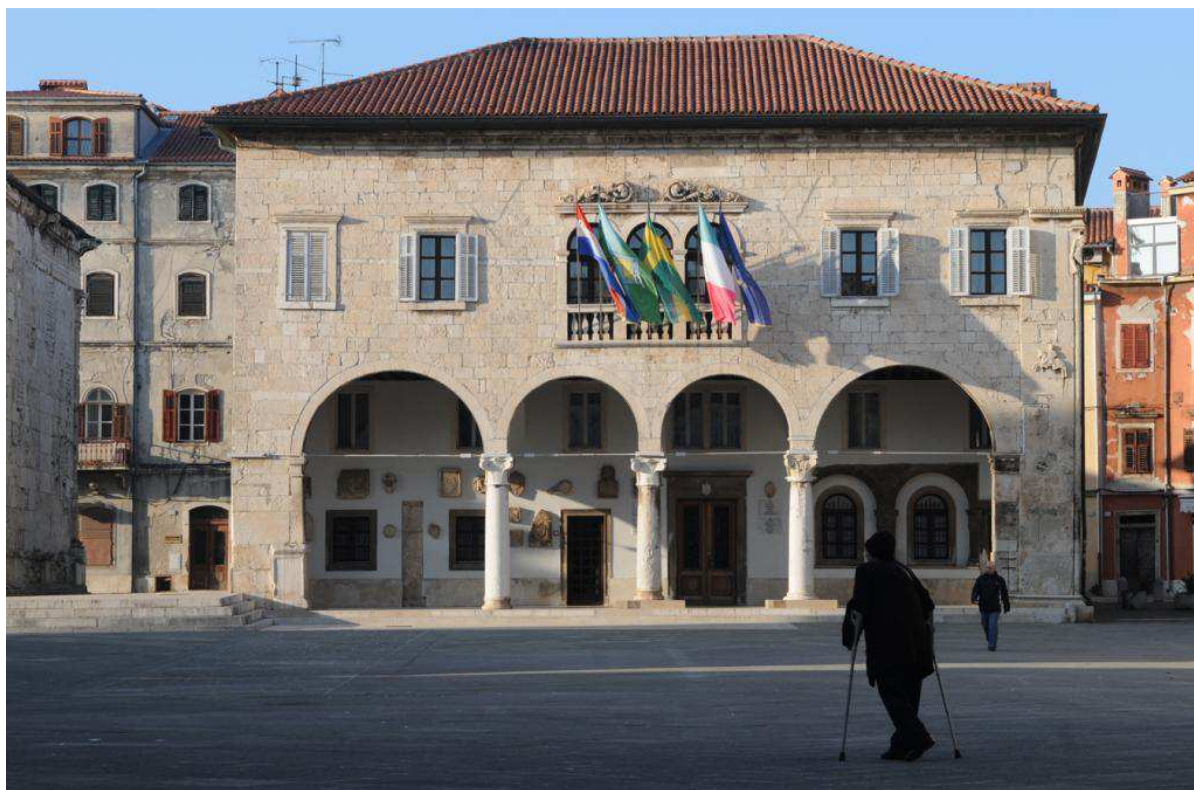
Slika 7. Komunalna palača