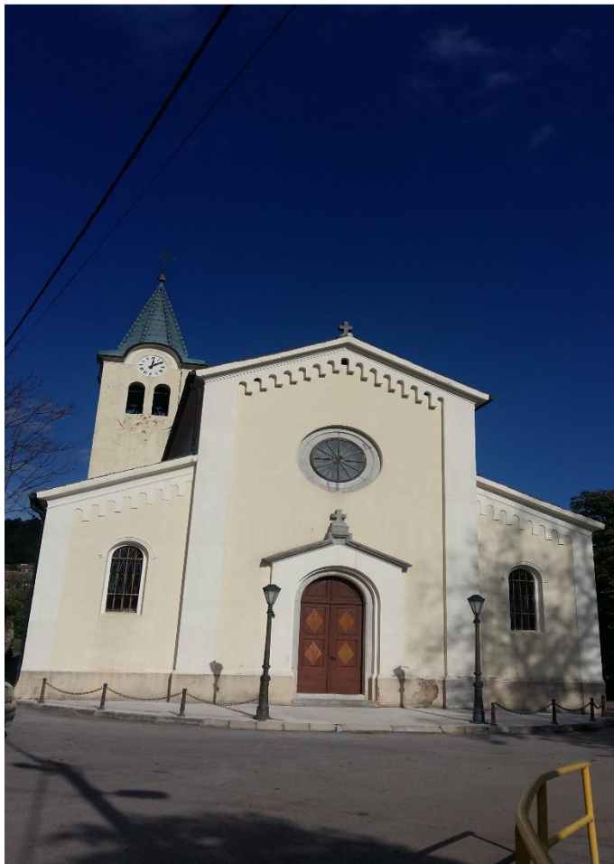
Foto IV. La chiesa di San Pietro