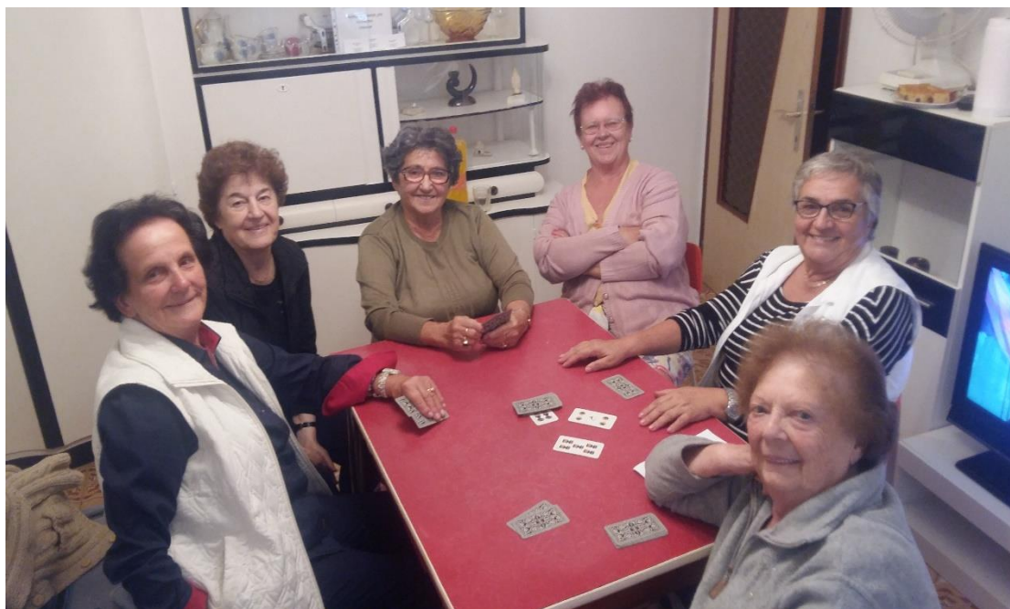
Foto I. La briscola