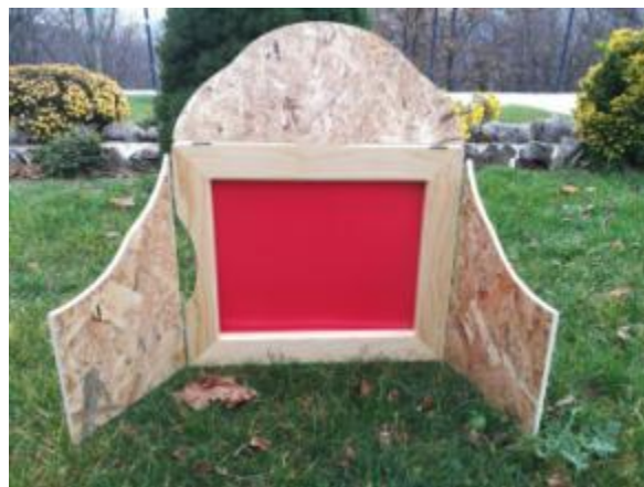
Slika 10. Vrata Kamishibai pozornice