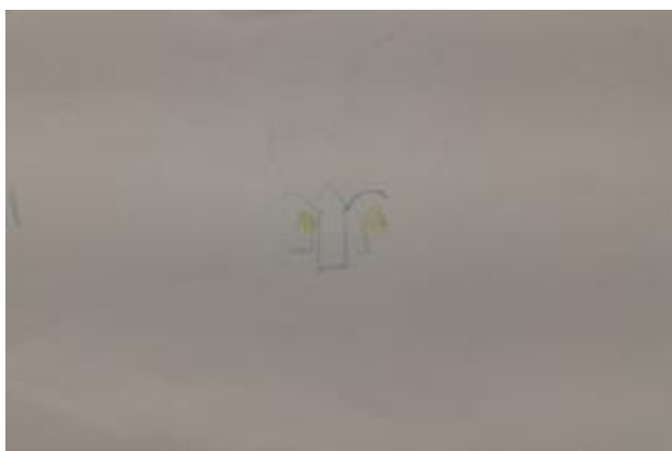
Slika 44. Matias, 4,5 godina: „ Čizme su se sakrile ispod gljive. “