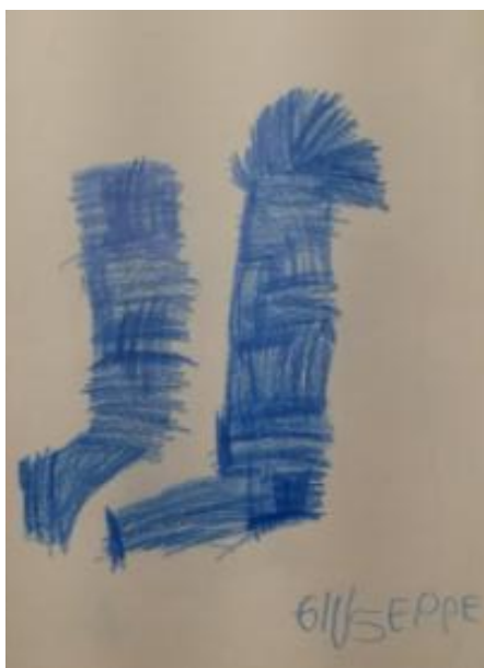
Slika 43. Giuseppe 5, 5 godina: „ Čizmice ne lutaju, one spavaju. “