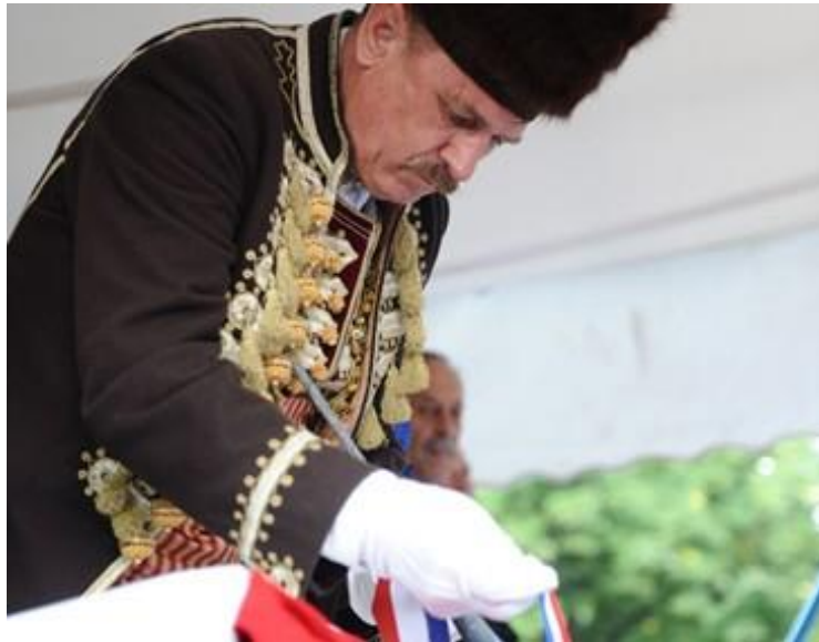
Slika 9. Proglašenje slavodobitnika

preko glavnog trga, prate najprije vojvodu do alkarskih dvora, zatim slavodobitnika i alajčauša, a potom se razilaze. 37