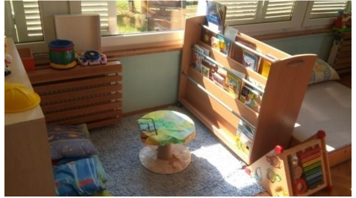
Slika 9 - Knjižnica