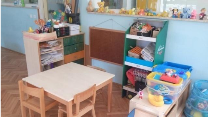
Slika 8 - Likovni kutić (centar)