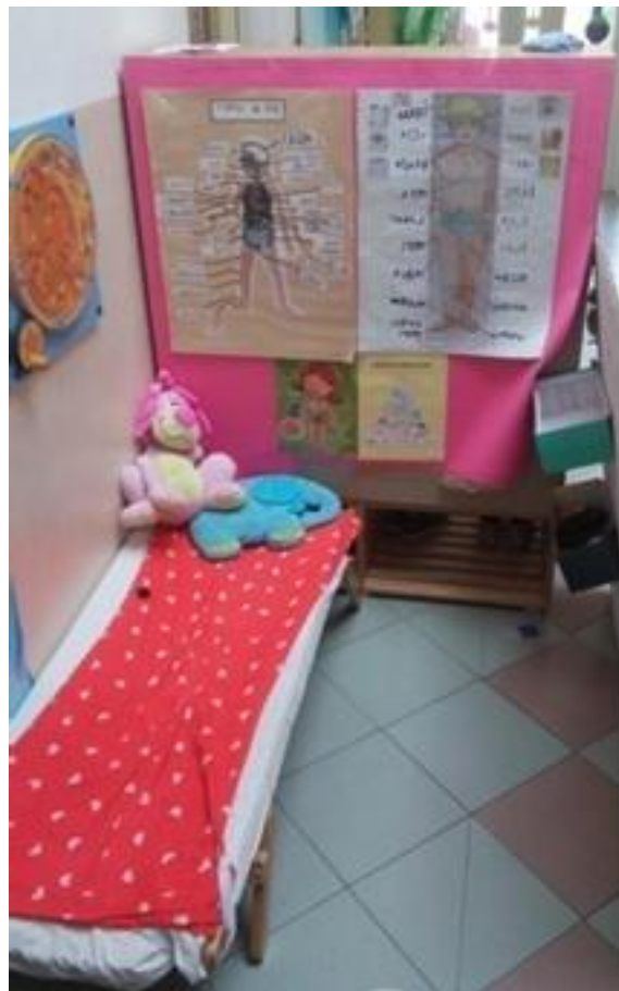
Slika 6 - Kutić (centar) liječnika