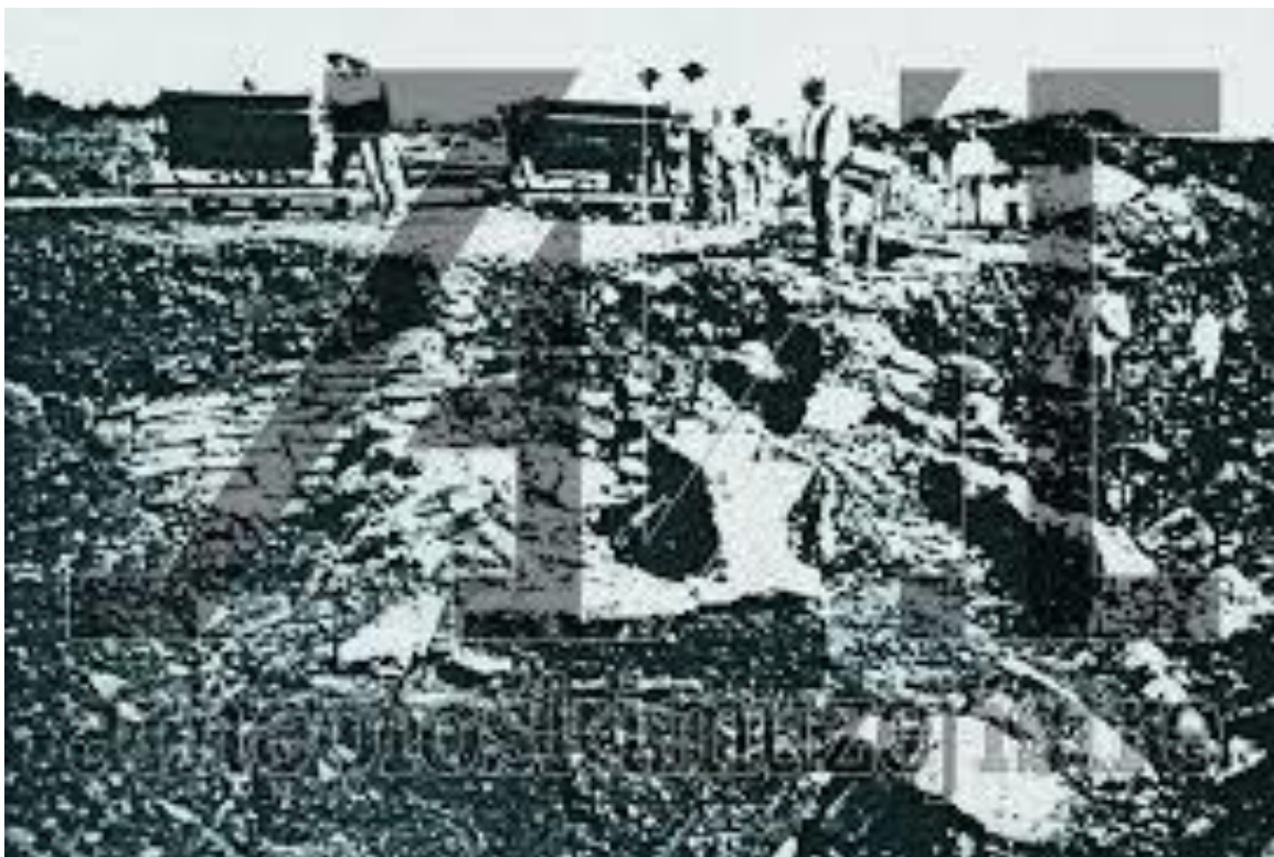
Slika 6. Arheološka istraživanja Nezakcija

Arheološka istraživanja Nezakcija započela su 1900. (Slika 6), u organizaciji Società Istriana di Archeologia e Storia Patria iz Poreča, u čijem sastavu su bili Bernardo Schiavuzzi, Pietro Sticotti i Alberto Puschi. Bila su to najveća arheološka istraživanja Nezakcija. Koliko su nalazi bili bogati u prilog tome govori i činjenica da predstavljaju osnovu Arheološkog muzeja Istre u Puli koji je utemeljen 1902.