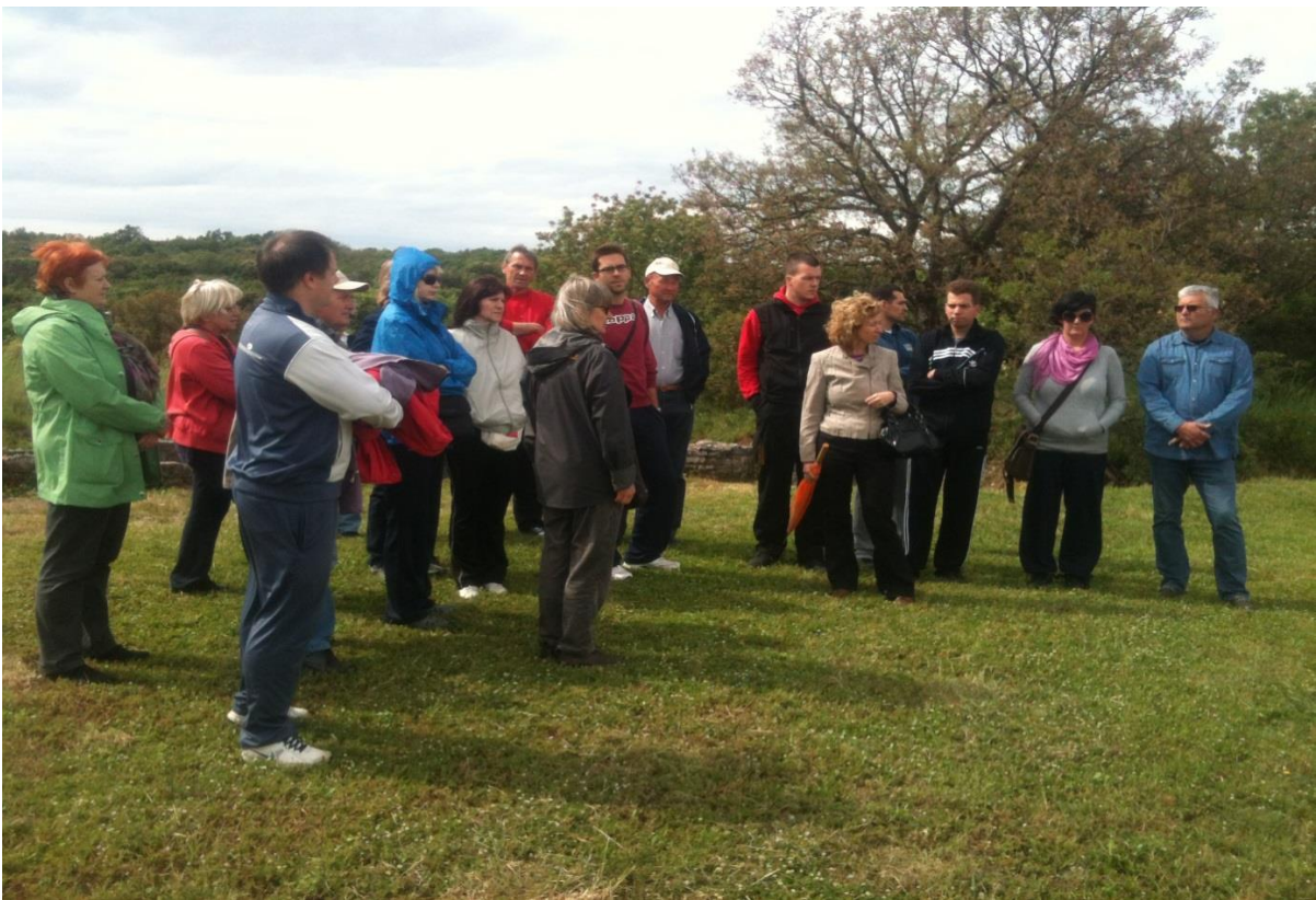
Slika 2. Razgledavanje Nezakcija

doživljaj turista i omogućuju stvaranje potpunije slike o određenoj zemlji, regiji ili mjestu.“ 7 Sukladno tome, turistička zajednica Općine Ližnjan osmislila je zanimljiv proizvod koji je prije svega namijenjen lokalnom stanovništvu i subjektima u turizmu. Proizvod pod nazivom „Ližnjanski vremeplov“ nastao je u suradnji s jedinicom lokalne samouprave i s Arheološkim muzejom Istre s ciljem educiranja putem relevantnih izvora i s mogućnošću kreiranja dodatne ponude i razvoja proizvoda. U sklopu „Vremeplova“ posjetili su se lokaliteti na području Općine Ližnjan, uz stručno vodstvo zaposlenih voditelja odsjeka u muzeju koji su na zanimljiv način predstavili posjećene lokalitete (Slika 2).