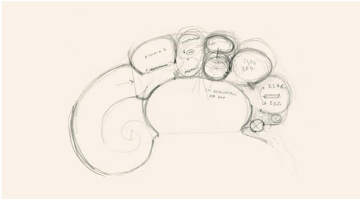
Slika 10. Prve skice muzeja Krapinskog neandertalca 1998.