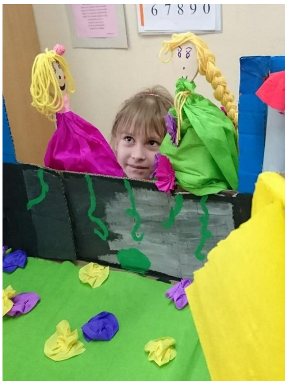
Fotografija 11. Dvije djevojčice vode dijalog uz pomoć cvjetnih lutaka