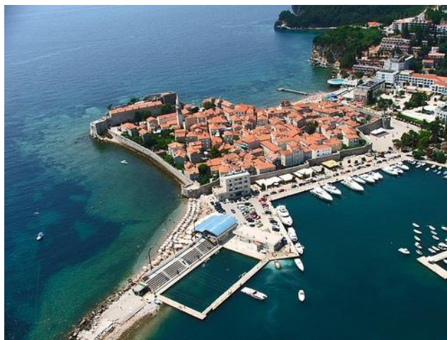
Slika 11. Najstariji dio Budve

Budva se razvila na mjestu prirodno zaštićenom od hladnih sjevernih vjetrova pa je privlačna za naseljavanje bila još od ilirskog doba. Danas u njoj živi nešto više od 13 000 stanovnika. Najstariji dio grada nalazi se na malom poluotoku nastalom kada je nekadašnji otok pješčanim sprudom povezan s kopnom (sl. 11.). 54