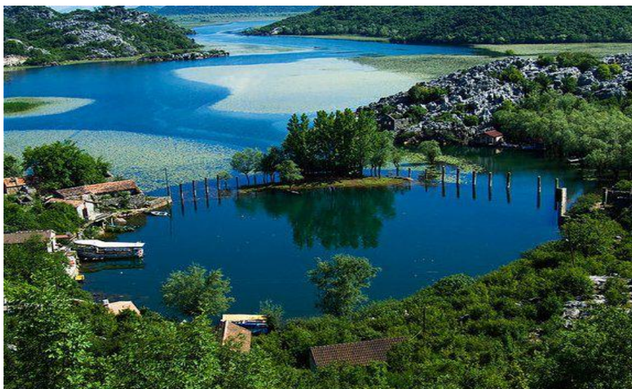
Slika 3. Skadarsko jezero

Skadarsko jezero (sl. 3.) najveće je na Balkanu, površinski podijeljeno na dio Crne Gore od 222 km 2 te dio od 148 km 2 koji pripada Albaniji. 20 Najveća dubina mu iznosi 44 metara, a vodu prima iz više rijeka i rječica, kao i iz podzemnih vodotoka.