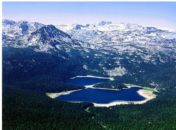
Slika 4. Crno jezero

Crno jezero jedno je od devetnaest jezera koje se nalaze na području planinskog masiva Durmitora (sl. 4.). Nalazi se na 1 442 m/nv, tamnozelene, gotovo crne boje zbog dubine razlog je zbog kojeg je dobilo postojeće ime.