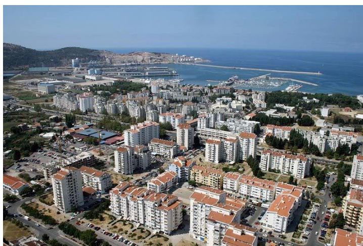
Slika 12. Bar