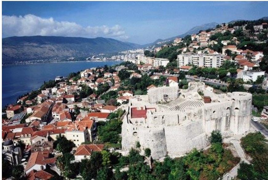
Slika 8. Pogled na Herceg Novi s Kanli kulom

mediteranskoj arhitekturi s uskim i krivudavim ulicama i niskim kućama izgrađenim pretežno od kamena, a o burnoj prošlosti svjedoče i brojni kulturno-povijesni spomenici iz razdoblja turske i mletačke vladavine poput Gornjeg grada, Citadele te Kanli kule (sl. 8.). Osim po svojim plažama, šetalištu pored mora, luci i centru za sportove na vodi, Herceg Novi je poznat i po, već spomenutoj, međunarodnoj cvjetnoj manifestaciji "Praznik mimoze".