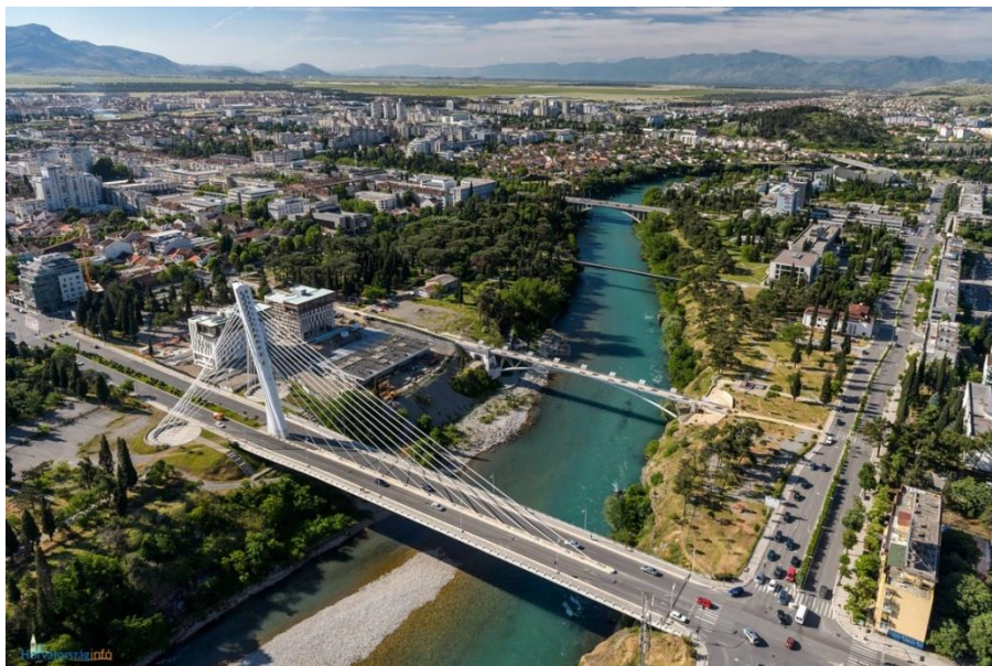
Slika 5. Podgorica

Podgorica (sl. 5.) je glavni grad Crne Gore, administrativni, kulturni, zdravstveni i ekonomski centar. Smještena je u dolini okruženoj sa pet rijeka (Morača, Zeta, Ribnica, Cijevna, Sitnica) i tri jezera (Skadarsko, Bukumursko, Rikavačko) te tako na neki način odolijeva urbanizaciji. 34 Pozicionirana je na iznimno povoljnoj lokaciji, blizu europskih centara, te je oduvijek bila važno prometno čvorište, čime u današnje vrijeme pridonose i obližnji aerodromi. Osim toga, atraktivnosti Podgorice doprinose i mediteranska klima, udaljenost od 60 km od Jadranskog mora, veliki broj sunčanih dana u godini i relativno mala količina padalina. 35