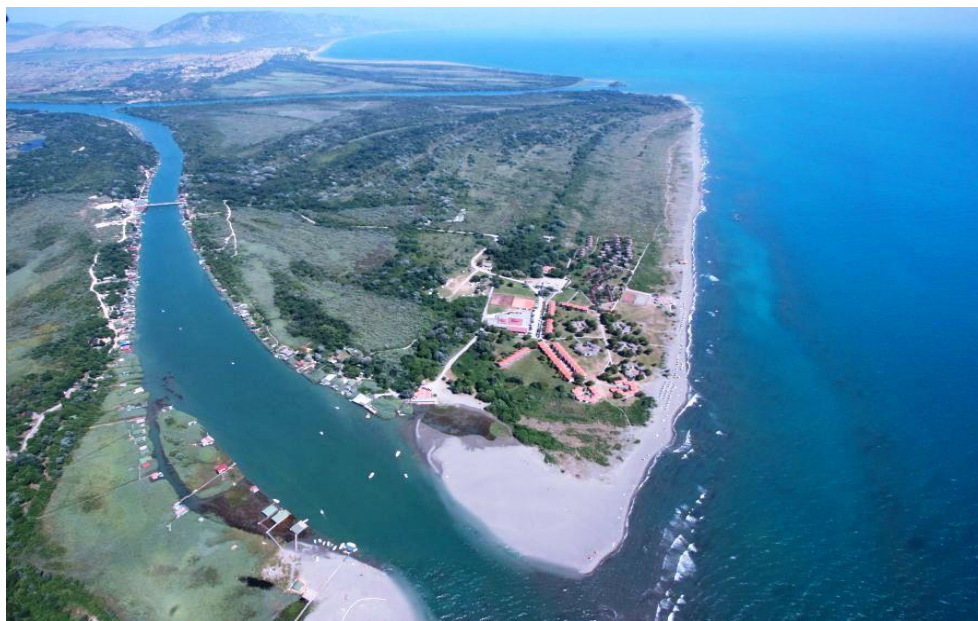
Slika 13. Ada Bojana

Osim Ulcinja, u sklopu primorja valja još spomenuti i turističko naselje u zaljevu Valdanos koje pripada vojsci, ali je otvoreno i za posjetitelje, te plažu Ada Bojana. Ada Bojana posljednja je plaža i turističko naselje crnogorskog primorja. Rijeka Bojana koja otječe iz Skadarskog jezera i ulijeva se u Jadransko more ovdje se grana u dva dijela gradeći tako riječni otok (adu) uz granicu Crne Gore i Albanije. Ada se, osim po 2,6 km dugoj i 50 m širokoj pješčanoj plaži, ističe i po tome što se na njoj nalazi nudističko naselje (sl. 13.). 62