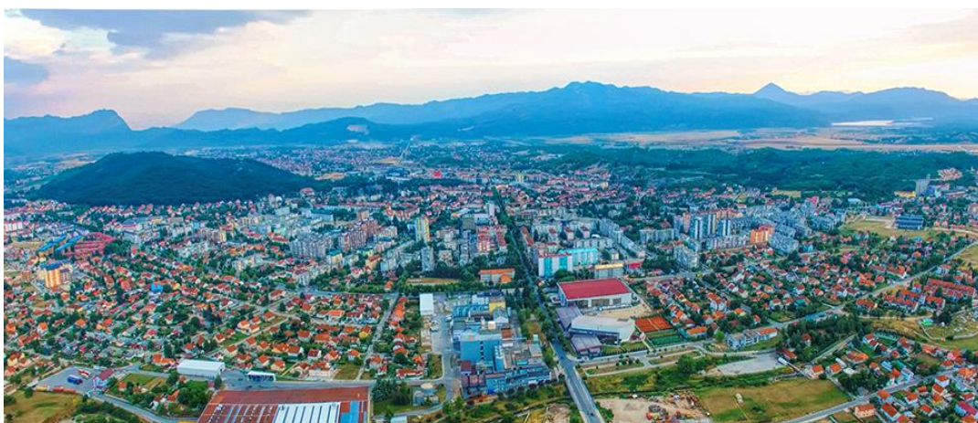
Slika 7. Nikšić

Nikšić (sl. 7.) je drugi po veličini grad Crne Gore povoljnog položaja na raskrižju prometnih puteva između sjevera i juga države, između Crne Gore i Bosne te Hrvatske i Srbije, a od Jadranskog mora udaljen je tek 40-ak kilometara. 41