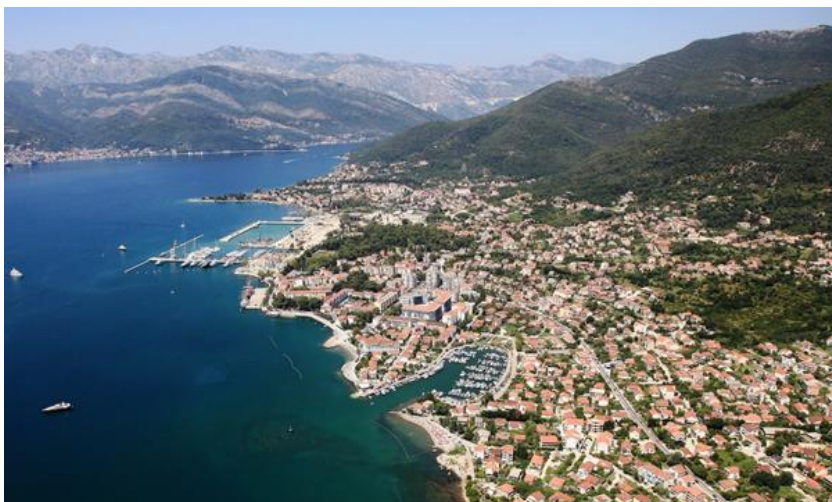
Slika 10. Tivat

Tivat (sl. 10.) je gradić s dugom urbanom tradicijom, a danas broji oko 9 000 stanovnika. Gradom dominiraju novi stambeni dijelovi, šetalište pored mora, hoteli i restorani. Tivatski park najveći je na prostoru Bokokotarskog zaljeva, a bogat je raznovrsnim tropskim i suptropskim raslinjem. Zamah razvoju turizma na Tivatskom primorju svakako je dala jedina međunarodna zračna luka na crnogorskom primorju.