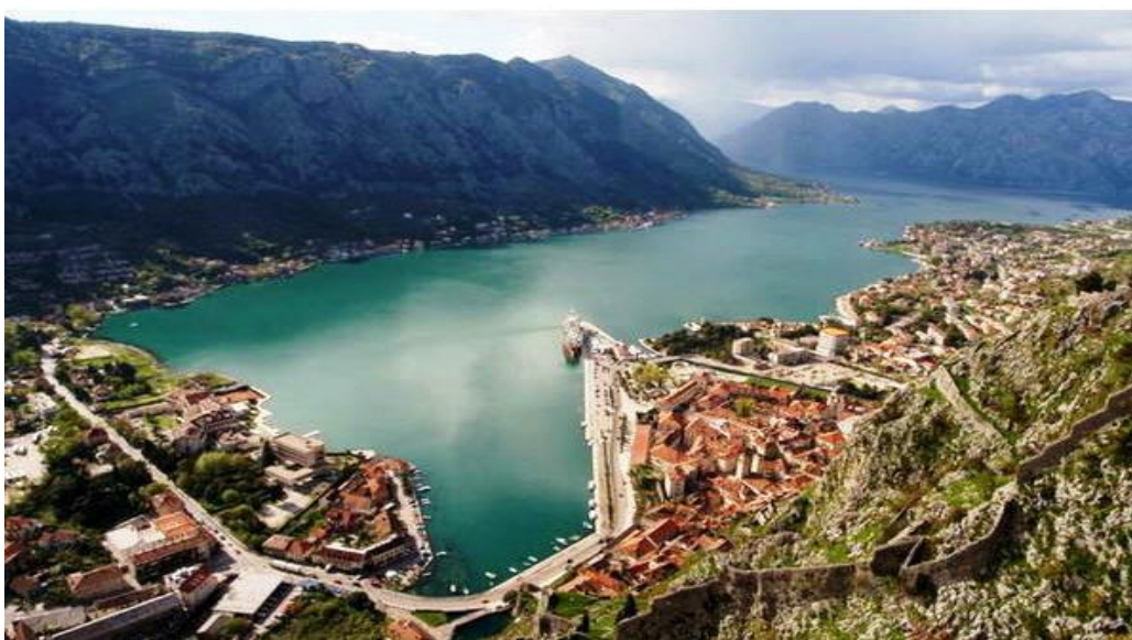
Slika 9. Pogled na Kotor i Kotorski zaljev

Kotorsko primorje nastavlja se na Hercegovsku od tjesnaca Verige pa sve do njegove druge strane, a obuhvaća i otvoreno more od uvale Bigovo do plaže Jaz blizu Budve, no bez većeg turističkog značenja. 48 Kotor se razvio na samom vrhu Kotorskog zaljeva još u rimsko doba kao važna luka (sl. 9.), no danas samo naselje ima manje od 1 000 stanovnika.