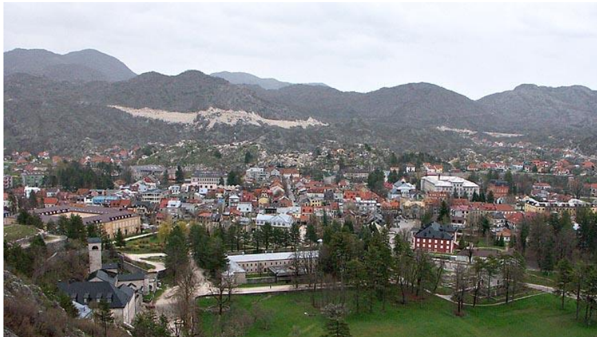
Slika 6. Cetinje

uz očuvanje starog naslijeđa i ostataka koja su i dan danas predmet istraživanja neupitne valorizacijske vrijednosti.