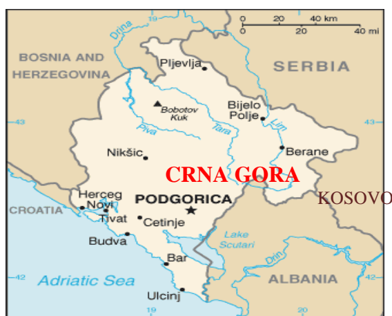
Slika 1. Geografski položaj Crne Gore

Crna Gora je država jugoistočne Europe, mediteranska država Balkanskog poluotoka (sl. 1). Prostire se površinom od 13\,812\text{ km}^2 , a ukupna duljina granice iznosi 614\text{ km} . Graniči sa Hrvatskom na zapadu ( 14\text{ km} ), Bosnom i Hercegovinom na sjeveru ( 225\text{ km} ), Srbijom na istoku ( 124\text{ km} ) i Kosovom ( 78,6\text{ km} ) te Albanijom na jugu ( 172\text{ km} ). Osim toga, ima izlaz na Jadransko more te time morskim putem graniči i sa Italijom. Površina teritorijalnog mora iznosi 2\,099\text{ km}^2 , dok je duljina obale 293,5\text{ km} . 2