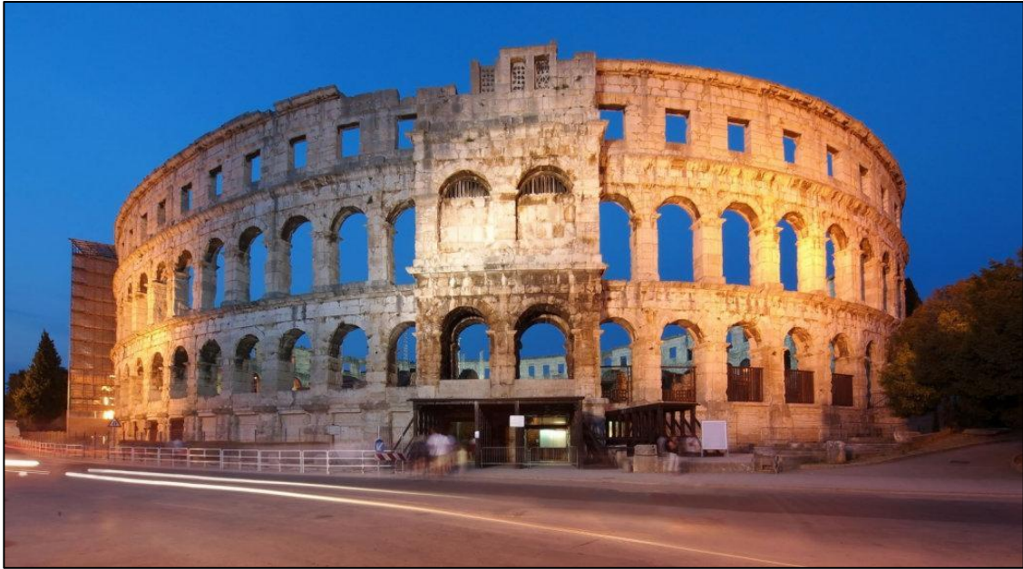
Slika 1: Arena u Puli