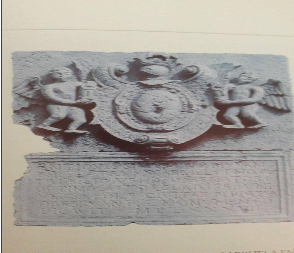
Slika 2: Spomen-ploča s grbom mletačkog senatora Gabrijela Ema