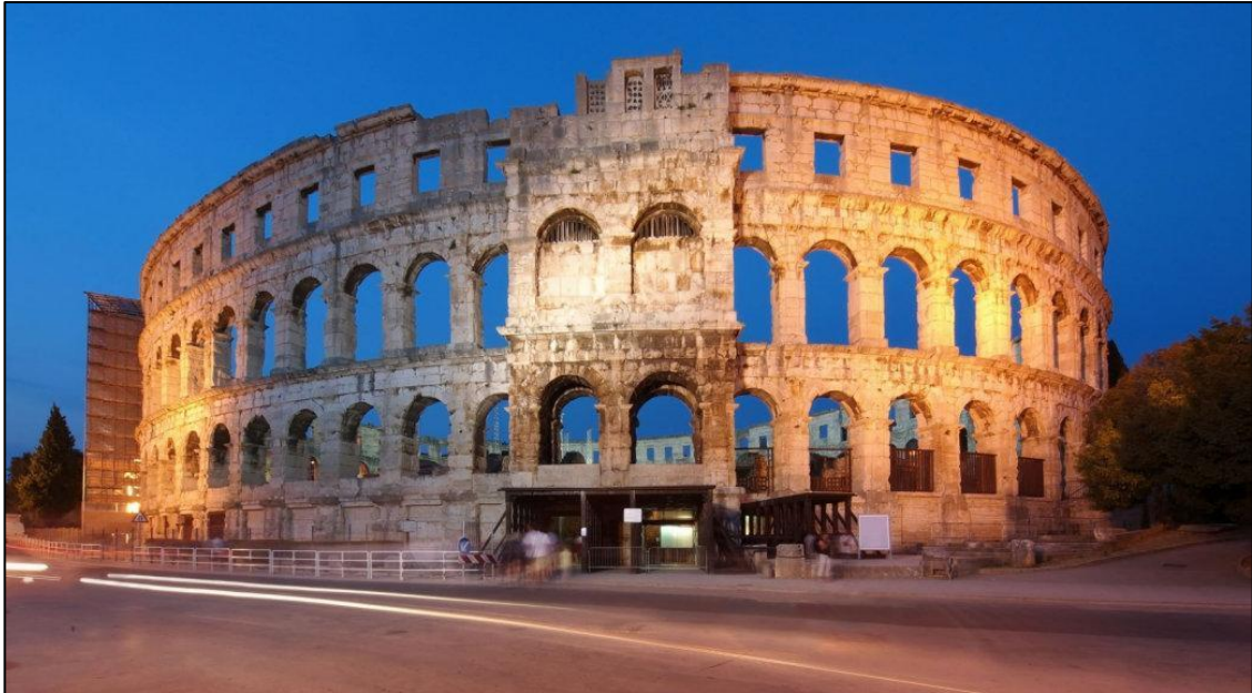
Slika 1: Arena u Puli