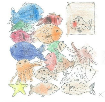
Slika 7: Prikaz izvršenog rada polaznika Centra.