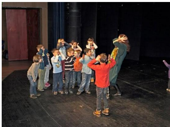
Slika 2: Dvije vrste glazboterapije – Orff metoda i glazbena psihodrama.