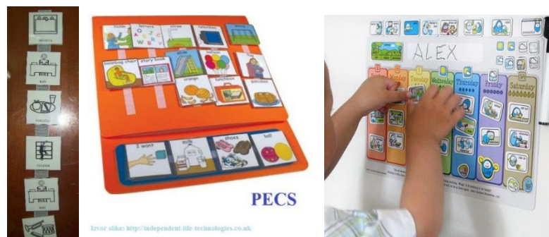
Slika 4: Prikaz PECS (slikovnog potkrepljenja) sistema rada.