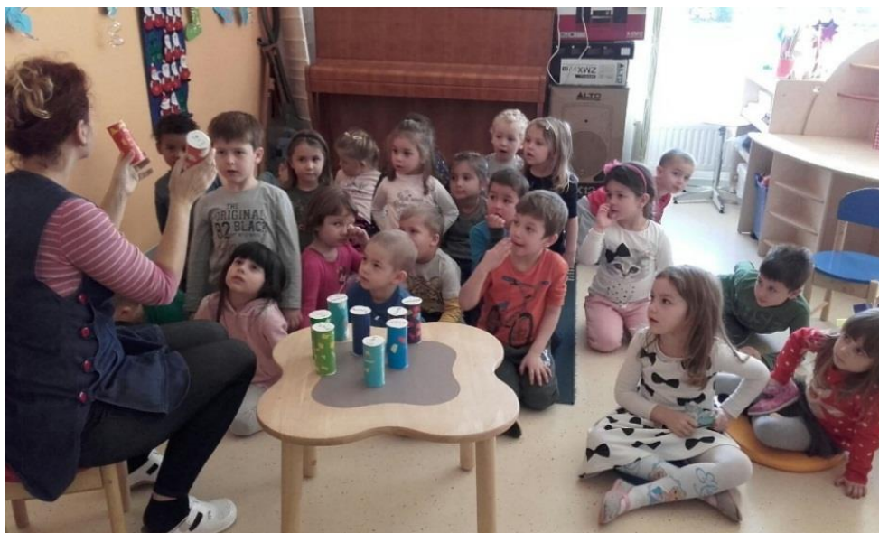
Slika 1: Prikaz glazbene aktivnosti, sviranje sa šušalicama