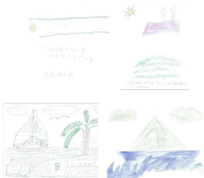
Slika 8: Prikaz crteža polaznika Centra