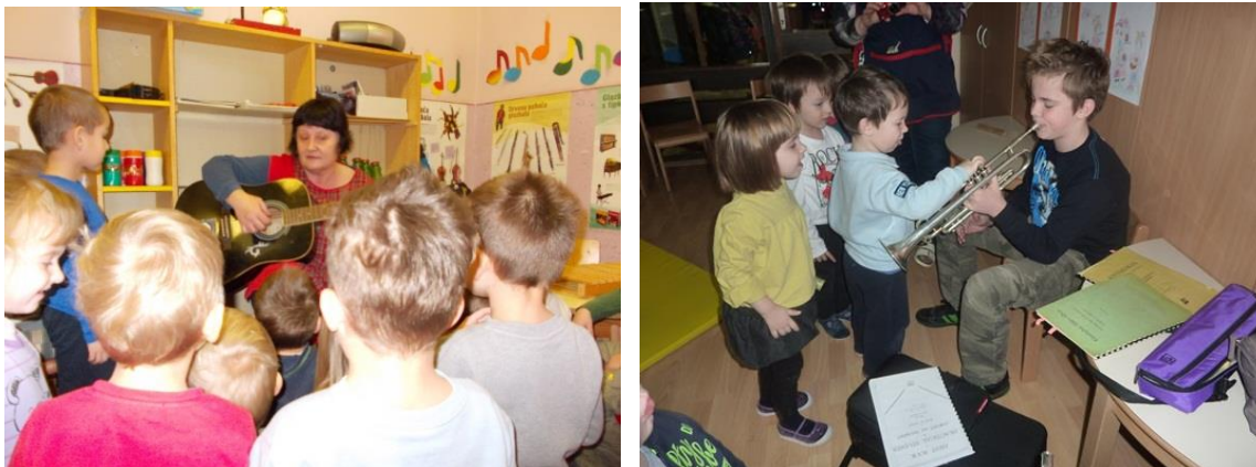
Slika 3: Poticanje dječje kreativnosti – reakcije na sviranje i individualna improvizacije.

Glazba i liječenje glazbom se svakim danom sve više razvijaju. Doneseni zaključci su naveli stručnjake da se više pozabave tom temom, ali i sve osobe koje se bave rastom i razvojem, da glazbu čim više uklapaju u redovne sadržaje.