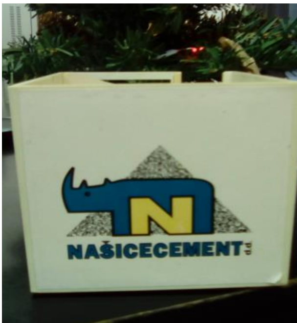
Slika 31. Kutija za papiriće i kemijske