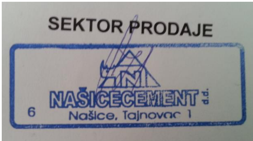
Slika 30. Pečat