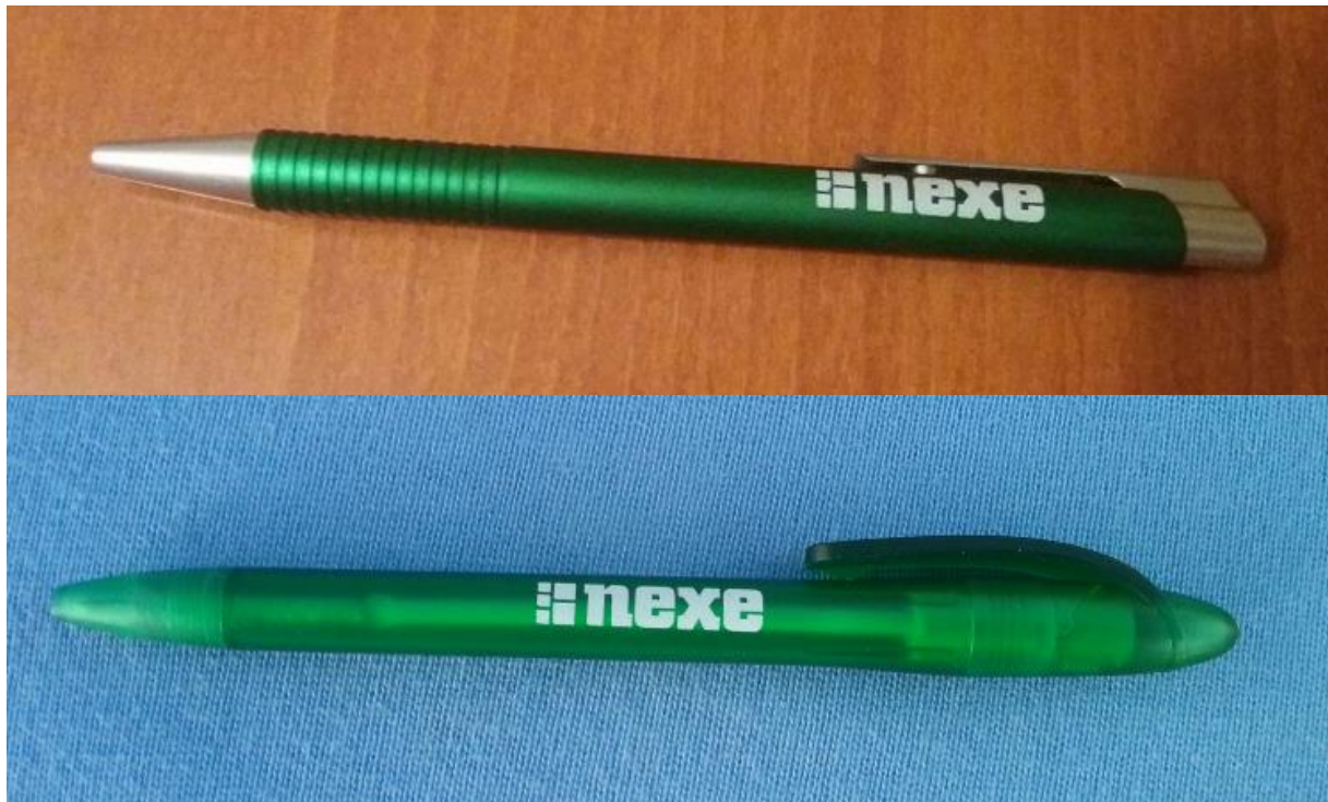
Slika 16. Kemijske olovke