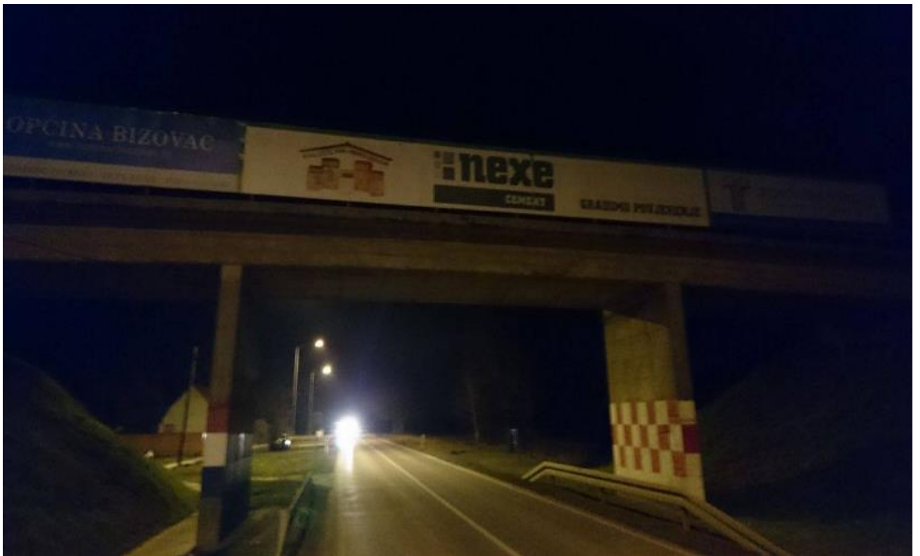
Slika 33. Oglašavanje na mostu