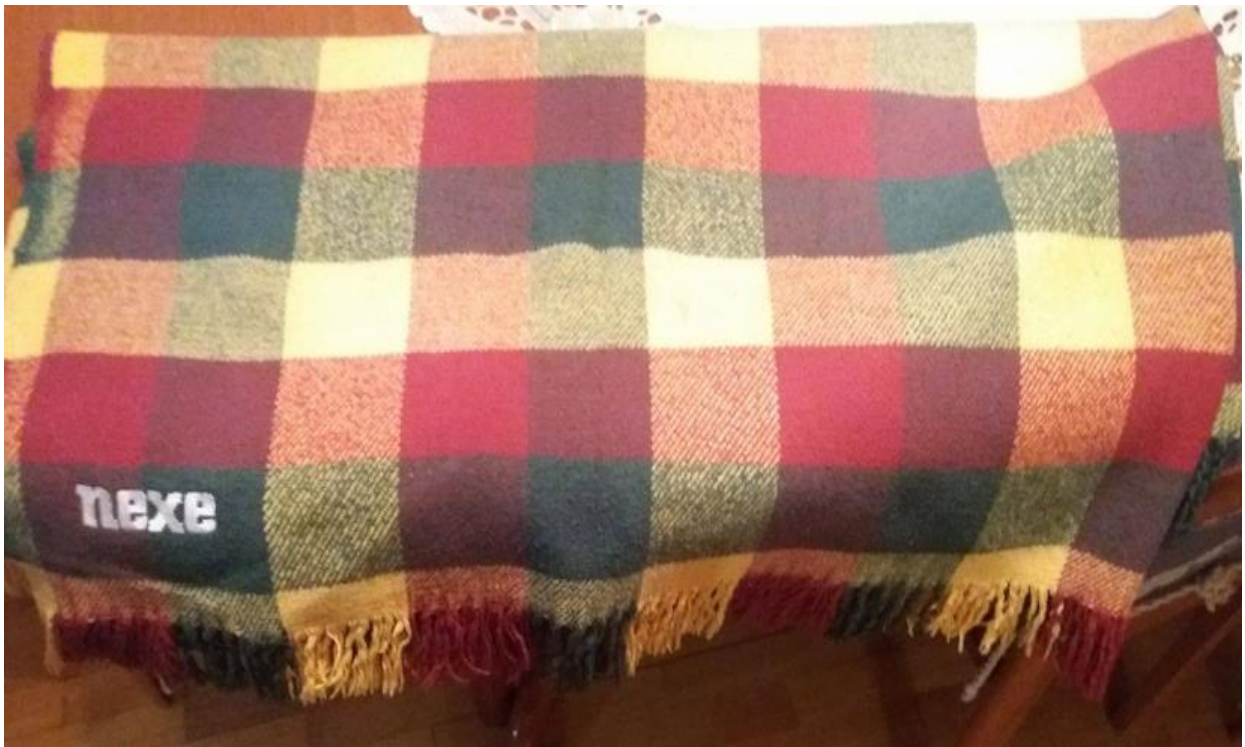
Slika 18. Deku, pokrivač

Na prethodnoj slici prikazan je Nexe upaljač. Logo je prikazan na sredini zelenom bojom s bijelom koja označava samo rubove slova i čini upaljač interesantnijim. Tipografija je ista kao i na ostalim slikama gdje odražava osobnost i diferencira se od ostalih poduzeća.