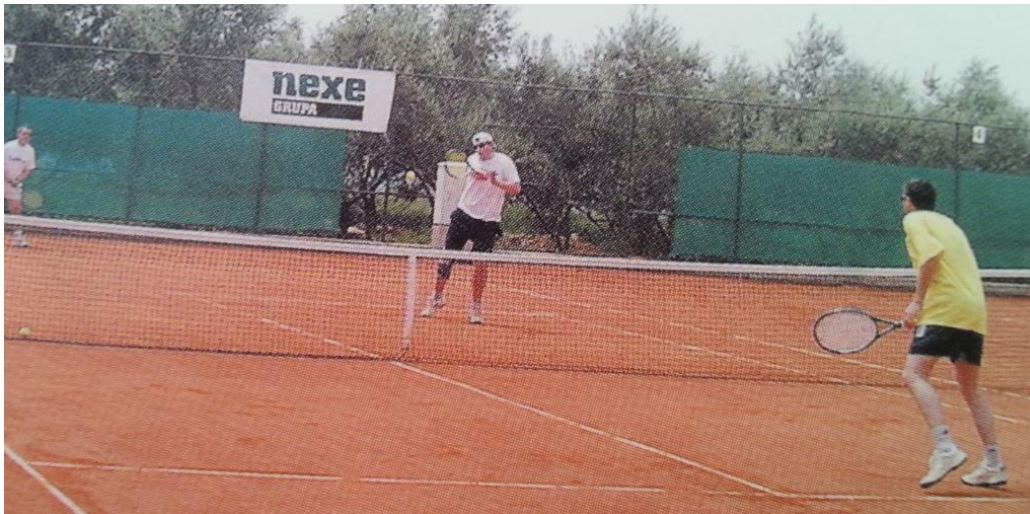
Slika 11. Oglašavanje na teniskom terenu