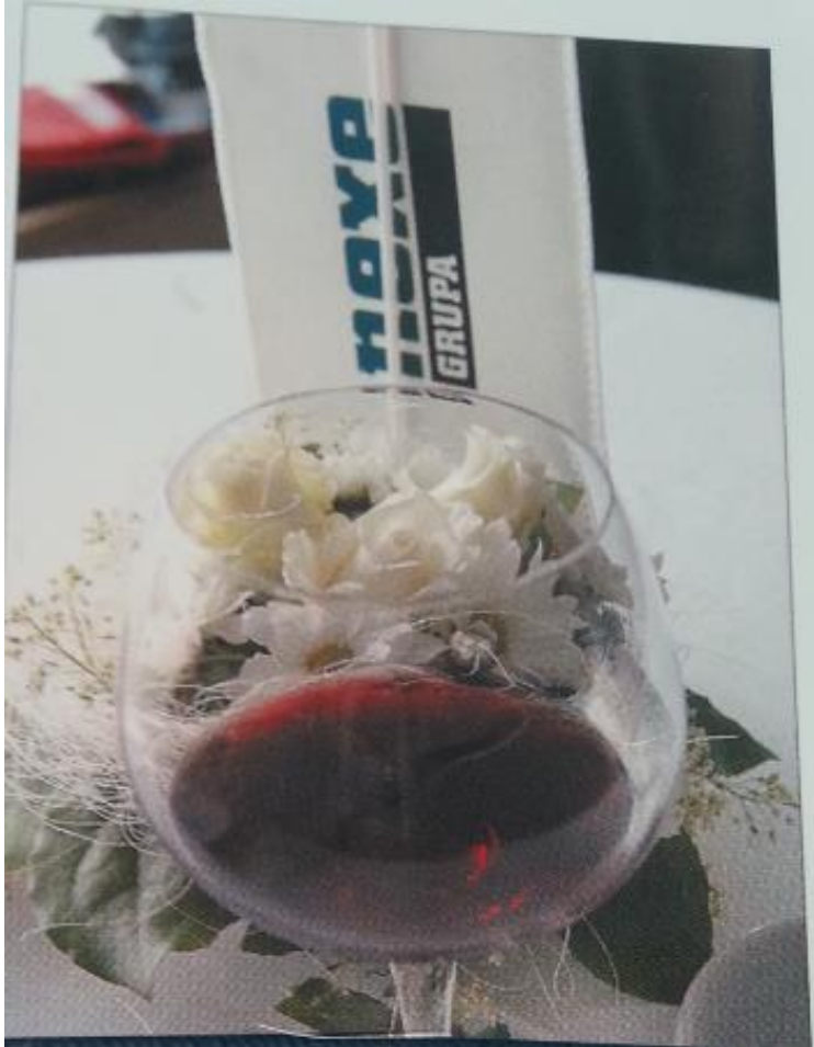
Slika 9. Stolna zastavica