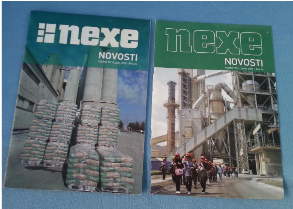
Slika 20. Nexe novosti, časopis