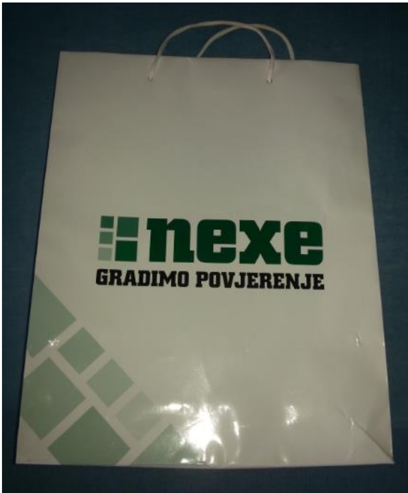
Slika 13. Vrećica

Na prethodnoj slici možemo vidjeti oglašavanje Nexe Grupe na kvalifikacijskoj nogometnoj utakmici između Bugarske i Hrvatske. Danas jako puno ljudi u Hrvatskoj, pa i regiji koja je isto ciljana skupina poduzeća Nexe, prati nogomet, tako da odluka na ovakvom načinu oglašavanju je potpuni pogodak. Što se tiče korporativnog identiteta, i dalje je prepoznatljiv i dobro vidljiv. Boje su jednostavne i prepoznatljive, jedino što je pozadina ovoga puta zelena a slova bijela što i nije prvi put.