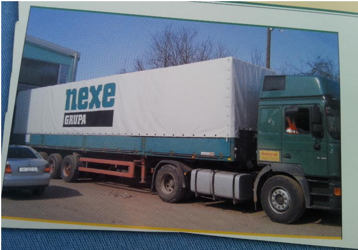
Slika 10. Natpis na vozilu