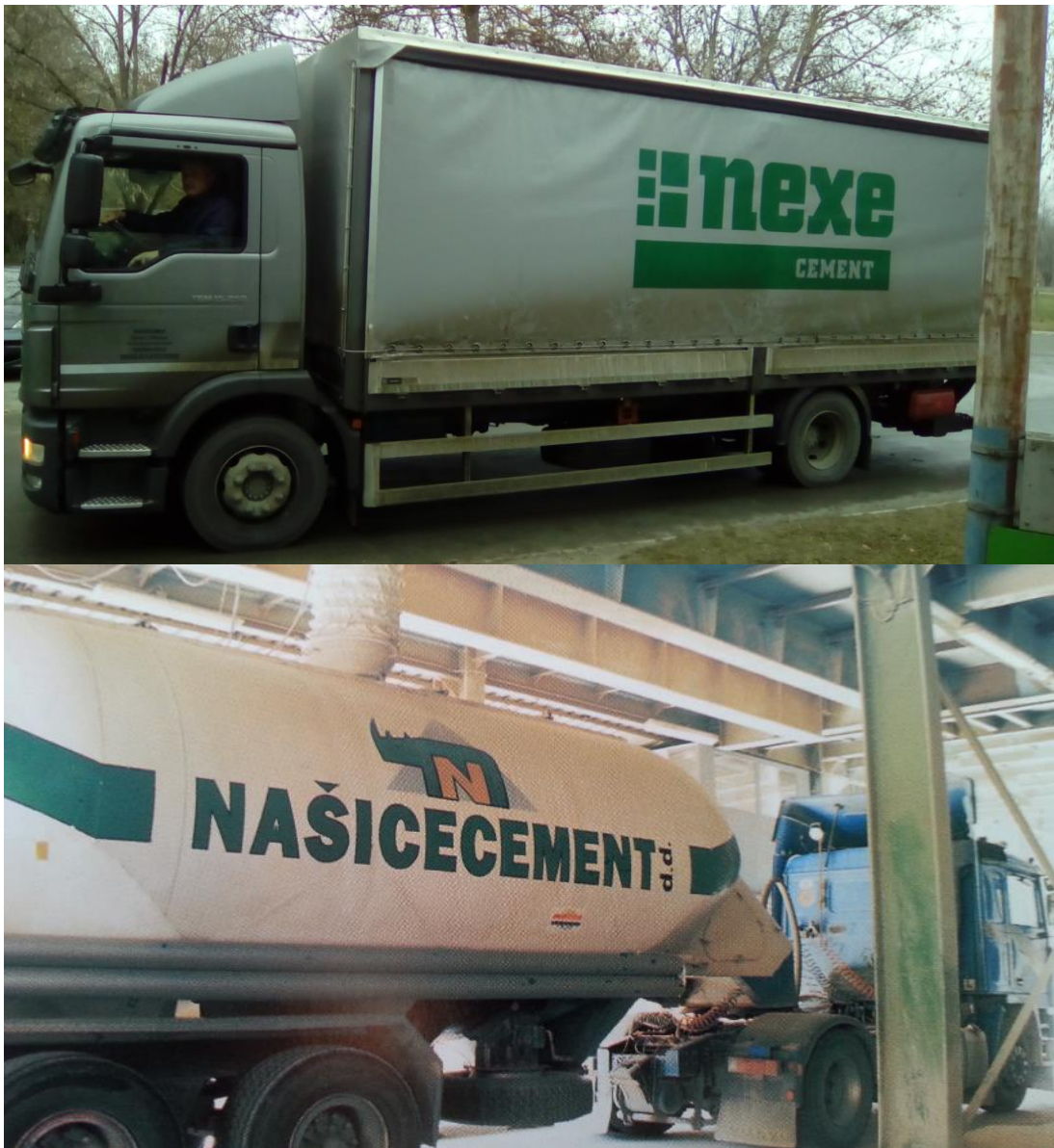
Slika 32. Natpis na vozilima

Na prošoj slici prikazana je kutija za papiriće i kemijske koja predstavlja identitet Našicecemento. Logo se nalazi na sredini predmetnog materijala. Slika prikazuje nosoroga koji simbolizira snagu, dok plava boja simbolizira mudrost, stručnost i stabilnost, zbog čega se često koristi kao korporativna boja. 26