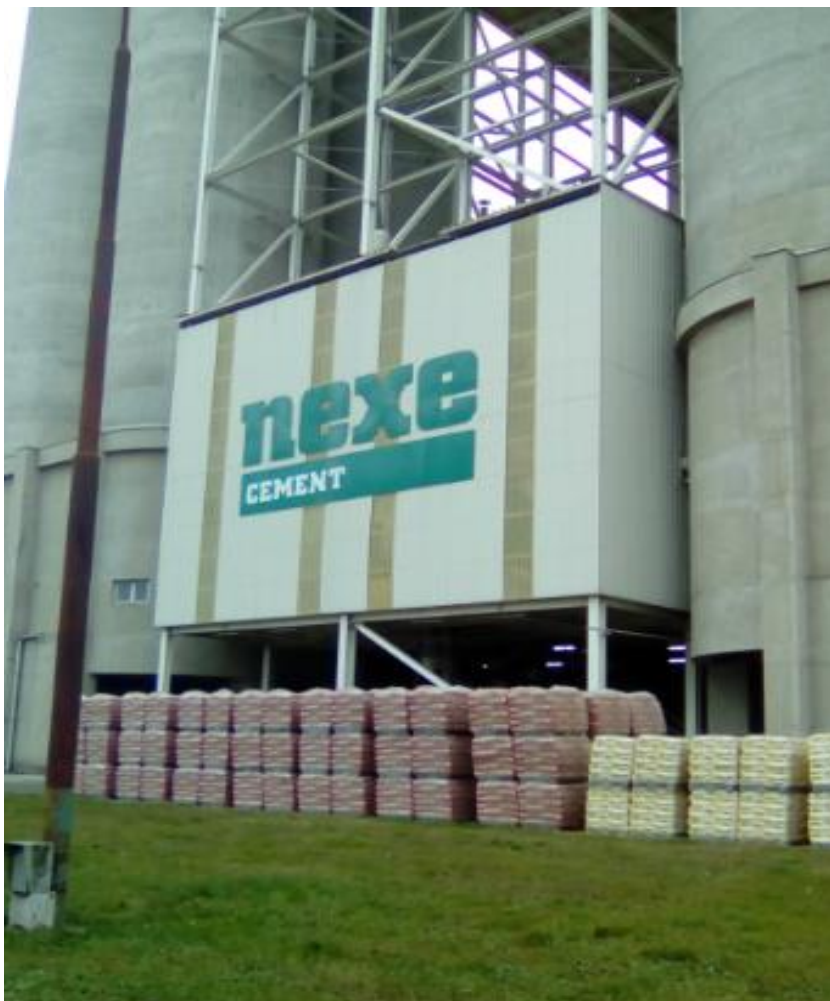
Slika 24. Natpis na tvornici

Za bolji i bliži prikaz samog natpisa i logotipa Nexe cementa možemo vidjeti na sljedećoj slici: