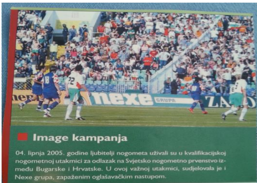
Slika 12. Oglašavanje na nogometnoj utakmici

Na ovoj slici u pozadini terena možemo vidjeti oglas Nexe Grupe. Iako je ovo stariji logotip poduzeća, i dalje je prepoznatljiv široj javnosti. Dobro je pozicioniran zato što se publika, to jest potencijalni kupci nalaze u situaciji da jedino s ove strane gledaju na teren, u ovom slučaju oglas.