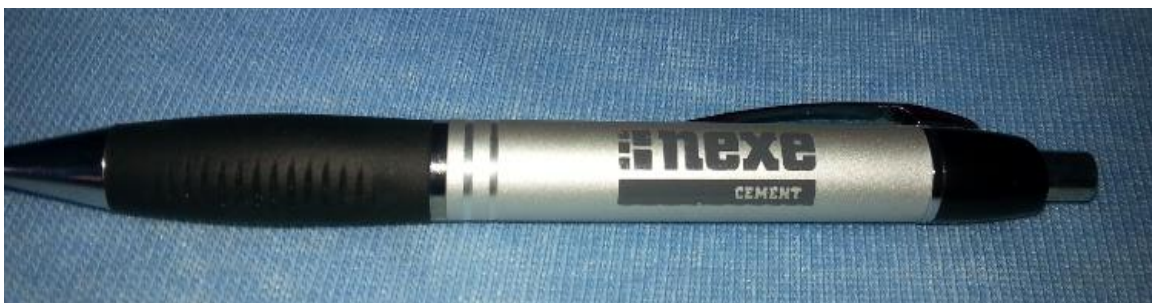
Slika 38. Kemijska olovka

Na prethodnoj slici možemo vidjeti jedan od gotovih proizvoda Nexe cementa. Ovoga puta poduzeće se odlučilo na sivu i crnu boju što se tiče predmetnih materijala jer kao takve najbolje prikazuju cement. Glavni razlog nekorištenja primarnih boja je u tome što ih Nexe Grupa koristi za izradu gotovih proizvoda, a cement je ipak samo njihova članica. Tipografija i logotip su ostali nepromijenjeni.