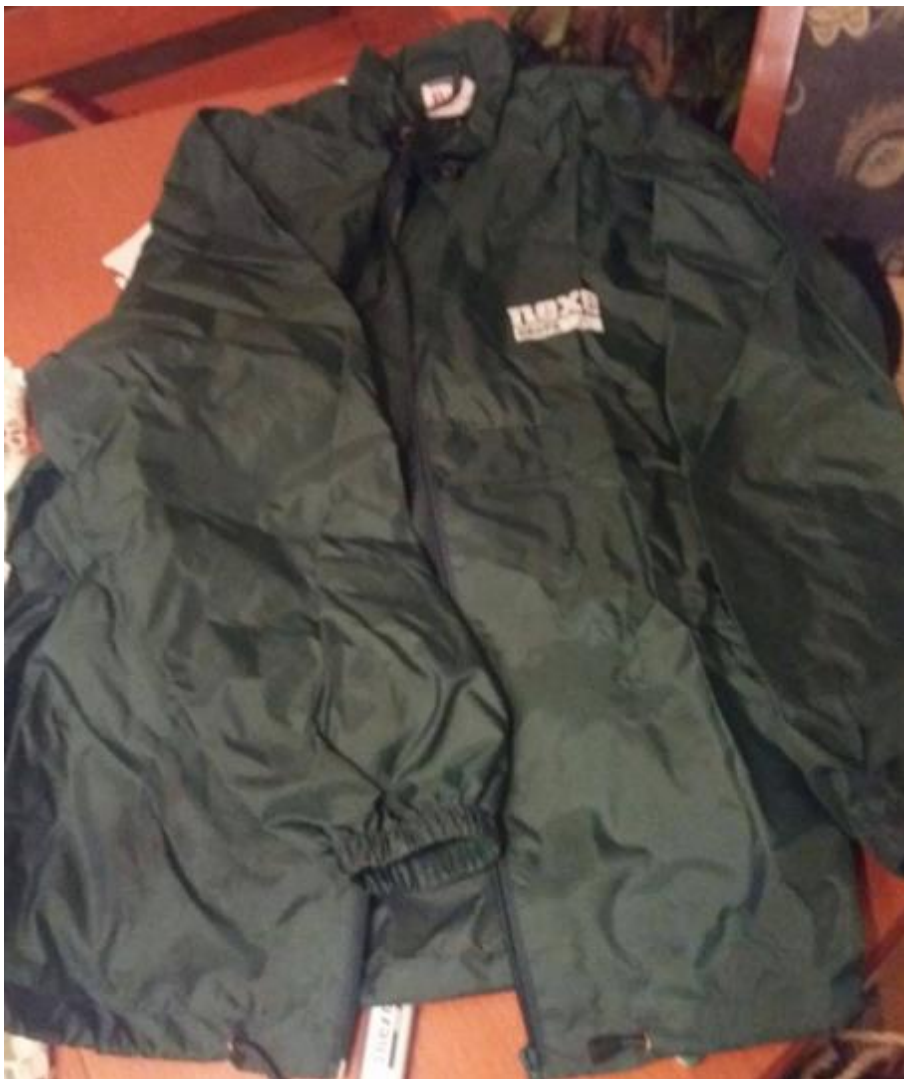
Slika 19. Jakna, šušćavac