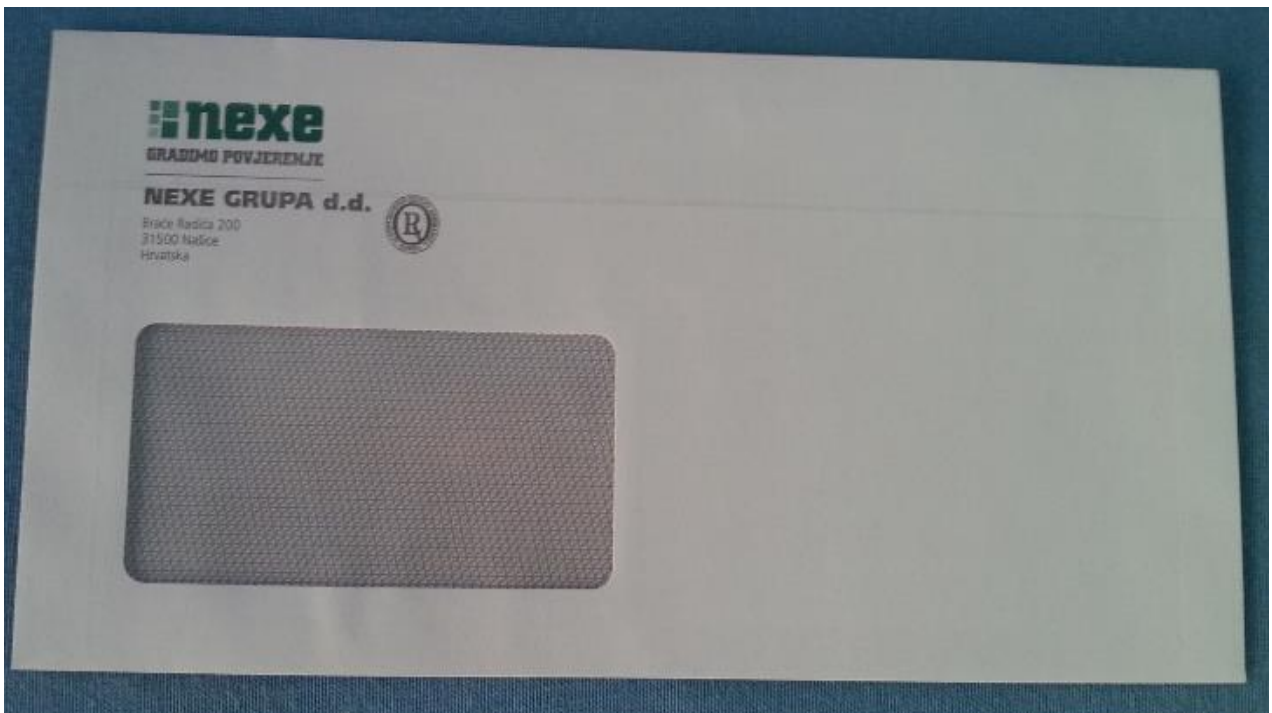
Slika 7. Kuverta

Na ovoj slici prikazan je blok papira koji se koriste u navedenom poduzeću. Najčešće se nalaze na radnim stolovima u svim uredskim prostorijama. Natpis se nalazi na vrhu papira i vrlo je jednostavan i uočljiv. Boja je standardno zelena na bijeloj podlozi koja je odlično vidljiva.