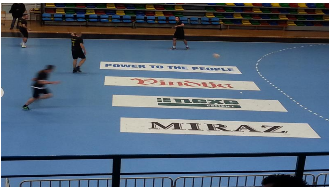
Slika 36. Oglašavanje na malonogometnom turniru

Na ovoj slici korporativni identitet je perfektno uočljiv i prepoznatljiv. Osim odlično pozicioniranog plakata iz ovog kuta gledanja možemo vidjeti i ljepljivu reklamu na parketu kao i malo teže vidljiv natpis na prsima igrača u skoku. Boje su i dalje standardno zeleno bijele.