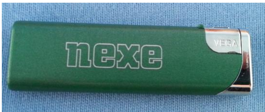
Slika 17. Upaljač

Na ovim slikama možemo vidjeti dvije kemijske olovke različitog dizajna, ali istog korporativnog identiteta za Nexe Grupu. Kemijske, to jest njihov logo je jednostavan i lako prepoznatljiv baš kao i njihova primarna zelena boja koja prevladava. Najviše se koriste na osobnu i poslovnu uporabu, kao i za raznu vrstu promocija.