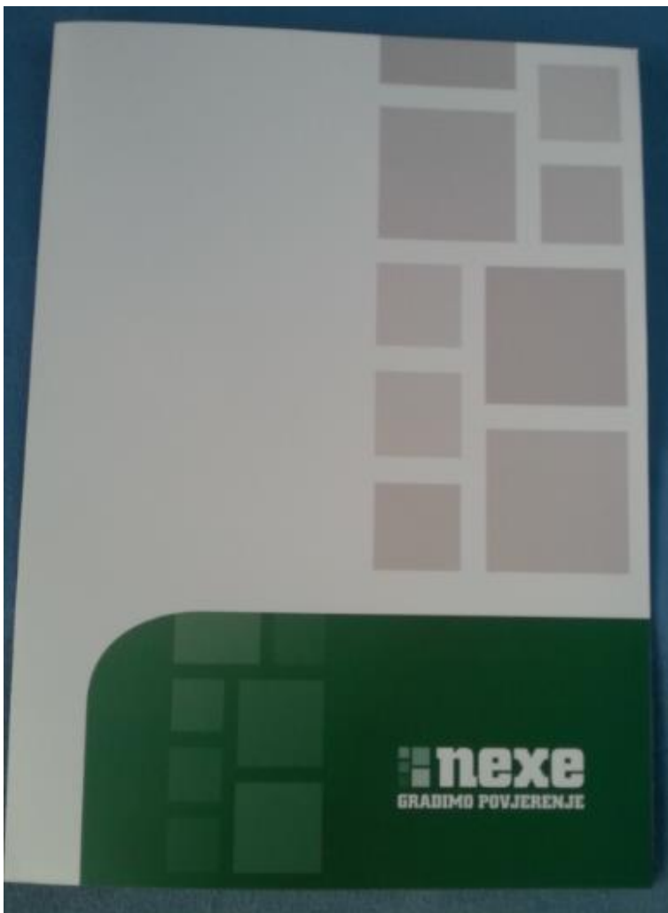
Slika 8. Fascikl, omot za spise

Na prethodnoj slici prikazana je kuverta koju koristi poduzeće Nexe. Gore u lijevom kutu nalazi se logo koji je jako uočljiv sa svojom primarnom, zelenom bojom na bijeloj podlozi. Ispod prepoznatljivog logotipa nailazimo na natpis po kojem možemo zaključiti da je Nexe Grupa dioničko društvo i malo sitniji natpis, ali uočljiv koji ukazuje na poštansku adresu poduzeća.