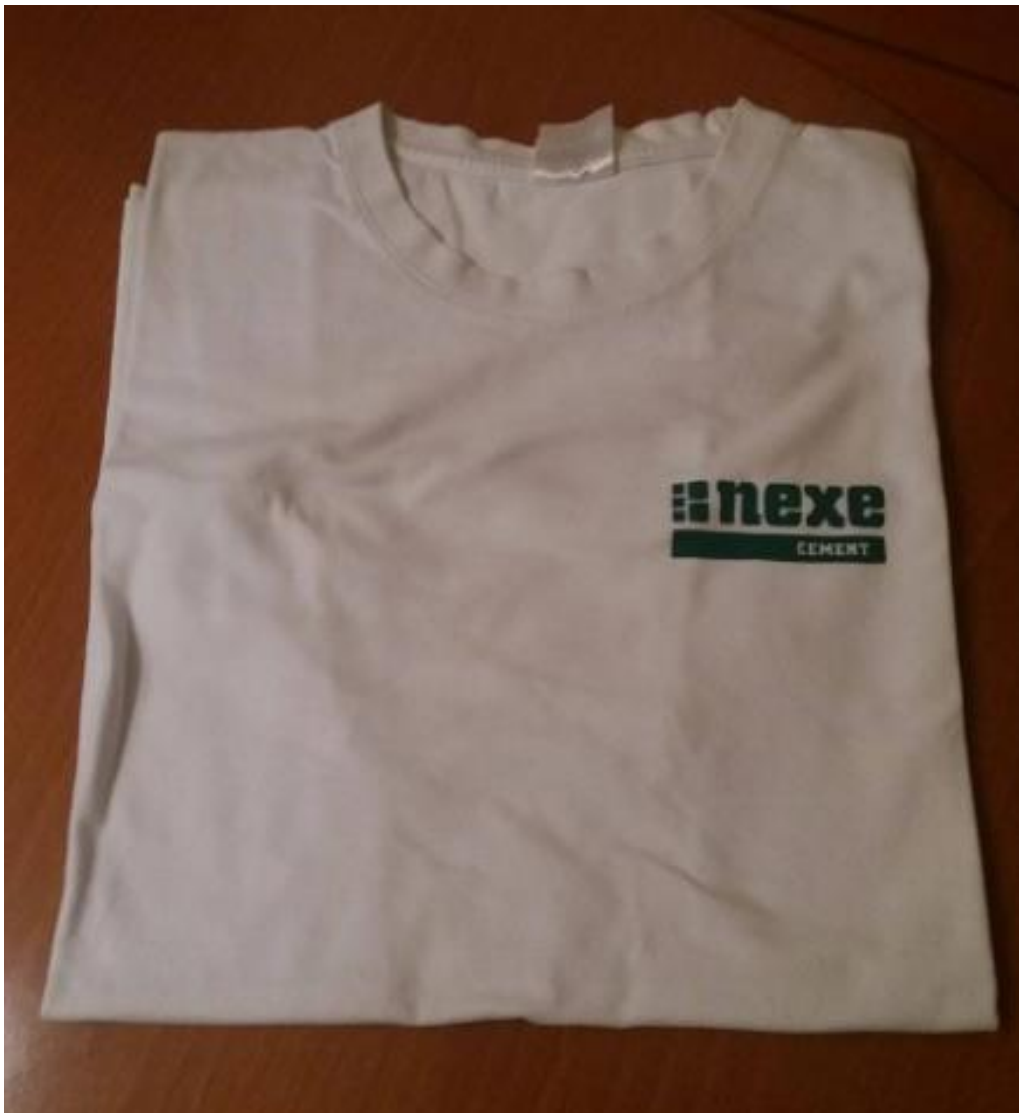
Slika 39. Majica

Prethodna slika prikazuje kemijsku olovku koja predstavlja gotov proizvod. Logotip je smješten na sredini sive podloge tako da dobro „upada u oči“. Boje su iste kao i kod prethodne slike, to jest upaljača, dok je tipografija ista kao i kod drugih materijala i sredstava komunikacije.