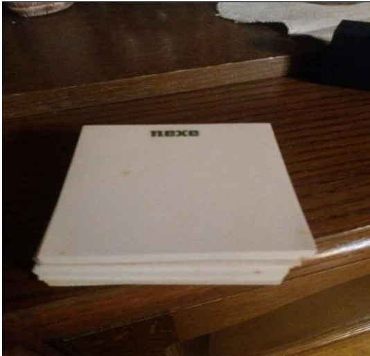
Slika 6. Blok papiri