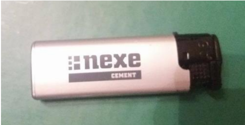
Slika 37. Upaljač