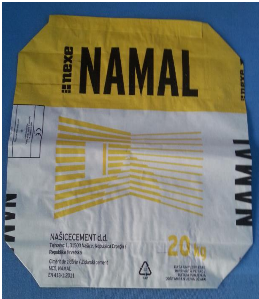
Slika 28. Cement NAMAL

NAMAL je zidarski cement namijenjen pripravi morta za zidanje, cementnog šprica, te grube i fine žbuke. Sadrži minimalno 25% portlandskog cementnog klinkera i oko 75% miješanog dodatka. Isporučuje se u vrećama mase 20 i 45 kilograma.