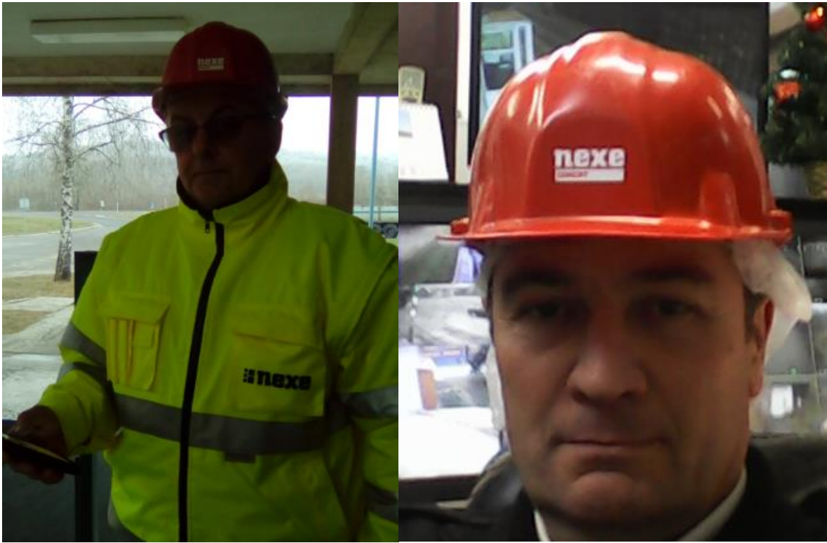
Slika 41. Zaštitna kaciga