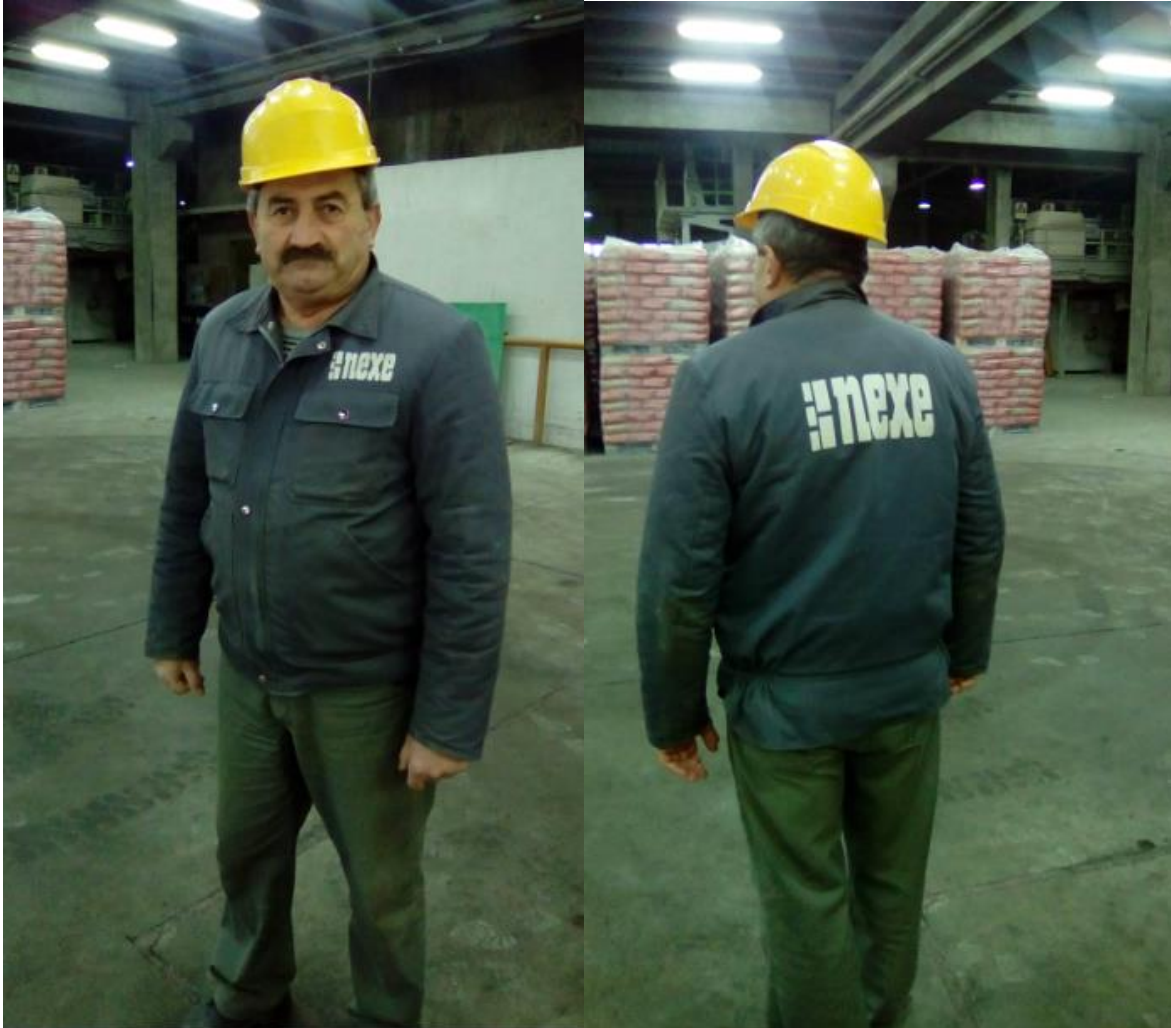
Slika 21. Zaposlenik u radnoj uniformi