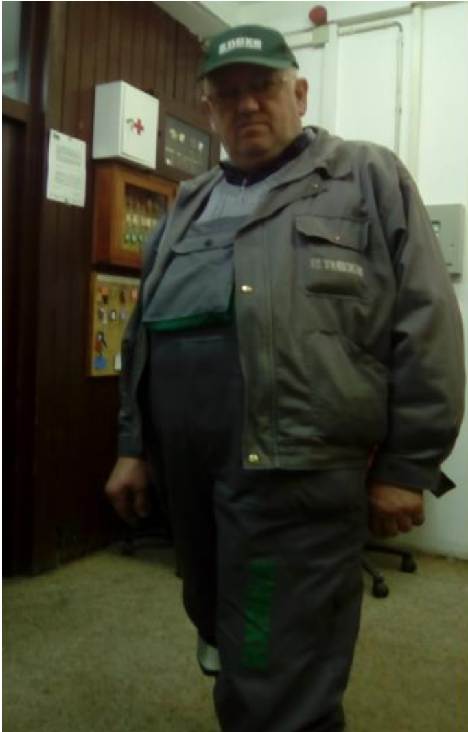
Slika 22. Zaposlenik u radnoj uniformi