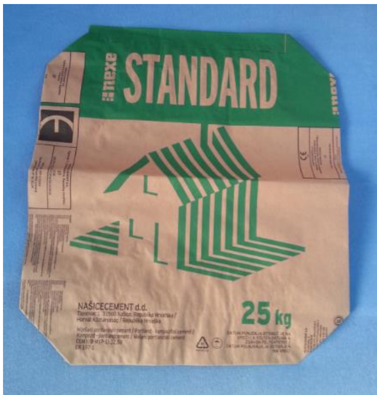
Slika 25. Cement STANDARD

STANDARD je miješani portlandski cement. Namijenjen je pripravi betona i morta za građevinske radove koji se izvode u propisanim uvjetima gradnje za armirane i nearmirane betonske elemente nižih razreda čvrstoće. Najviše se koristi u izgradnji obiteljskih objekata i cestogradnji za izradu stabilizacijskih slojeva. Sadrži minimalno 65% portlandskog cementnog klinkera i oko 35% miješanog dodatka. Možemo ga naći u pakiranju od 25 i 50 kilograma.