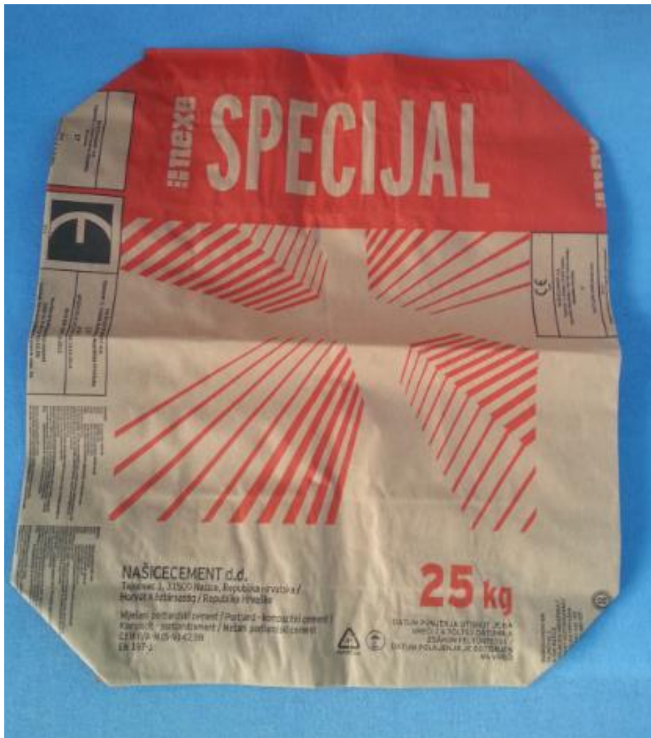
Slika 27. Cement SPECIJAL