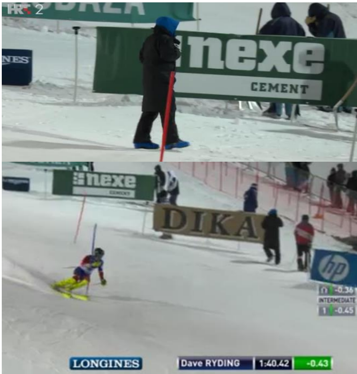
Slika 34. Oglašavanje na skijaškoj utrci