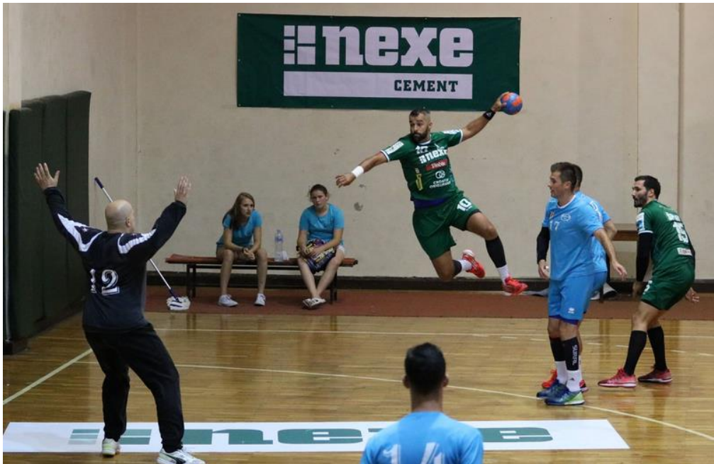
Slika 35. Oglašavanje na rukometnoj utakmici