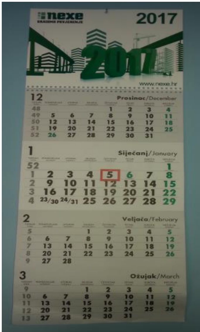
Slika 15. Kalendar