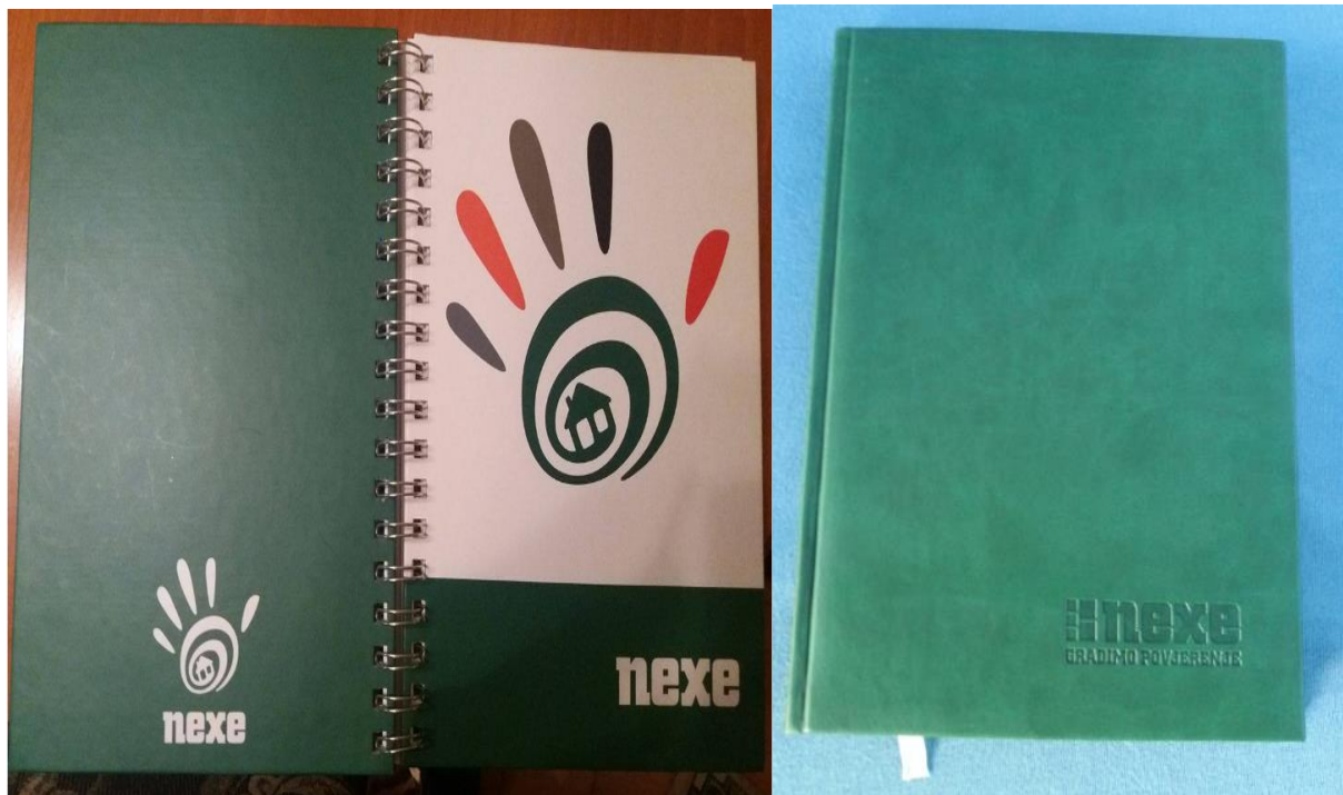
Slika 14. Rokovnici