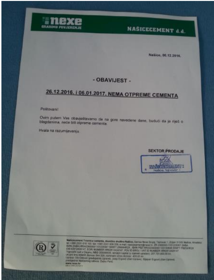
Slika 29. Memorandum