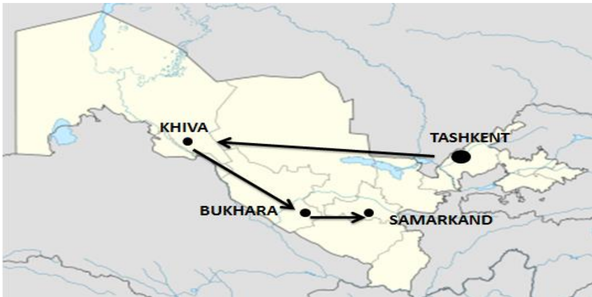
Slika 2. Putovima svile kroz Uzbekistan

Osim što je zemlja bogata arhitekturom, brojnim džamijama i madresama te je dostojno prikazan život ljudi toga vremena sadrži i mnoge nedostatke zbog kojih se turisti možda neće odlučiti posjetiti odredište. Problem čine politički nemiri kao i zemljopisna udaljenost za europske posjetitelje. Turistička tura predstavlja pozitivnu stranu zemlje, no zbog političkih nemira, mnogi turisti će Uzbekistan zaobići na svom putovanju.