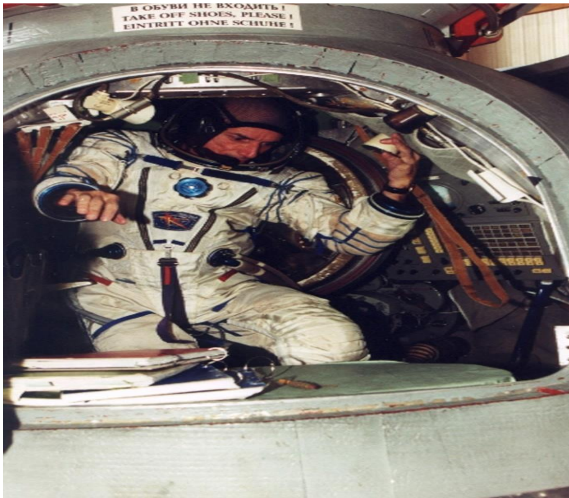
Slika 1. Denis Tito – prvi turist u svemiru

2001. godine kada je Denis Tito (sl.6) kao američki državljanin platio 20 milijuna američkih dolara da bi gostovao u ruskoj letjelici. Već tada ljudski um razmišlja o većim letjelicama i stvaranju linije Zemlja – Mjesec i mašta o posjetu svemirskim stanicama.