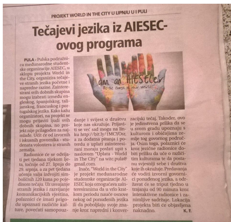
Slika 5. Medijska objava u novinama „Glas Istre“