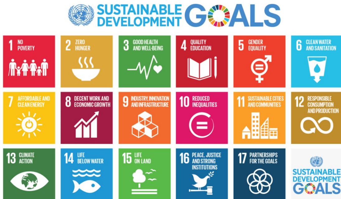
Slika 7. Ciljevi za održivi razvoj