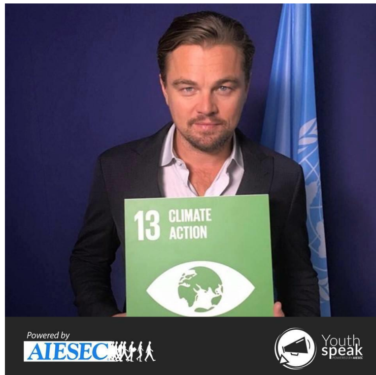
Slika 8. Promocija cilja br. 13, klimatske promjene