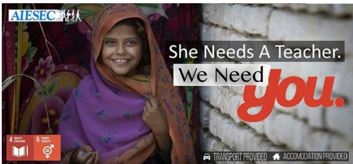
Slika 3. Oglašavanje volonterske prakse