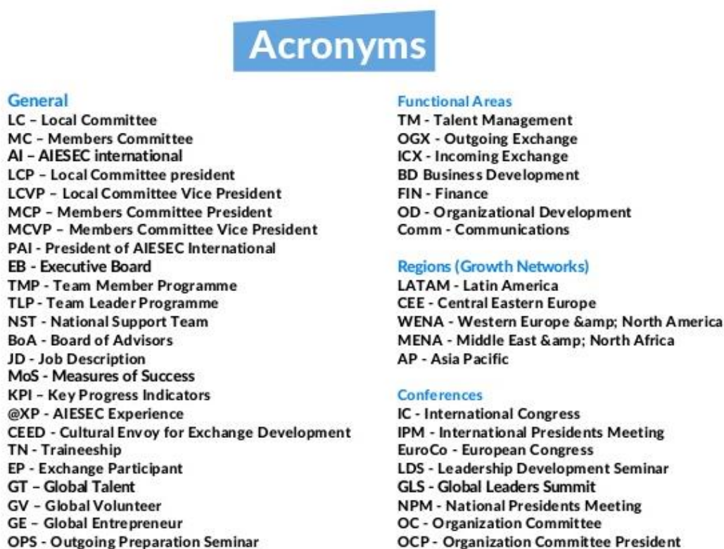
Slika 6. Kratice AIESEC organizacije