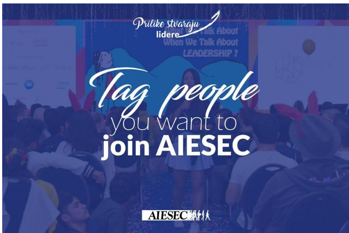
Slika 4. Poziv na učlanjenje