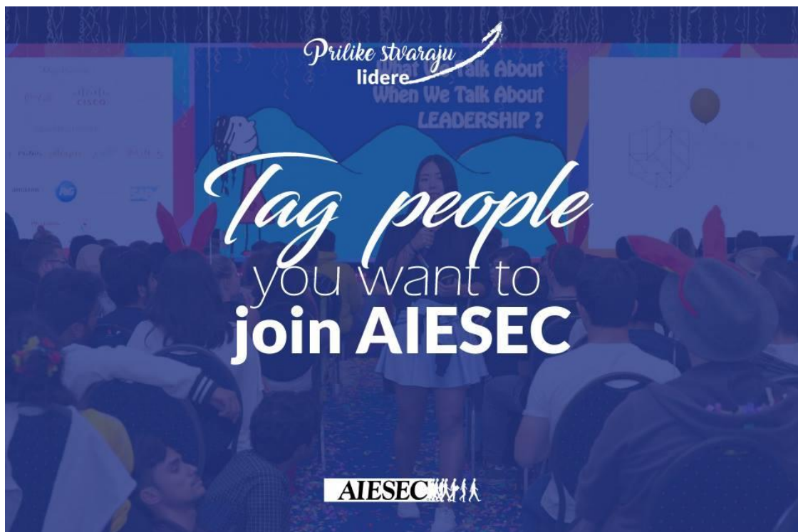
Slika 4. Poziv na učlanjenje