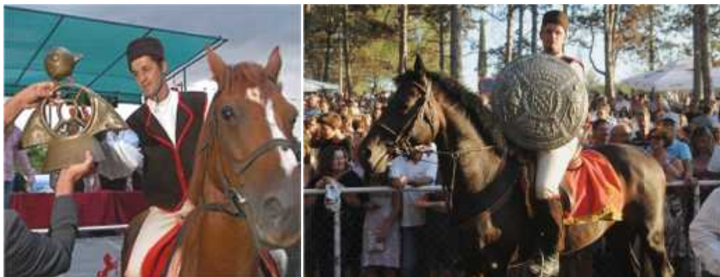
Slika 3. Slavodobitnici s prijelaznim nagradama („Ptica – Prstenac“ i „Štitić“)