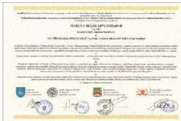
Slika 24. Povelja o prijateljstvu i suradnji Grada Sinja i Općine Barban te Viteškog alkarskog društva Sinj i Društva Trka na prstenac Barban

O uvanju i nastavku tradicije održavanja ovih dviju konji kih igara svakako pridonose i ina ice koje su se razvile po njihovu uzoru. Tako su se razvile mototrke i morske trke na prstenac, dje je alke i razvojem suvremene tehnologije robotrke i roboti ka alka.