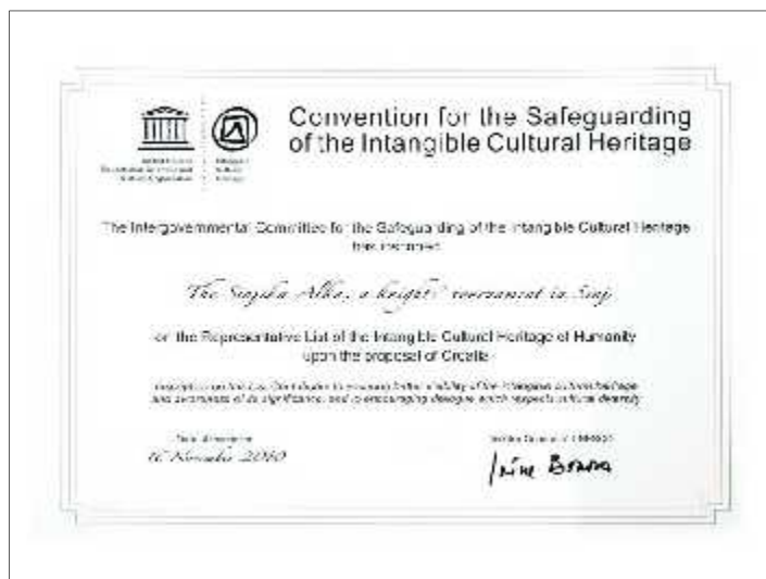
Slika 12. UNESCO-va Povelja o upisu Alke na Reprezentativnu listu nematerijalne kulturne baštine ovje anstva, 2010.