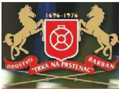
Slika 4. Grb Društva Trka na prstenac

Prema podacima iz 1696., Trka se održavala na dan Duhova u lipnju, ali su organizatori obnovljene Trke odlučili ili termin premjestiti u kolovoz, kada je turistička sezona u punom jeku. Njezina je svrha održavanja, tako je od samih početaka, izrazito turistička. Od tada se Trka na prstenac održava tri vikenda u mjesecu kolovozu. Službeni dio programa započinje u večernjim satima, u petak sveanim podizanjem zastave s grbom Društva Trka na prstenac 13 (sl. 4). Nastavlja se otvaranjem izložbi i drugim kulturnim programima te tradicionalnim turnirom u briškuli i trešeti. Idući dan, u subotu, središnji događaj je Trka za viticu, a uz nju organizirani su i sportski događaji, nogometni turnir i turnir u pljočkanju. Navečer je na glavnom trgu organizirana zabava uz koncert popularnih izvođača. U nedjelju je glavni događaj, odnosno Trka na prstenac koja započinje u 17:00 sati, a nakon toga slijedi kulturno-umjetnički program i koncert zabavne glazbe.