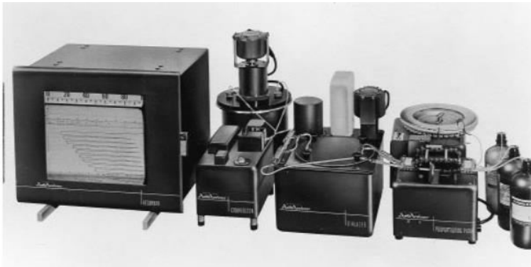
Slika 2. AutoAnalyzer

Izvor: Hemar, M. (2013.) Prilog povijesti medicinske biokemije . Dostupno na: https://bib.irb.hr/datoteka/657246.Diplomski_rad_Marina_Hemar.pdf . Datum posjete: 10.05.2017., str. 64.