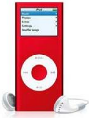
Slika 4. Apple-ov iPod