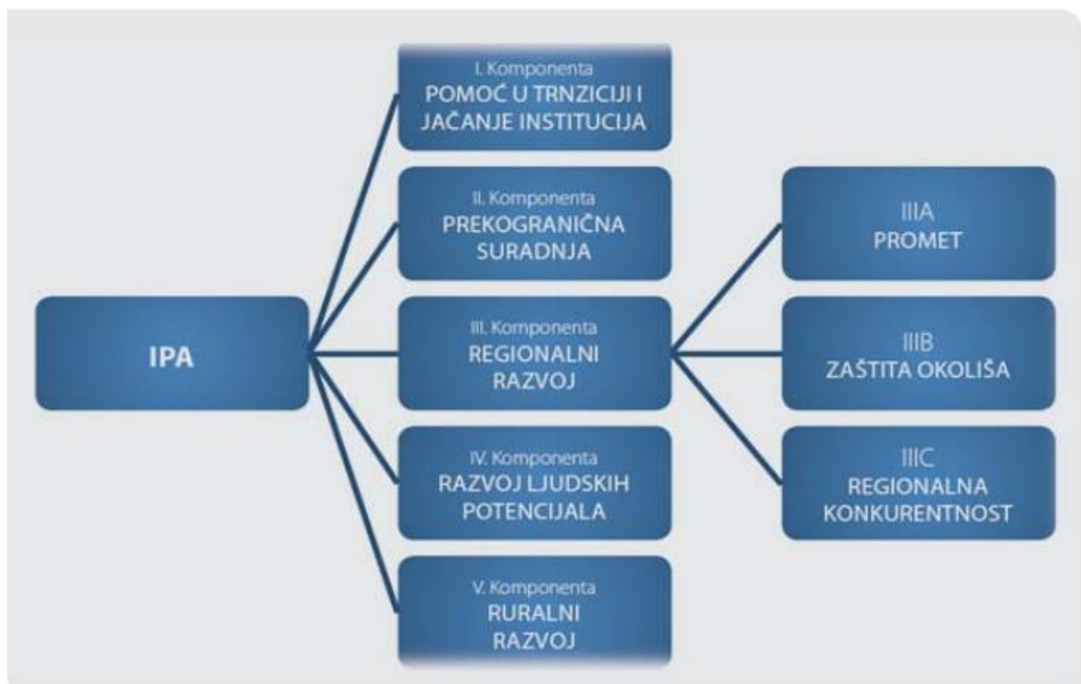
Slika 3: IPA komponente