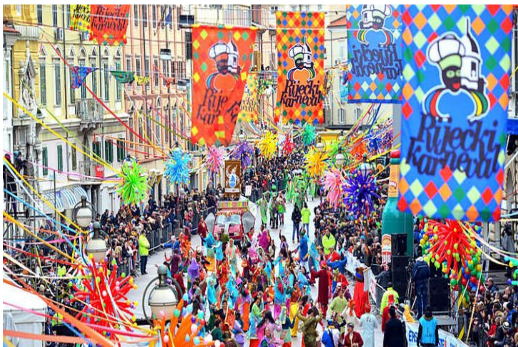
Slika 6. Riječki karneval

s više od 10.000 sudionika, te 100.000 gledatelja. Povorke prikazuju razne motive, oni se kreću od tradicionalnih do modernih. Karnevalski se život u Rijeci njeguje već više od sto godina, a od 1982. godine popraćen je povorkama i plesom koji se uobičajeno kreću kružno od rive preko Delte i završavaju na Korzu. Posebnost Riječkog karnevala je sudjelovanje zvončara, oni su ogrnuti ovčjom kožom a oko pojasa imaju zvono.