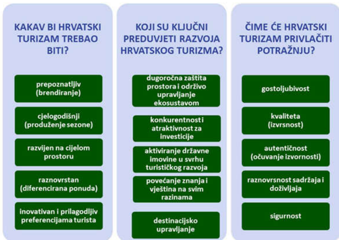
Slika 2. Sustav vrijednosti nove vizije hrvatskog turizma