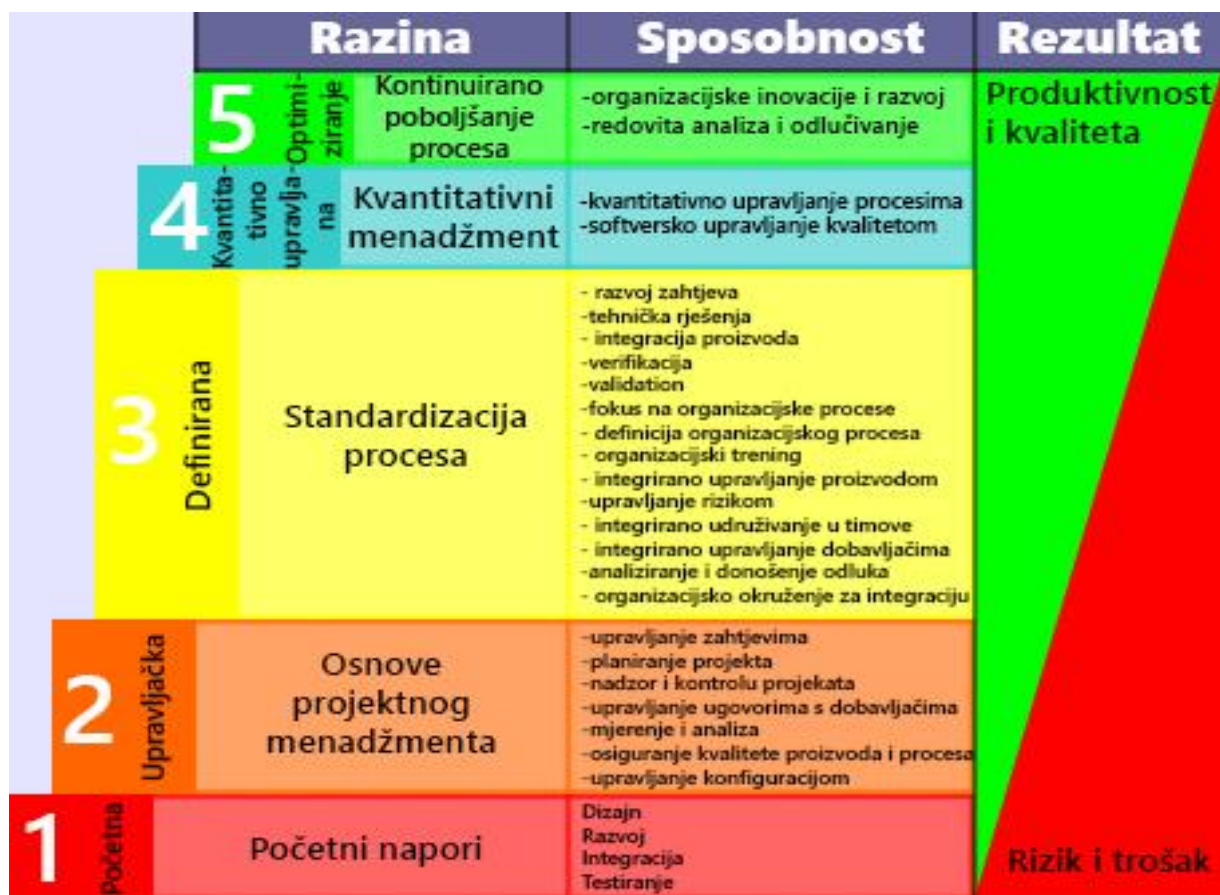
Slika 2. CMM Model

Izvor: Cindrić Josip, ZRELOST ORGANIZACIJE (CMMI - Capability Maturity Model Integration), Sveučilište u Zadru, 2009., str. 18