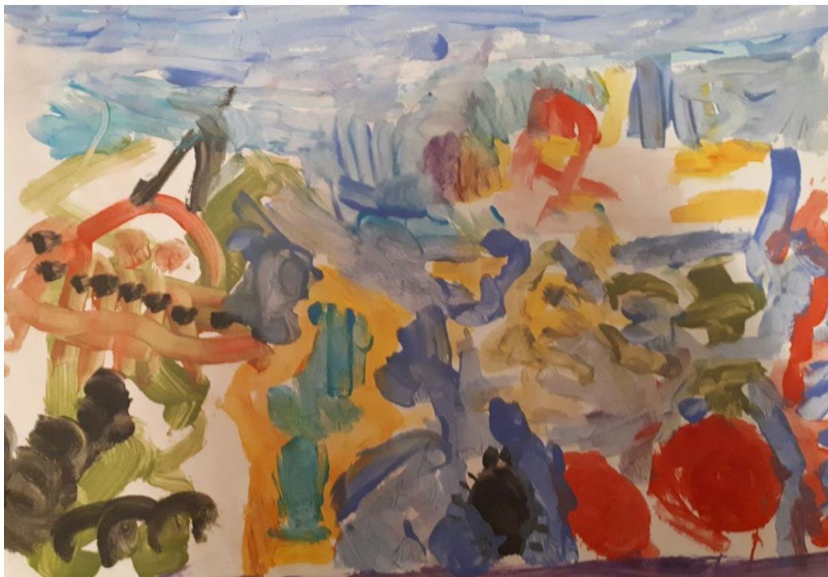
Slika 2. Morsko dno, dječak L., 6 god 5 mj.