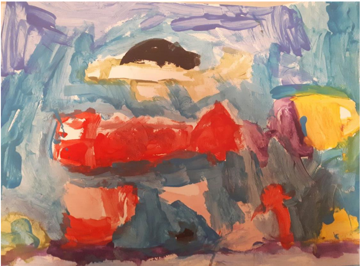
Slika 11. Morsko dno, dječak P. 6 god 3mj.

Djeca su i posljednje postavljeno pitanje doživjela kao dobru priliku za razmjenu mišljenja, iskustava i znanja. Nakon rasprave upoznala sam ih s još jednom slikom.