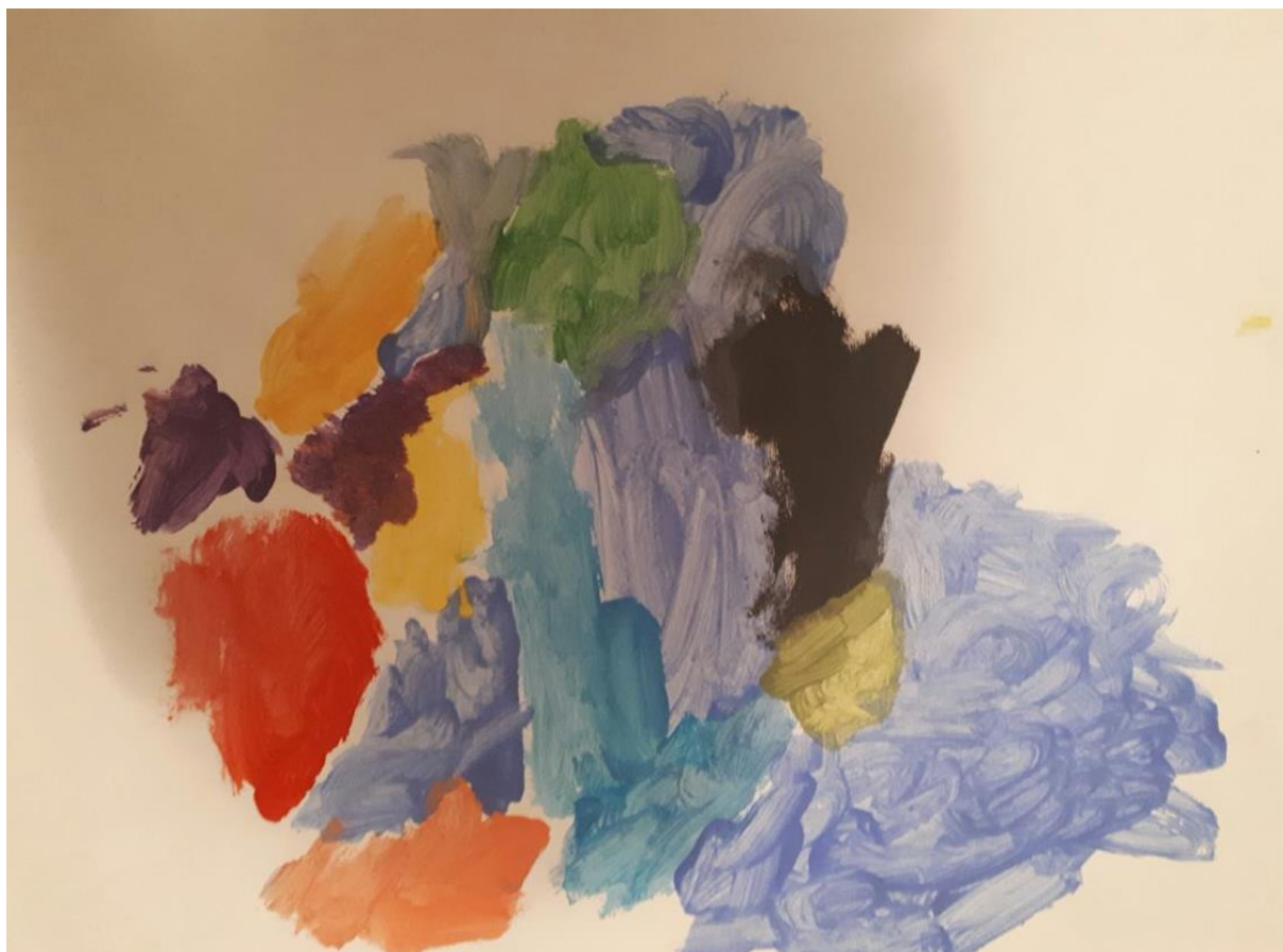
Slika9. Morsko dno, dječak M., 4 god 4mj.