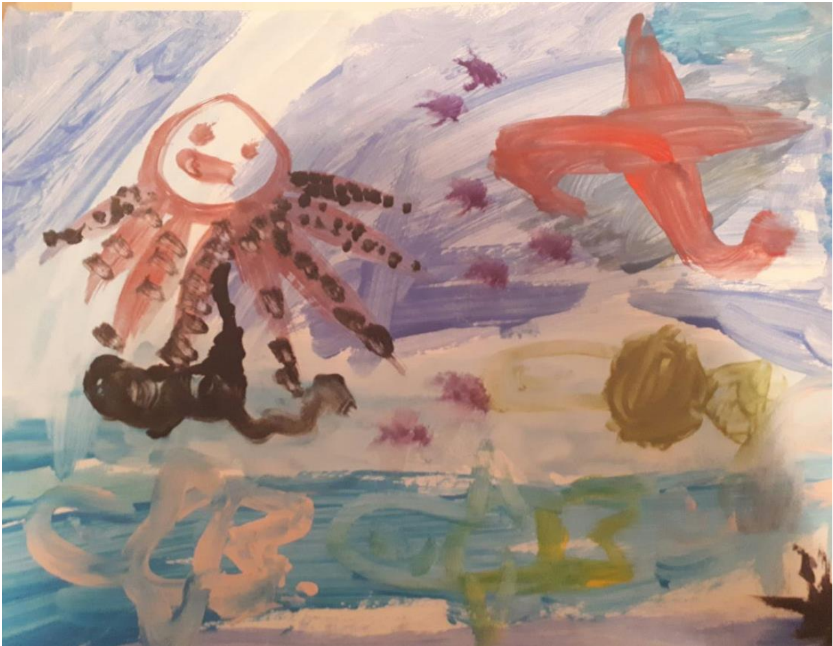
Slika 1. Morsko dno, dječak T., 6 god. 9 mj.

Tijekom razgovora o crtežima djeci sam postavljala pitanja na koja su ona odgovarala.