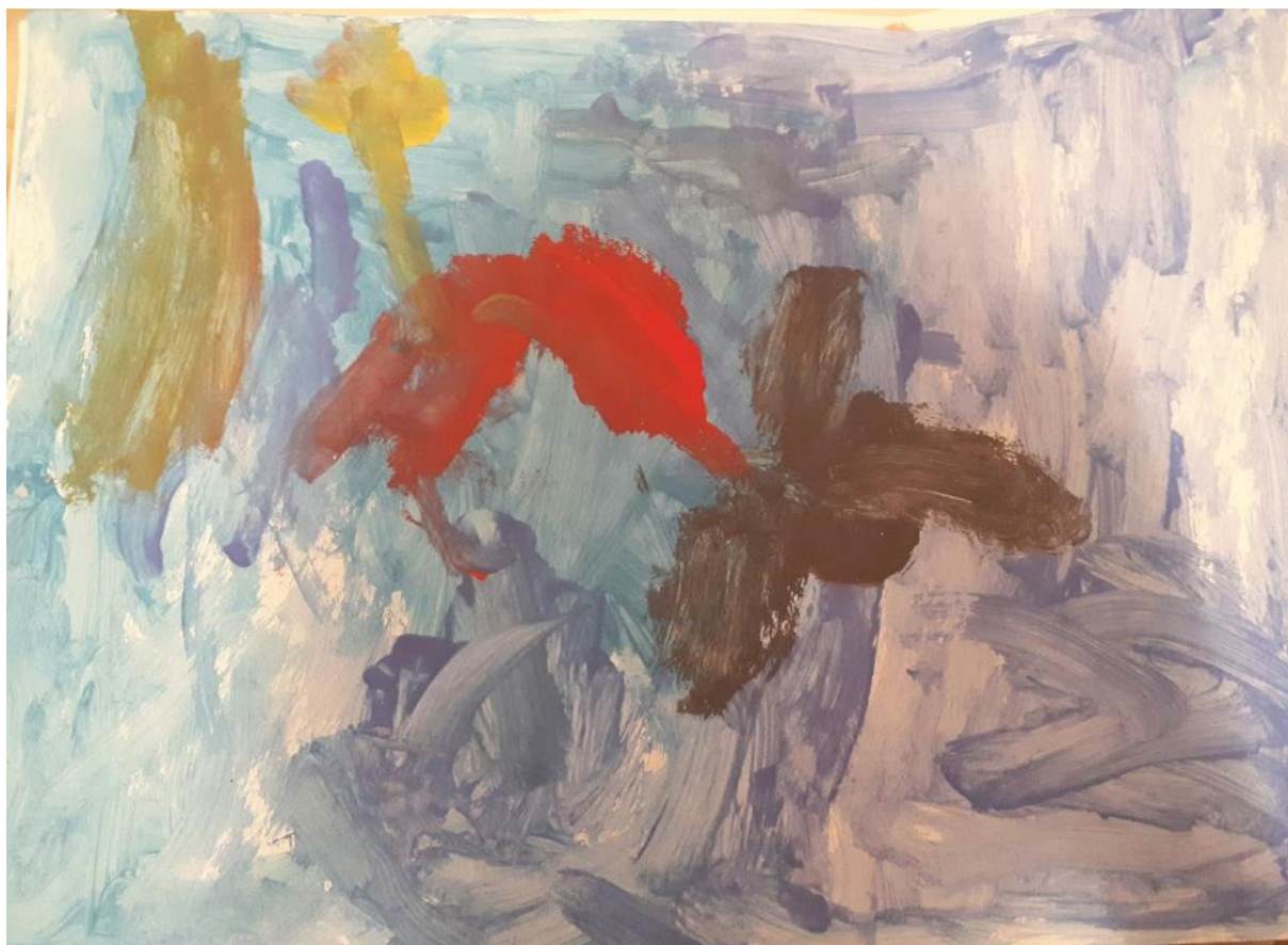
Slika 7. Morsko dno, djevojčica I., 4 god 5mj.

P: Koje biljke ili životinje možete se nalaze na tvojoj slici?