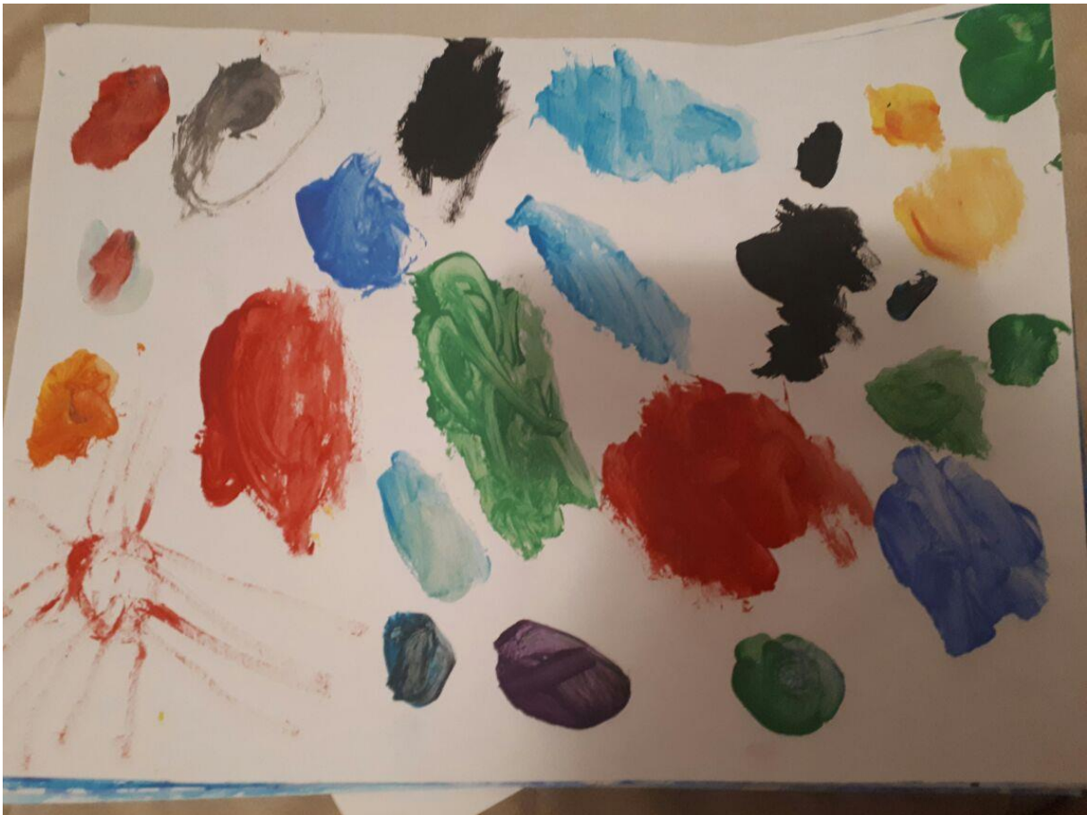
Slika 8. Morsko dno, djevojčica E., 3 god 3mj.