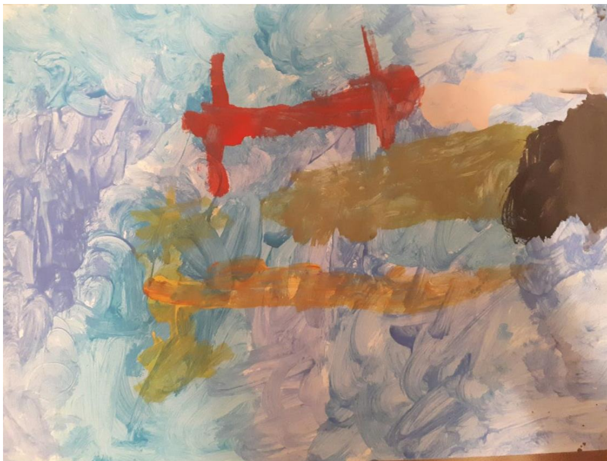
Slika 5. Morsko dno, djevočica E., 4 god 3mj.