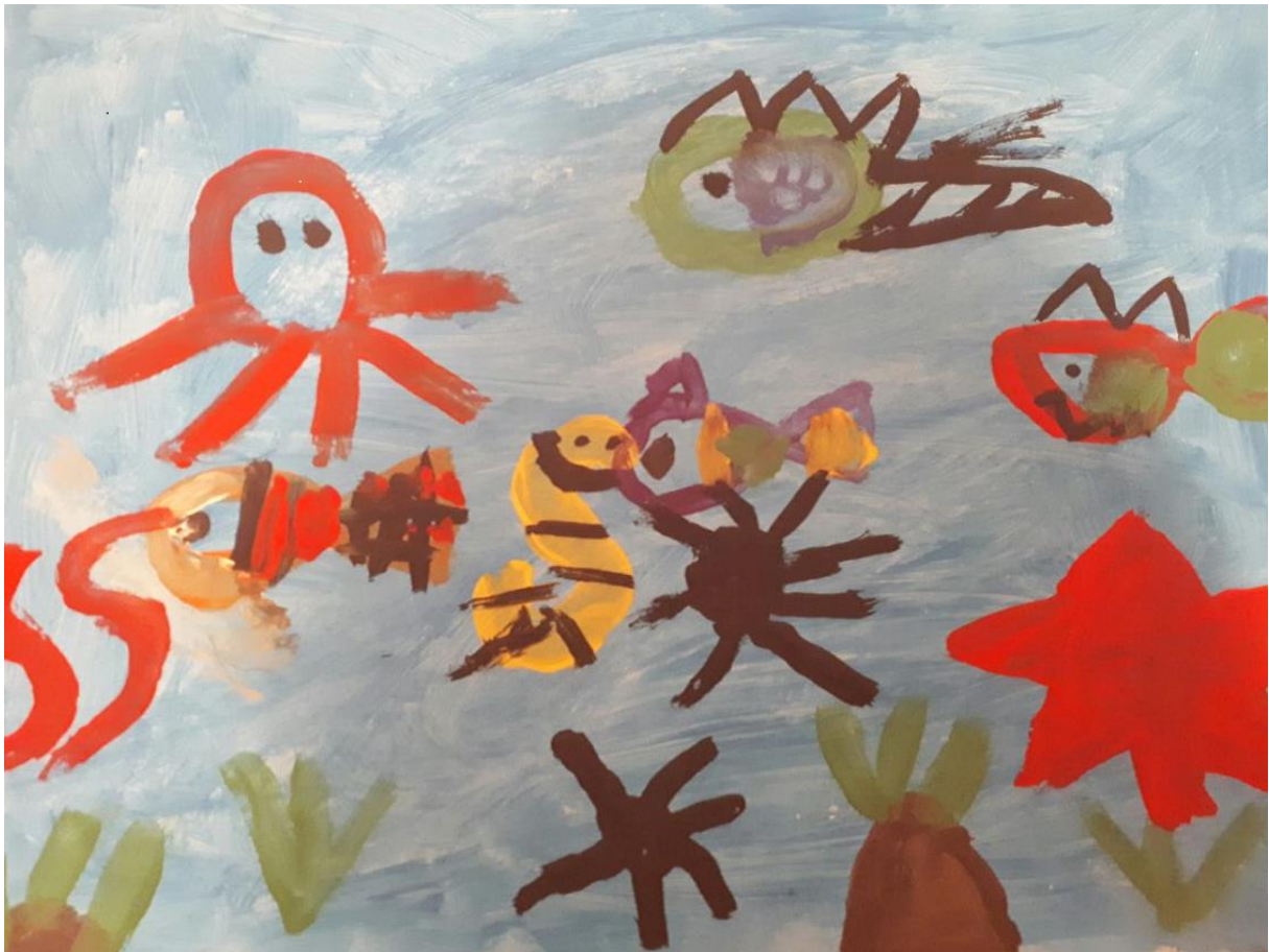
Slika 12. Morsko dno, djevojčica M., 7 god.