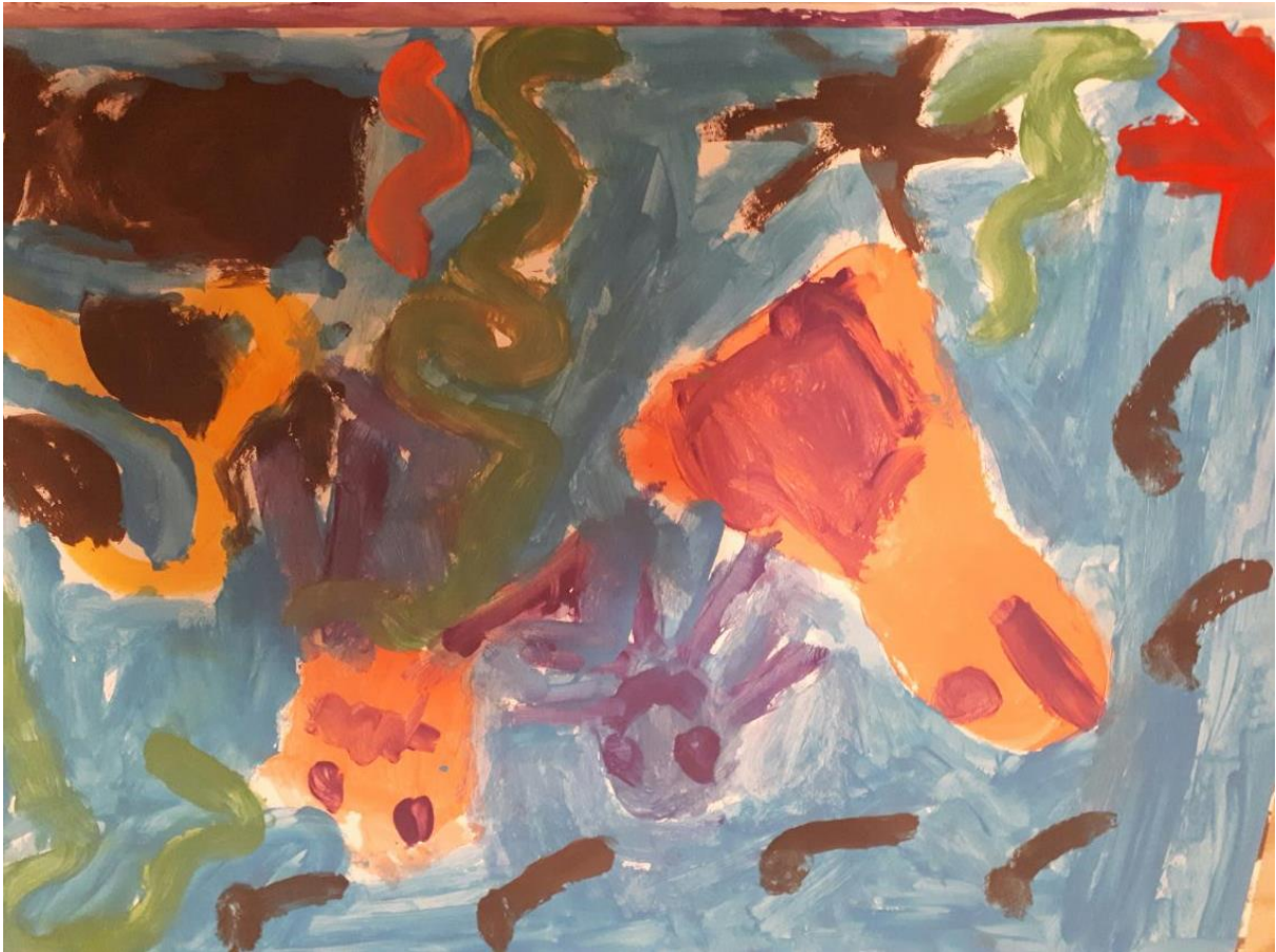
Slika 10. Morsko dno, djevojčica K., 6 god 8mj.

P: Je li ti se svidio današnji zadatak i možeš mi reći što si sve naslikala?