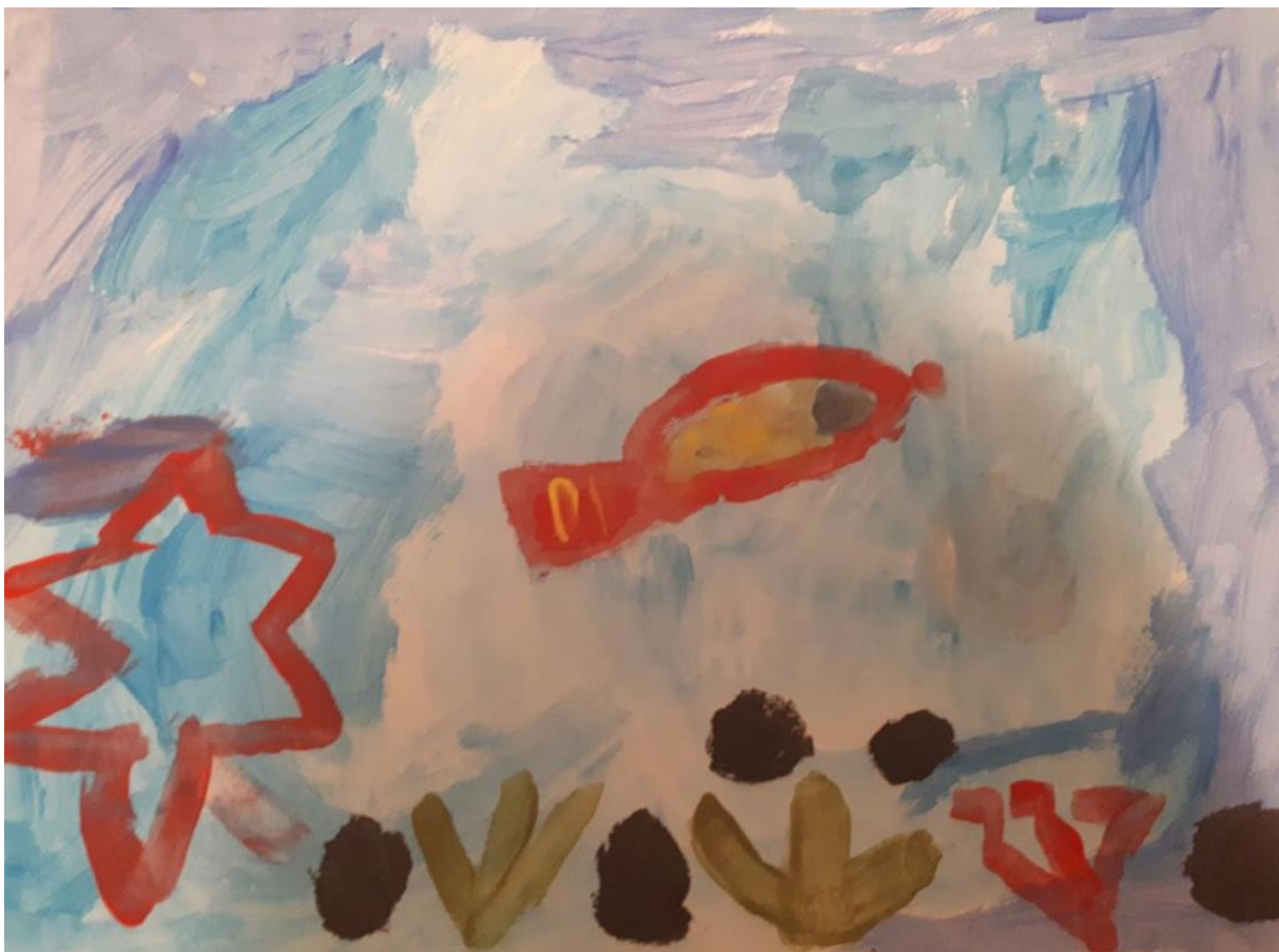
Slika 13. Morsko dno, djevojčica S., 6 god 5mj.

Sljedilo je upoznavanje s posljednjom slikom u sklopu ove aktivnosti.