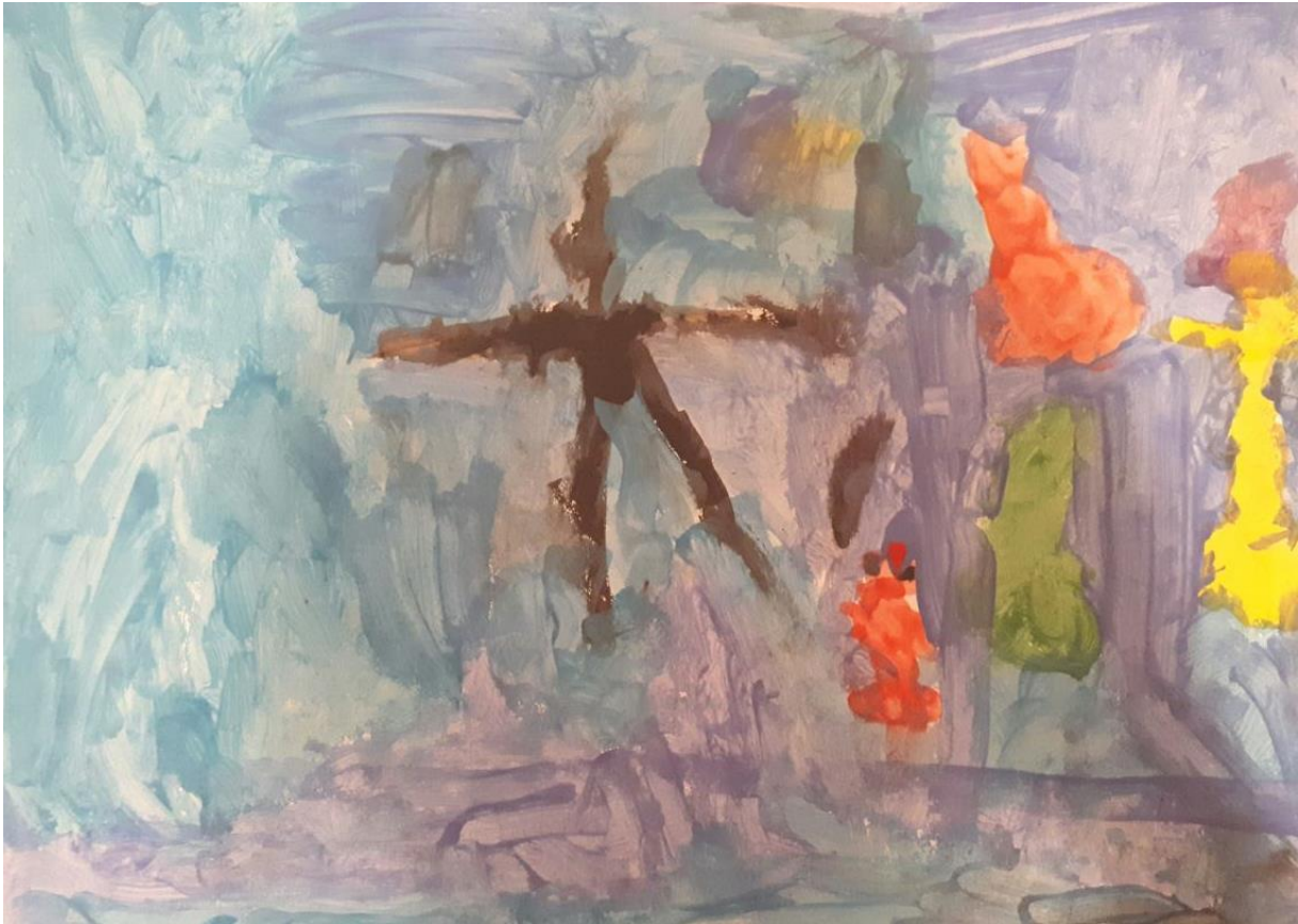
Slika 6. Morsko dno, djevojčica A., 4 god 5mj.