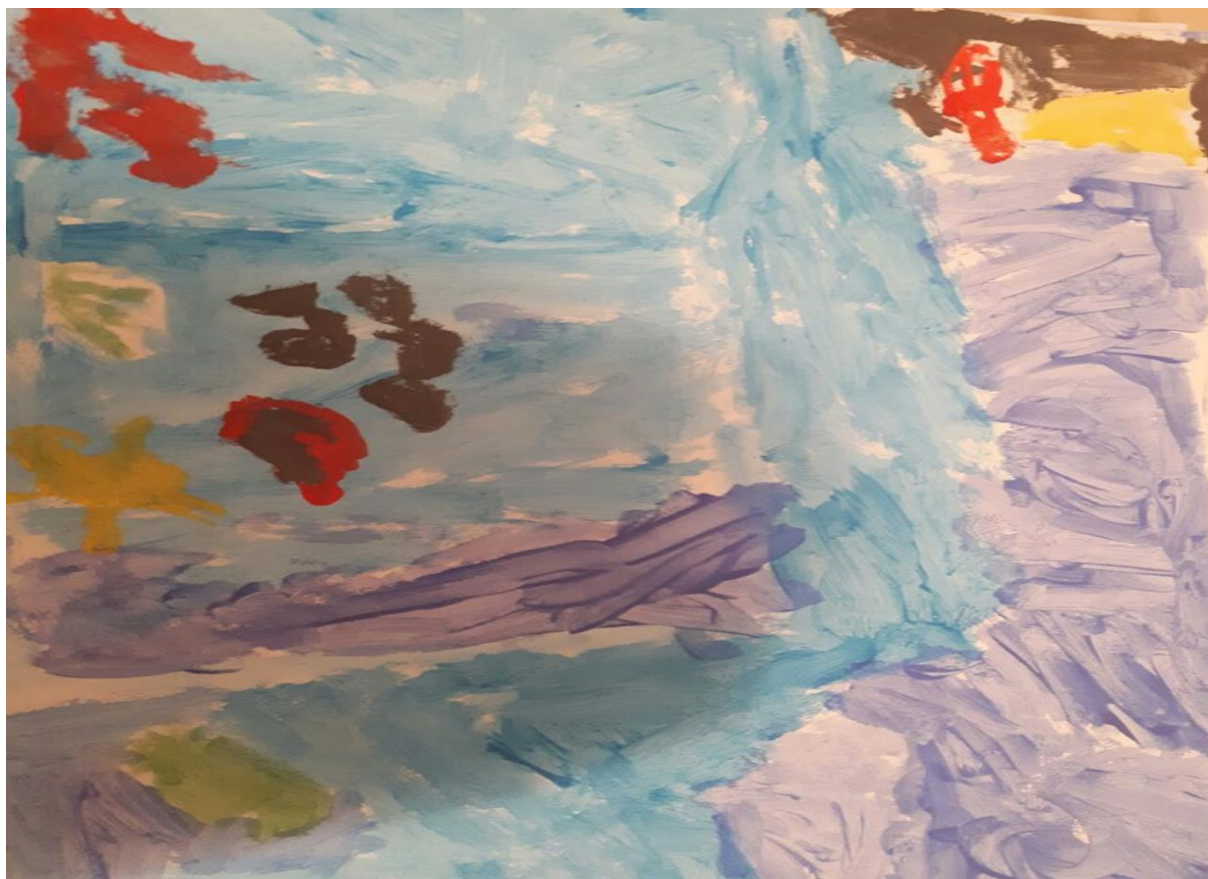
Slika 4. Morsko dno, dječak K., 6 god 8mj.