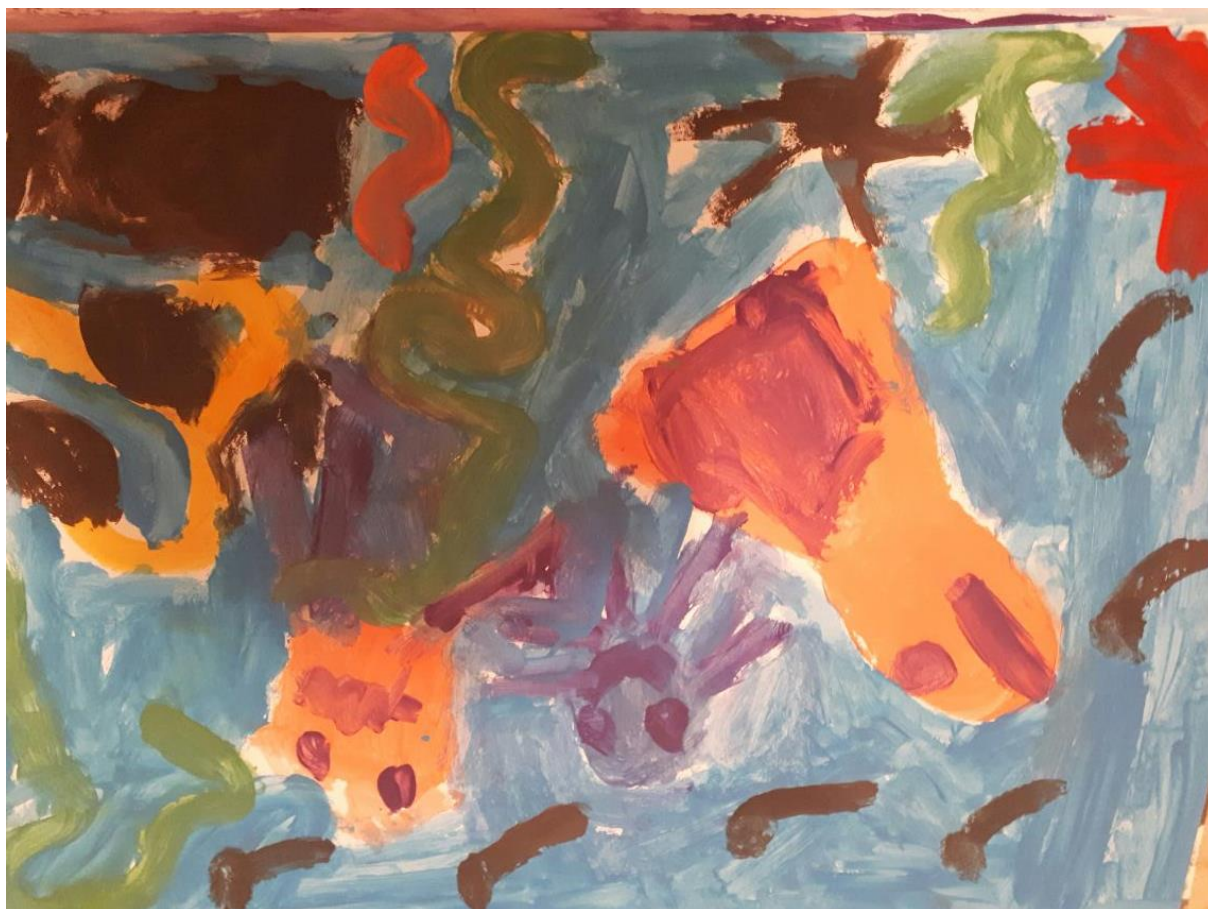
Slika 10. Morsko dno, djevojčica K., 6 god 8mj.

P: Je li ti se svidio današnji zadatak i možeš mi reći što si sve naslikala?