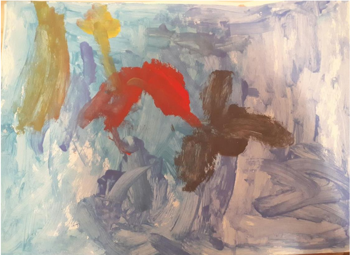
Slika 7. Morsko dno, djevojčica I., 4 god 5mj.

P: Koje biljke ili životinje možete se nalaze na tvojoj slici?