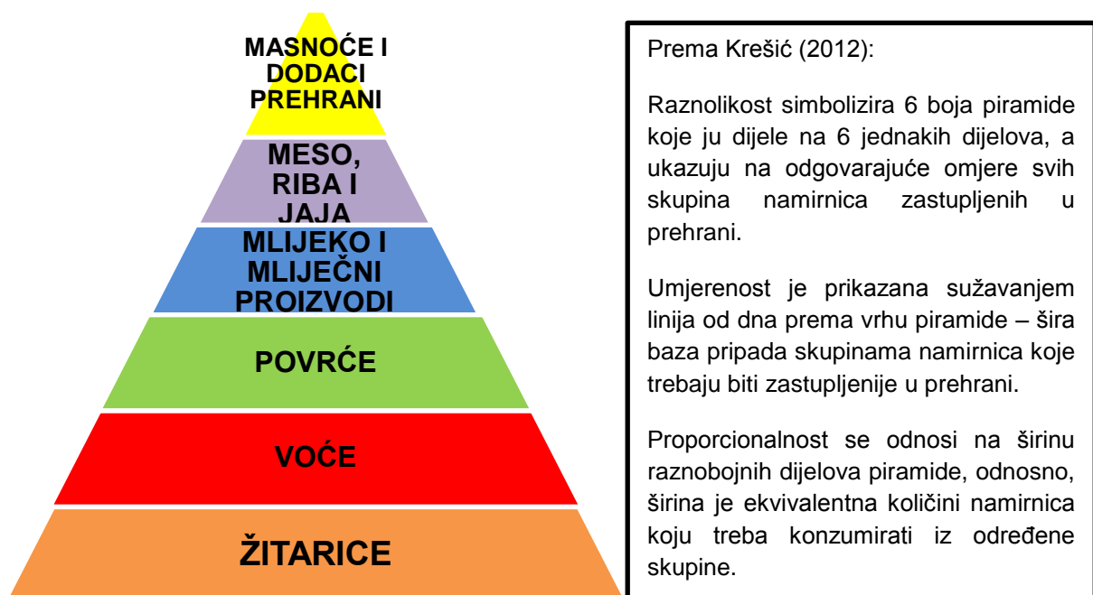
Slika 1. Piramida pravilne prehrane

na spol, dob te specifična stanja (trudnoća i dojenje), 1989. godine u Sjedinjenim Američkim Državama. Američko je Ministarstvo poljoprivrede 1992. godine, uzevši u obzir RDA statistike, konstruiralo prvu piramidu prehrane. Piramida je objavljena u svrhu vodiča (smjernica) pravilne prehrane, a do danas je modificirana u više navrata obzirom na dosadašnja istraživanja. 2005. godine predstavljena je nova piramida koja se razlikuje u broju serviranja hrane te se individualno pristupa faktorima kao što su spol, dob i fizička aktivnost, a time se usvaja i planiranje prehrane za svakoga ponaosob. Nova se piramida temelji na šest ključnih vrsta namirnica (žitarice, voće, povrće, mlijeko i mliječni proizvodi, meso, riba i jaja, masnoće i dodaci prehrani) te 3 osnovna načela pravilne prehrane: raznolikost, umjerenost i proporcionalnost. Prema vrhu piramide smanjuju se porcije unosa.