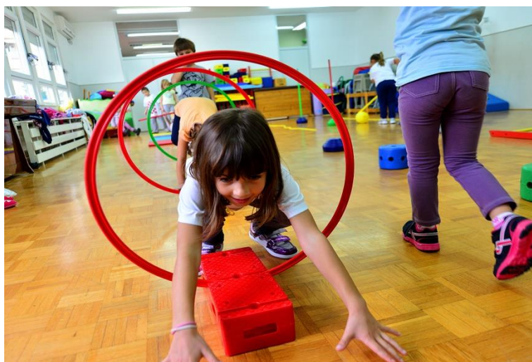
Slika 6. Sat tjelesne i zdravstvene kulture u vrtiću

Sadržaji završnog djela sata moraju biti umirujućeg karaktera i ne smiju izazivati velika opterećenja. Mogu se primjenjivati elementarne igre poput „Pogodi tko te zove“, razgovarati o satu, prati ruke i umivati se i sl.