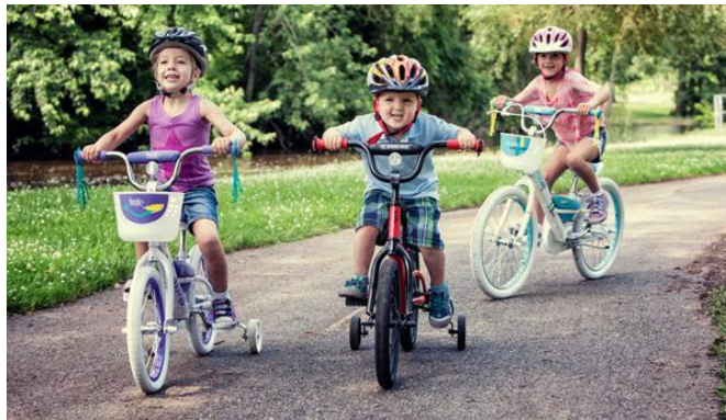
Slika 4. Tematsko vježbanje djece predškolske dobi

Tematsko vježbanje odnosi se na jednu planiranu tjelovježbenu aktivnost koju voditelj provodi i postavlja s djecom. To je jednostavan motorički zadatak koji se može ukratko upisati. Najčešće su nekonvencionalni motorički zadaci kojih ima onoliko koliko je bujna mašta odgajatelja npr. trčanje za balonima. Balon je dobar jer je ujedno i predvježba za rad s loptom i bezopasan je, zatim trčanje s obručem u rukama kao volanom, bacanje lopti u košaru za rublje i sl. Nakon što je voditelj postavio zadatak on prati vježbanje djece i po potrebi ga usmjerava ako se pojavi potreba za tim, npr. mogućnost ozljede. Postavljeni zadaci ovise o dobi djece, a upravo aktivnost djeteta određuje koliko će tematsko vježbanje trajati. Tematsko vježbanje kod djece mlađe dobne skupine traje nekoliko minuta, otprilike od pet do sedam minuta, u starijoj dobnoj skupini može potrajati od dvadeset do trideset minuta. Mlađu vrtićku skupinu može se uvesti u sat igre spajanjem nekoliko različitih tematskih zadataka.