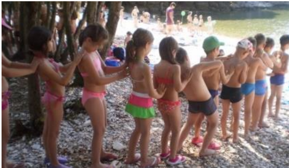
Slika 10. Ljetovanje

odnose se na šetnje, izlete, terenske igre, prirodne oblike kretanja u prirodi. Sadržaji vezani uz vodu jesu prirodni oblici kretanja u vodi, igre u vodi kao i obuka neplivača koja obuhvaća vježbe plutanja, navikavanja na vodu, vježbe disanja i sl.