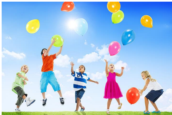
Slika 5. Dinamična igra „Trčanje za balonom“

Sat organizirane igre sastavljen je od dvije do četiri kratke tematske igre ili nekoliko kratkih elementarnih igara. Prva igra mora biti dinamična da pripremi dječji organizam za napore, a zadnja igra mora biti mirnijeg karaktera s ciljem smirivanja organizma. Sat organizirane igre može biti ovakvog karaktera: prvo igra trčanja za balonom, zatim igra glazbene stolice, pa dan, noć i kao zadnja igra pogodi tko te zove. Sat organizirane igre traje otprilike petnaest do dvadeset minuta, a on se češće provodi s djecom mlađe i srednje dobne skupine, a rjeđe s djecom starije dobne skupine. Ovisno o dobnoj skupini voditelj odlučuje kakve će se igre i koliko će se igara provesti na satu organizirane igre. Prema Neljaku (2009) on je prijelazna organizacijska vrsta vježbanja kojom se dijete postupno uvodi prema satu tjelesne i zdravstvene kulture u vrtićima ili satu sportskog tjelesnog vježbanja u sportskim igraonicama ili klubovima.