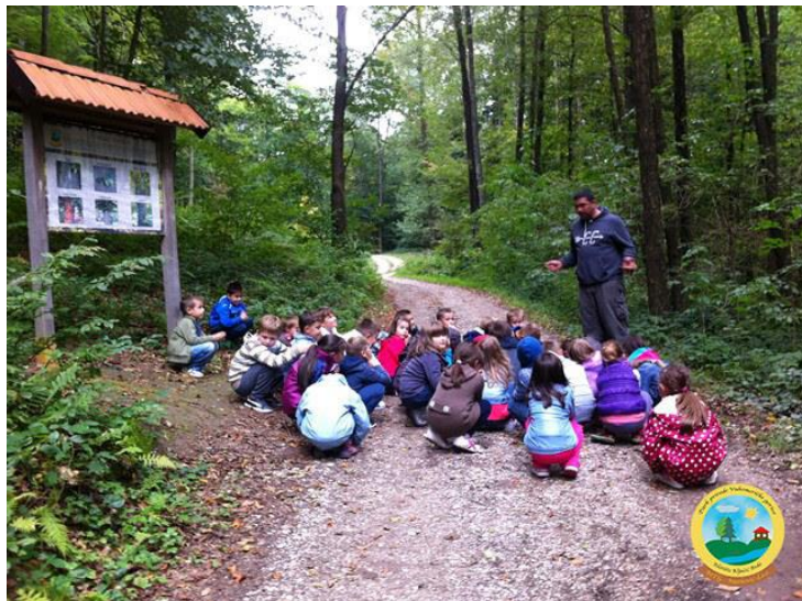
Slika 8. Djeca predškolske dobi na izletu

Izlete je važno provoditi s djecom predškolske dobi, jer se upravo kroz izlete djeca upoznaju s prirodom i uče kako se njome koristiti. Izleti se mogu temeljiti na pješaćenju ili mogu biti kombinacija pješaćenja i prijevoza. Kako bi izlet bio uspješan potrebno ga je dobro pripremiti i organizirati. Prema Findaku (1995) potrebno je odrediti cilj i zadaće, sadržaje i program izleta. Nakon što se odredio cilj i zadaće, potrebno je odrediti mjesto, pravac kretanja, dan i sat kada se kreće i vraća s izleta, mjesto okupljanja, način kretanja. Osim ovih organizacijsko – tehničkih priprema, u pripremu izleta moraju biti uključeni roditelji koje se uputi kako se djeca trebaju pripremiti, što trebaju ponijeti od odjeće, obuće, hrane, pića i sl. Prilikom organizacije izleta važno je obratiti pozornost da odredište izleta bude sigurno za djecu tj. da u blizini nema jama, strmina, da postoji mjesto gdje se mogu smjestiti u slučaju nevremena i sl. Roditelji moraju biti obaviješteni o izletu i odgajatelji trebaju dobiti suglasnost roditelja. Osim što se roditelje obavijesti o izletu potrebno se s njima dogovoriti koliko će roditelja i koji će roditelj uz odgajatelje pratiti djecu na izlet. S djecom je potrebno razgovarati o izletu kako bi se stvorila ugodna atmosfera. Tijekom izleta potrebno se je pridržavati plana i programa, na izlet se treba krenuti i vratiti u dogovoreno vrijeme.