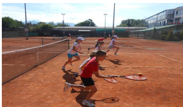
Slika 7. Sat sportskog tjelesnog vježbanja tenisa

Učlanjivanje u sportske klubove najčešće provodi roditelj ako djeca iskažu interes za neki sport, a ponekad roditelji učlanjenje provede autonomno. Ovakva vrsta tjelesnog vježbanja u pravilu se provodi s djecom starije dobne skupine. Struktura sata i obilježja sata su ista kao i kod sata tjelesne i zdravstvene kulture. Sadržaji su usuglašeni s potrebama pojedinog programa npr. skijanja, tenisa i sl. Trajanje sata može trajati četrdeset i pet minuta (npr. sportska gimnastika) ili šezdeset minuta (npr. tenis, plivanje i sl.).