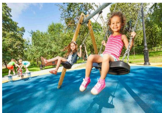
Slika 3. Spontano vježbanje djece predškolske dobi

Spontano vježbanje kod djece predškolske dobi odnosi se na aktivnost koja nije planirana već djeca samostalno provode aktivnost bez organizacije voditelja. Upravo su djeca ta koja biraju sadržaj koji će raditi, npr. ljuljanje na ljuljački, igra u pijesku, klackanje na klackalicama i sl. To su jednostavni kratki motorički zadaci kojima djeca usavršavaju biotička motorička znanja i razvijaju motoričke sposobnosti. Trajanje ove aktivnosti nije određeno, a djeca će s aktivnošću prestati kada im pažnju privuče neka druga aktivnost, kada se umore i sl. Spontano vježbanje trebalo bi se provoditi svakodnevno, ali ne smije biti zamjena za sat tjelesne i zdravstvene kulture. Uloga voditelja je da dobro prati aktivnost djece s ciljem čuvanja, ali se u aktivnost ne uključuje i ne usmjerava je. Ako je neko dijete započelo izvoditi prezahtjevan spontani tjelovježbeni zadatak za njegove mogućnosti, voditelj će tada prekinuti vježbanje i usmjeriti dijete na drugu djetetu primjerenu tjelovježbenu aktivnost.