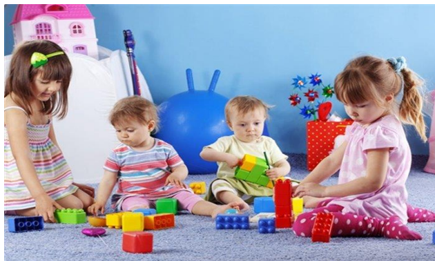
Slika 2. Igra stvaranja kod djece predškolske dobi

sl. Interes za ove igre djeca pokazuju prije polaska u školu. Kroz ove igre djeca uče kako se pošteno pridržavati pravila primjerice da se pošteno žmiri, broji i sl.