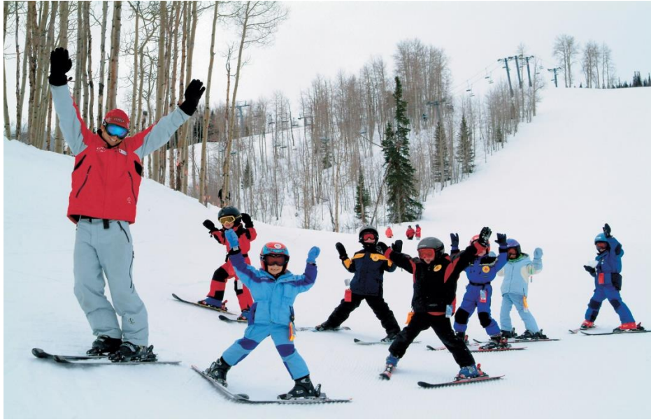
Slika 9. Zimovanje