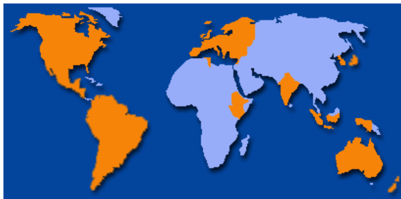
Figura 2. Aree del mondo in cui sono state censite nel 2008 le scuole private di italiano L2 (dal sito IT-schools) 14