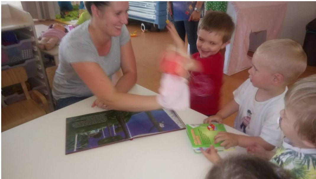
Slika 11. Čitanje priče uz pomoć lutke