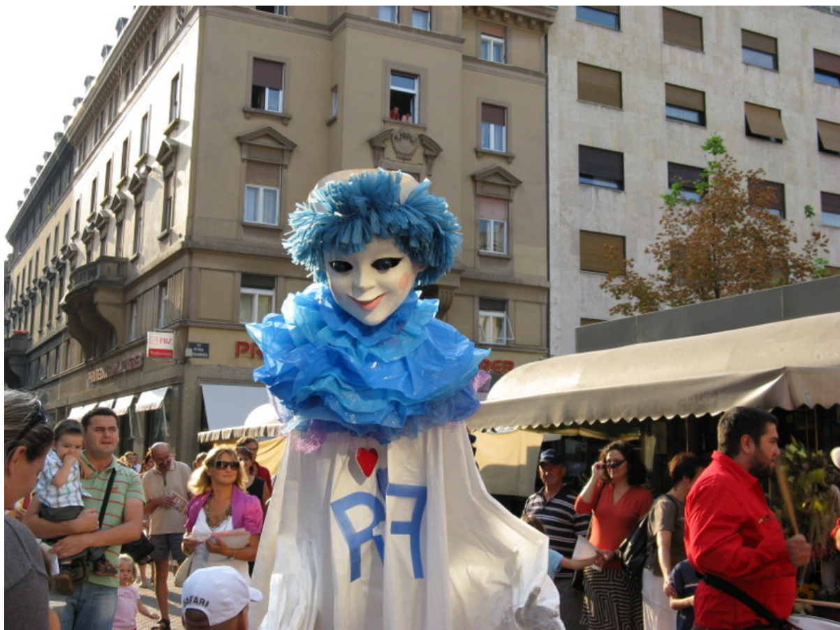
Slika 7. Gigantska lutka javajka – predstavica PIF-a (međunarodni festival lutka) u Zagrebu