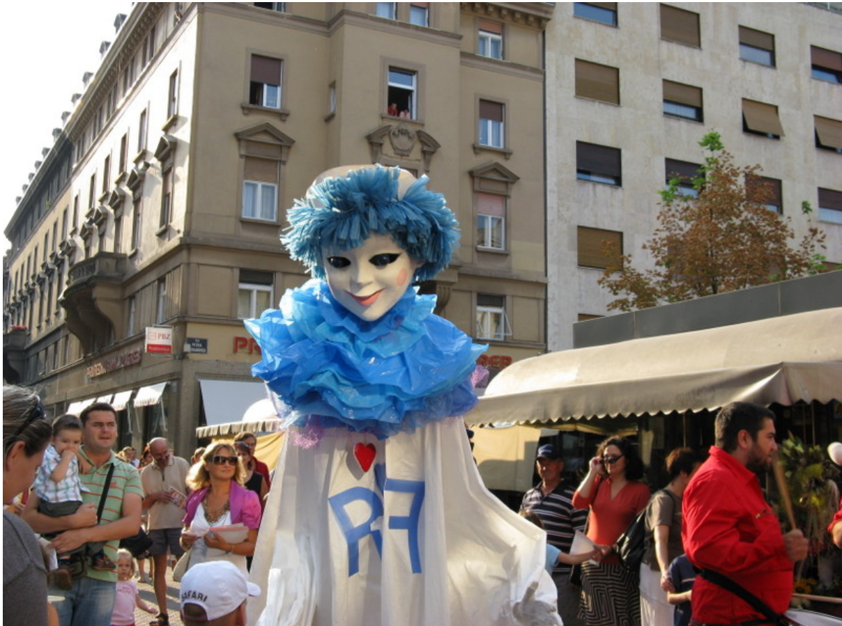
Slika 7. Gigantska lutka javajka – predstavica PIF-a (međunarodni festival lutka) u Zagrebu