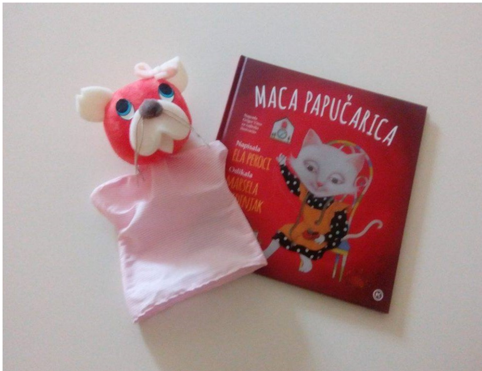
Slika 10. Ginjol lutka Maca Papučarica i istoimena slikovnica

Tako upotrebljavajući lutku, prema Hiceli, odgojitelji najčešće žele uspostaviti i održati pozitivnu komunikaciju s djecom, te poticati razvoj kulturno-higijenskih i radnih navika djece. Lutka zaokuplja te usmjerava pažnju djeteta, najavljuje ponašanje koje se očekuje od djeteta u određenoj situaciji. (Hicela, 2010.) Na taj način lutka postaje dio svakodnevnosti u vrtiću, poseban prijatelj u igri i iskustvu djeteta.