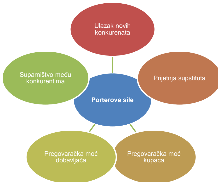
Slika 4. Porterov model pet konkurentskih sila (snaga)