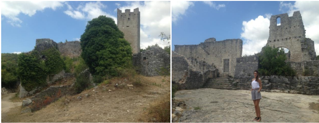
Slika 1. Stari grad Dvigrad

Danas se može prošetati njegovim popločanim ulicama, dijelom uklesanim u živu stijenu, može se doživjeti usnuli grad među stršećim zidovima, s kamenim okvirima prozora i vrata, ostacima svodova, te otkrivati među ruševinama ostatke nekadašnjih kuća i palača (slika 1). Unutar zidina grada može se nabrojati više od dvije stotine kuća, a mnoge su također izgrađene neposredno na živoj stijeni kamenog brijega (Ivančević, 1997).