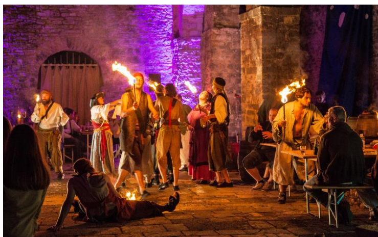
Slika 5. Manifestacija Morganovo blago u Dvigradu