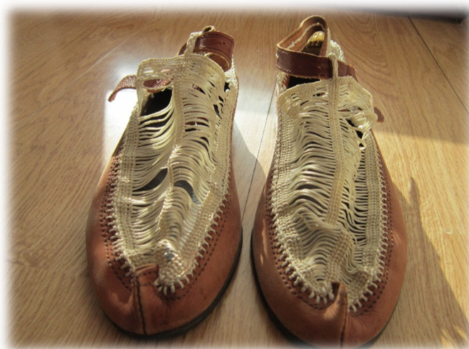
Slika 9. Opanci ( crevlje )