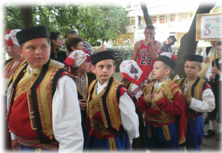
Slika 13. Mlađa folklorna grupa u povorci na Fažanskom tancu

Izvor: Fotografiju snimila članica folklorne sekcije, lipanj 2011. godine, Fažana