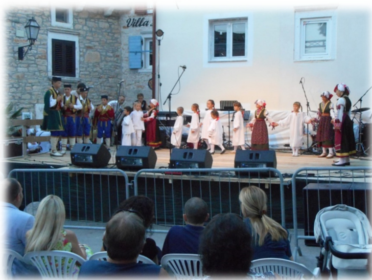
Slika 20. Djeca plešu splet plesova „Igra kolo“ na Perojskoj fešti