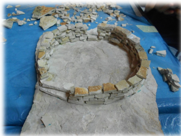
Slika 19. Zidanje „Male gromače“