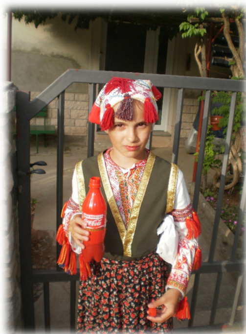
Slika 12. Djevojčica u perojskoj narodnoj nošnji