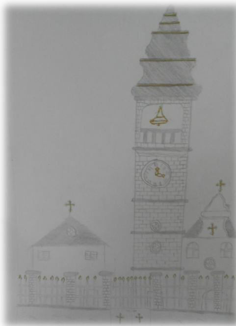
Slika 18. Dječji prikaz crkve svetog Spiridona u tehnici olovka