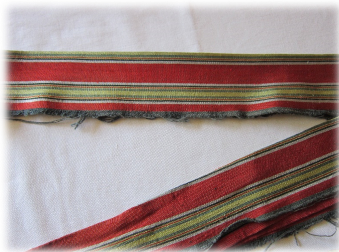
Slika 8. Pojas ( pas )