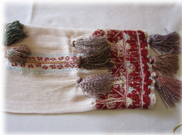
Slika 5. Vez i kite na rukavima