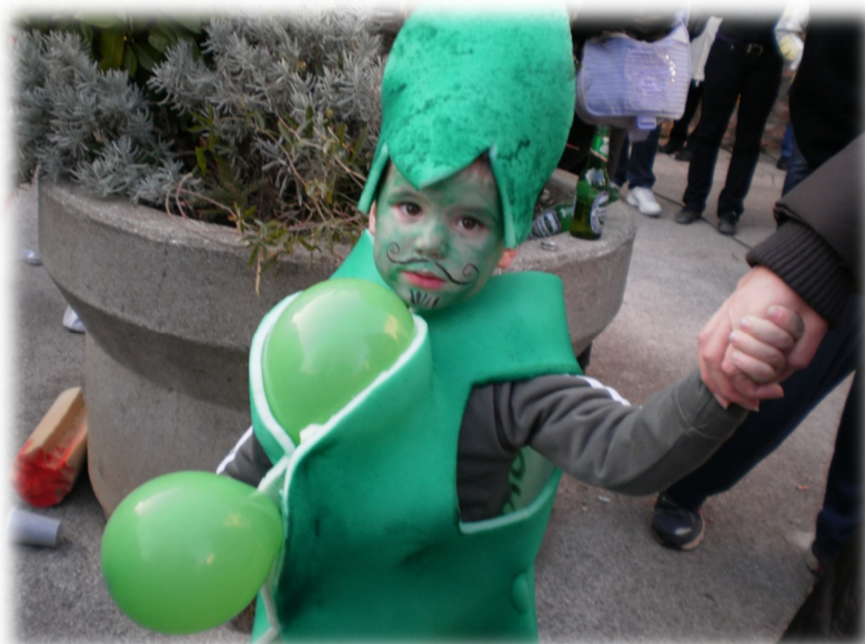
Slika 16. Dječak M.V. u kostimu graška