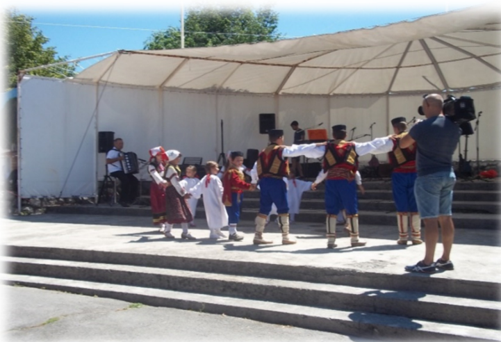
Slika 11. Mlađa folklorna grupa na „Petrovdanskom saboru“ u Ronjgima