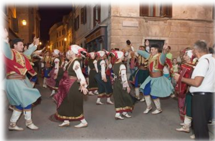
Slika 10. Folklorna sekcija na Međunarodnom festivalu folkloru „Leron“