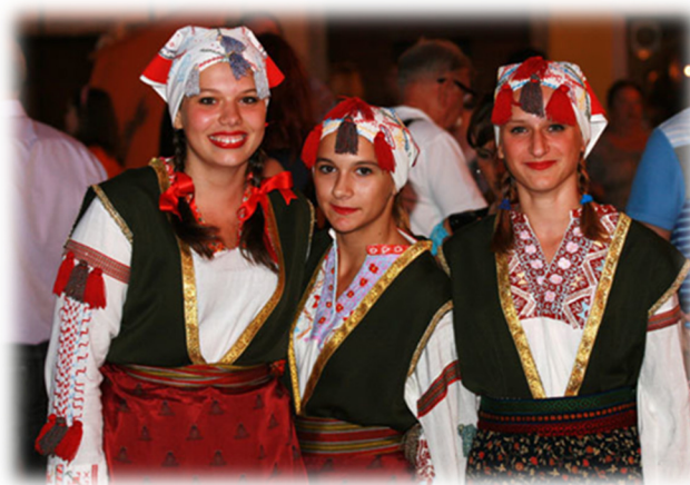
Slika 3. Članice Društva perojskih Crnogoraca „Peroj 1657.“ u narodnoj nošnji