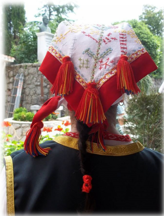
Slika 7. Marama ( faculet )