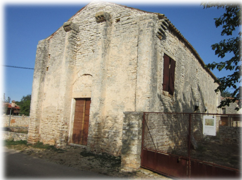
Slika 2. Crkva sv. Stjepana