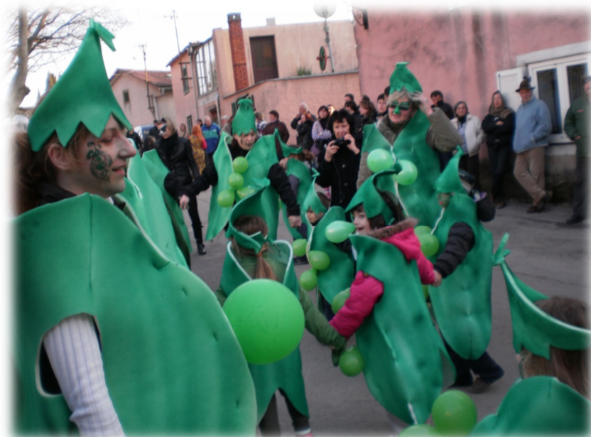
Slika 15. Dječji vrtić „Petar Pan“ Vodnjan, skupina Lavići – djeca, roditelji i odgojiteljice u maškarama