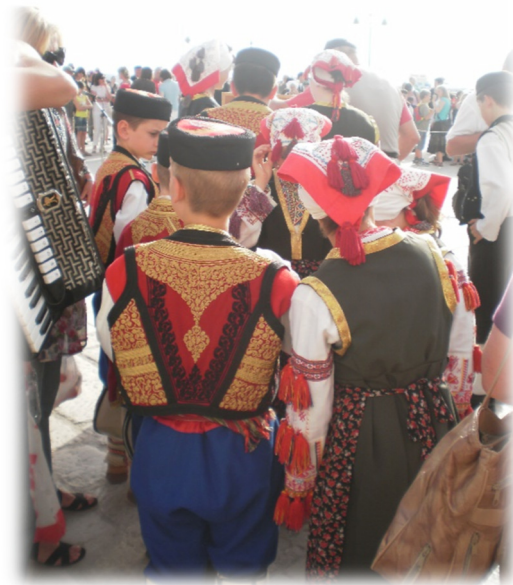
Slika 4. Djeca u narodnoj nošnji, fotografirana s leđa