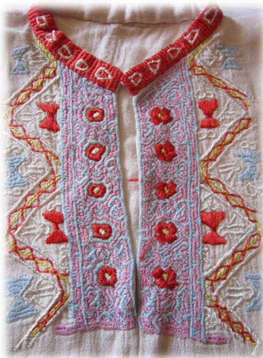
Slika 6. Vez na prsima

Izvor: Autorica rada, fotografirano 21. 07. 2017.