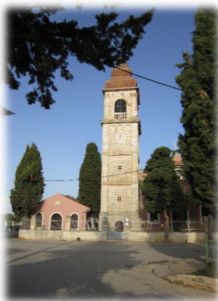
Slika 1. Crkva sv. Spiridona