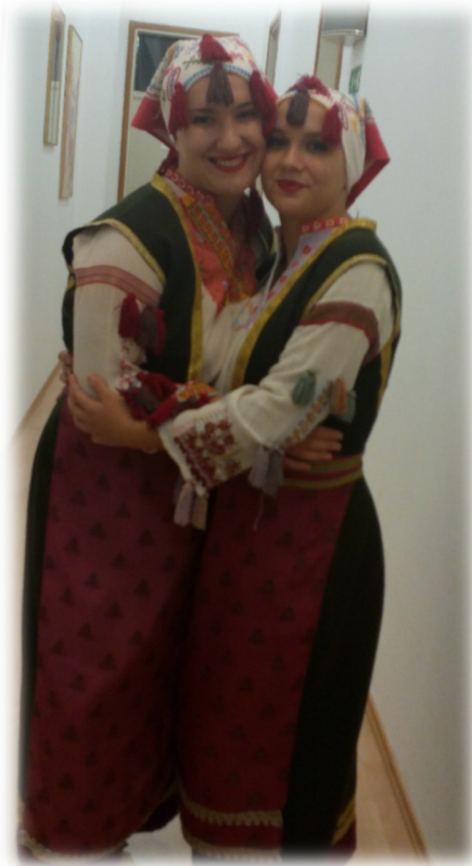
Slika 14. Djevojke u ženskoj narodnoj nošnji

Izvor: Autorica rada, fotografirano 02. 10. 2015., Portorož, Slovenija